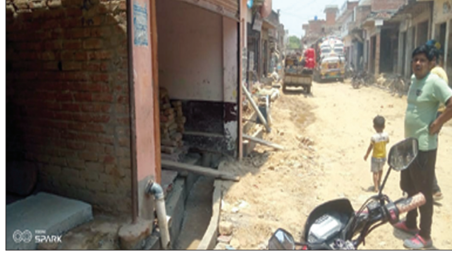
सड़क पर अवरोध

कौशाम्बी। जनपद में अपराध के विरुद्ध चलाए जा रहे अभियान के क्रम में साधारण मारपीट व शांति भंग करने के आरोप में थाना मंझनपुर से तीन थाना महेवाघाट से एक थाना कौशाम्बी से तीन थाना सराय अकिल से एक थाना कोखराज से एक थाना सैनी से दो थाना कड़ाधाम से दो कुल 13 अभियुक्तों को गिरफ्तार कर चालान न्यायालय किया गया।