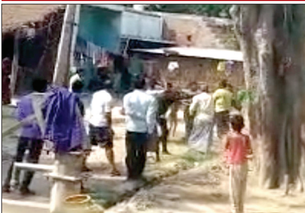
दो भाइयों के बीच मारपीट के बाद मौके पर लगी भीड़

महिला समेत दो घायल, मारपीट का वीडियो सोशल मीडिया पर वायरल