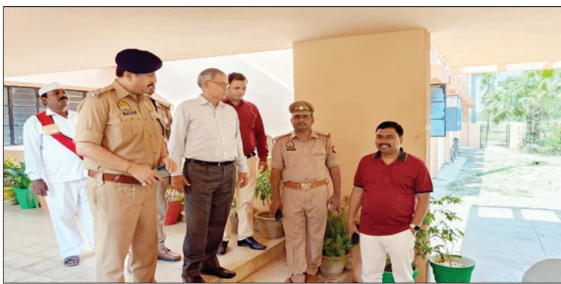
पीसीएस परीक्षा केन्द्रों का निरीक्षण करते डीएम एसपी

कौशाम्बी। पीसीएस परीक्षा को सफल शक्तिपूर्ण संपन्न कराने के लिए डीएम एसपी ने परीक्षा केन्द्रों का भ्रमण कर शिक्षकों को सख्त निर्देश दिया है उन्होंने कहा कि परीक्षा में किसी प्रकार की गड़बड़ी बर्दाशत नहीं की जाएगी जिले के तीन कालेज में पीसीएस प्री की परीक्षा आयोजित की गई है। इस दौरान डीएम एसपी ने संयुक्त अभियान के अंतर्गत तीनों परीक्षा केन्द्रों का निरीक्षण किया। निरीक्षण के दौरान परीक्षा ड्यूटी में तैनात शिक्षकों को शुचिता पूर्ण परीक्षा संपन्न कराने के डीएम एसपी ने दिशा निर्देश जारी किया। मालूम हो कि प्रदेश सरकार द्वारा पीसीएस परीक्षा का जिले के तीन कालेजों में आयोजन किया गया। जिसमें दुर्गा देवी इंटर कॉलेज ओसा, भवंस मेहता डिग्री कॉलेज, और भवंस मेहता विद्याश्रम इंटर कॉलेज में परीक्षा आयोजित की गई है। परीक्षा को सुचिता पूर्ण एवं नकल विहीन संपन्न कराने के लिए डीएम सुजीत कुमार और एसपी वृंजेश कुमार श्रीवास्तव ने संयुक्त