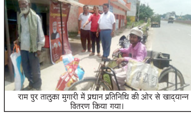
राम पुर तालुका मुगारी में प्रधान प्रतिनिधि की ओर से खाद्यान्न वितरण किया गया।