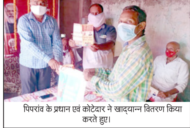
पिपरांव के प्रधान एवं कोटेदार ने खाद्यान्न वितरण किया करते हुए।