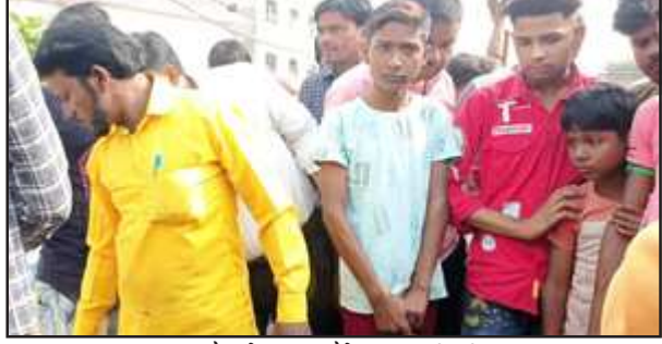
मौत के बाद मौके पर लगी भीड़।

कौशाम्बी। मंझनपुर कोतवाली क्षेत्र के समदा चौराहे के पास खुले नाले में एक साइकिल सवार गिर गया है जिससे अधिक चोट लग जाने के कारण उसकी मृत्यु हो गई है सूचना मंझनपुर कोतवाली पुलिस को मिली मौके पर पहुंची पुलिस ने नाले से युवक को बाहर निकालकर अस्पताल भेजा है जहां चिकित्सकों ने उसे मृत घोषित कर दिया है घटना की सूचना परिजनों को दी गई है सूचना मिलते ही घटनास्थल पर रते बिलखते परिजन पहुंचे हैं पुलिस ने युवक के शव को कब्जे में लेकर पोस्टमार्टम के लिए भेज दिया है