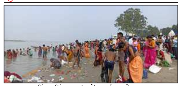
कार्तिक पूर्णिमा पर गंगा में डुबकी लगाते श्रद्धालु।

त्रिपाठी ने बताया कि मेला कई दशक से लगता चला आ रहा है जिसमें आये हुए दुकानदारों व मेलाथियों की पूरी सुरक्षा को ध्यान में रखा जाता है शरारती तत्वों पर कमेटी के सदस्य निगरानी करते रहते हैं,