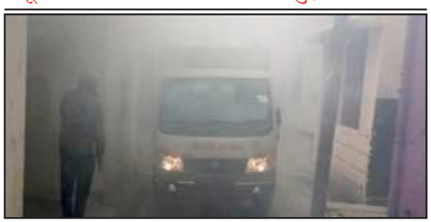
हॉट स्पॉट क्षेत्रों में सुबह से फागिंग का धुआं उड़ती गाड़ियां।

वार्ड, घोसियाना वार्ड, अर्जुत नगर व चैक क्षेत्र में सुबह पांच बजे से सघन फागिंग की गई। इस बारे में