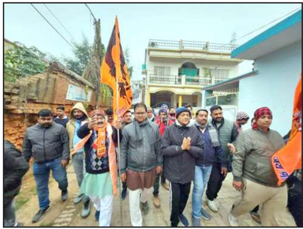
नगर में प्रभात फेरी में शामिल समिति के पदाधिकारी

प्रतापगढ़ नगर में भी सभी बस्तियों में प्रभात फेरी निकाली गई, जिसमें बड़ी संख्या में मातृ शक्ति उपस्थित रही। नगर की केशव बस्ती में भी बड़ी संख्या में राम भक्त उपस्थित होकर प्रातः काल वाद्य यंत्रों के साथ श्री राम जय राम जय जय राम का संकीर्तन करते हुए एवं जय श्री राम का उद्घोष करते हुए