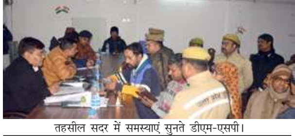
तहसील सदर में समस्याएं सुनते डीएम-एसपी।