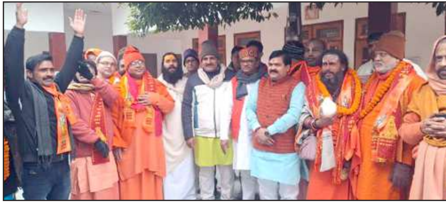
स्टेशन पर संतों का स्वागत करते सांसद, विधायक व अन्य।