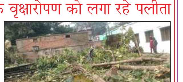
कटे पड़े पेड़।

चित्रकूट। नगर पालिका परिषद ने बीती रात दस बजे नगर पालिका के पीछे बने राजकीय पुस्तकालय मैदान से सागौन व नीम आदि के हरे-भरे पेड़ों पर आरी चलाया दी। शनिवार को भी हरे-भरे पेड़ों को काटाई जारी रही। नगर पालिका ने ट्रैक्टरों में भर-भर कर लकड़ियों को गोपनीय स्थान पर भेजा है। उस स्थान पर न सड़क है और न कोई ऐसा कार्य होना है। रातों-रात हरे पेड़ों का कटवाना नगर के विकास में सवाल खड़ा करता है। हरे-भरे पेड़ों को निम्नता से कटवाकर सूबे के मुख्यमंत्री योगी आदित्यनाथ के वृक्षारोपण योजना