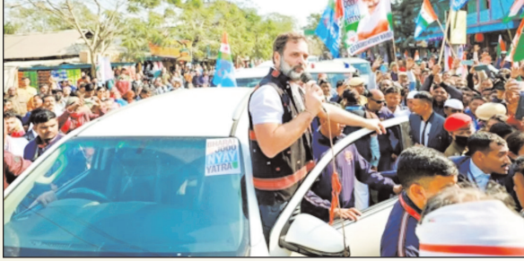
यात्रा को मिले समर्थन के बाद पार्टी 2024 के लोकसभा चुनाव में

नई दिल्ली अगले लोकसभा चुनाव में पार्टी की सीटों का आंकड़ा तीन अंकों तक पहुंचाने के पहाड़ जैसे लक्ष्य को हासिल करने की कोशिशों में जुटी कांग्रेस को पूर्वोत्तर राज्यों में राहुल गांधी की भारत जोड़ो न्याय यात्रा से काफी उम्मीदें बंधी हैं। बेहतर प्रदर्शन की उम्मीद में कांग्रेस