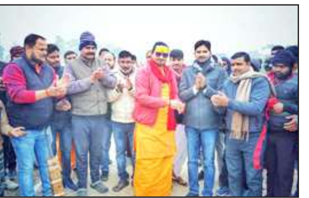
मिश्रपुर क्रिकेट टूर्नामेंट का उद्घाटन करते आचार्य देव व्रत महाराज।

खिलाड़ियों को अपने सम्बोधन में हौसला बढ़ाते हुए कहा कि खेल को लक्ष्य मानकर खेलें तभी सफलता मिलती है प्रतियोगिता में भाग लेने से प्रतिभा उभर कर सामने आती है खेल कूद में हार जीत कोई मायने नहीं रखता। कोई भी खेल हो उसे जीत समझकर खेलें तभी