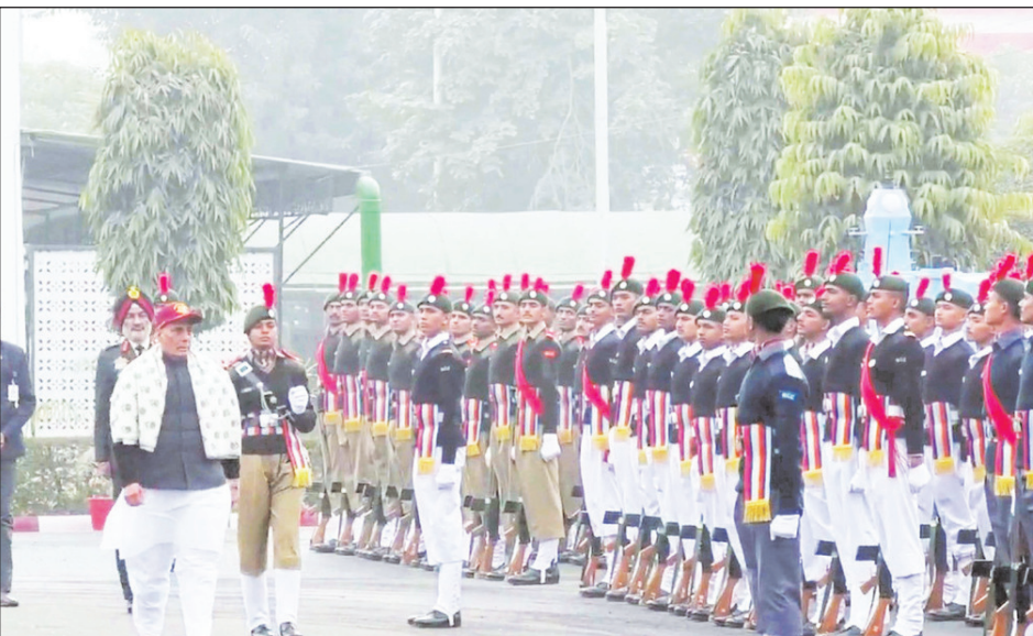
नई दिल्ली में डीजीएनसीसी कैंप, करियप्पा परेड ग्राउंड, दिल्ली कैंट में रक्षा मंत्री राजनाथ सिंह ने एनसीसी गणतंत्र दिवस शिविर 2024 का दौरा।

आप को झटका: आप छोड़ भाजपा में शामिल हुए अशोक तंवर