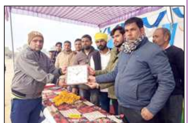
पुरस्कार देते अतिथि।