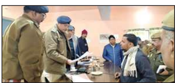
फरियादियों की समस्यायें सुनते आईजी जोन प्रयागराज।