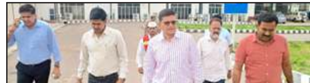
एयरपोर्ट का निरीक्षण करते डीएम आदि।

जो नये कार्य कराने हैं, उनके प्रस्ताव शासन को भेजकर मंजूर करायें। डीएम ने एडीएम एफआर व एसडीएम सदर से कहा कि नये रनवे को नई टर्मिनल बिल्डिंग निर्माण व फिलिंग स्टेशन निर्माण को भूमि चिन्हित करनी है, निरीक्षण कर चिन्हित कराकर एयरपोर्ट अथॉरिटी को दें। डीएम ने निदेशक एयरपोर्ट से फ्लाइट संचालन बाबत जानकारी ली। निदेशक एयरपोर्ट ने बताया कि सप्ताह में तीन दिन फ्लाइट का संचालन हो रहा है। डीएम ने राइट्स संस्था के अधिकारियों