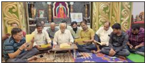
महोत्सव को लेकर मंथन करते साईं भक्त।