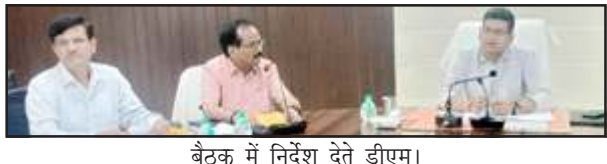
बैठक में निर्देश देते डीएम।