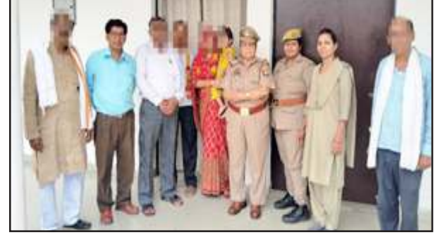
विवाद सुलझाती पुलिस।