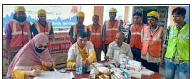
नगर पालिका के सभागार में लगे शिविर में जांच करते चिकित्सक।

नगर पालिका के सभागार में स्वास्थ्य विभाग ने लगाया शिविर अखंड भारत संदेश प्रतापगढ़। शासन के निर्देश पर आज नगर पालिका परिसर में सफाई कर्मचारियों तथा नगर पालिका कर्मचारियों का स्वास्थ्य परीक्षण किया गया एवं चिकित्सकों द्वारा उन कर्मचारियों को निःशुल्क दवाओं का वितरण किया गया। मंगलवार को दिन में 11 बजे से तीन बजे तक 100 सफाई कर्मचारियों का स्वास्थ्य परीक्षण हो चुका था। नगर