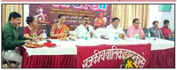
जीजीआईसी में आयोजित कला उत्सव में मौजूद अतिथिगण।

12 के छात्र छात्राओं में कला, साहित्य, नृत्य, दृश्य कला, ललित कलाओं और संगीत को बढ़ावा देने के लिए मंगलवार को राजकीय बालिका इंटर कॉलेज प्रतापगढ़ में कला उत्सव प्रतियोगिता का आयोजन किया गया। इसमें जिले