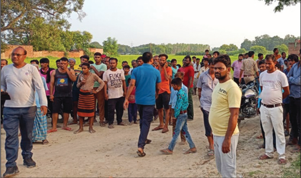
अखंड भारत संदेश

घटना स्थल पर लगा ग्रामीणों का मजमा सूचना पाकर पहुंची पुलिस