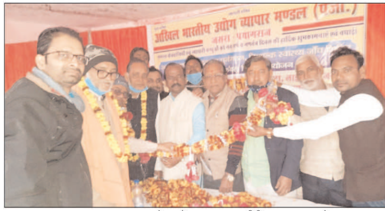
जसरा व्यापार मंडल सम्मेलन में स्वागत मुख्य अतिथि का स्वागत करते