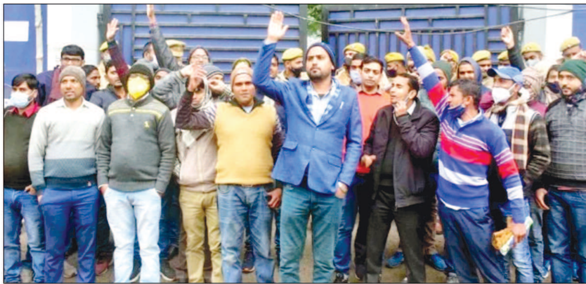
लोक सेवा आयोग पर प्रदर्शन करते प्रतियोगी छात्र

प्रयागराज। एलटी ग्रेड शिक्षक भर्ती के लिए वृहस्पतिवार को उत्तर प्रदेश लोक सेवा आयोग (यूपीपीएससी) में प्रतियोगी छात्रों ने प्रदर्शन किया। युवा मंच के बैनर तले बड़ी संख्या में जुटे छात्रों ने मांग की कि चुनाव आचार संहिता लागू होने से पहले एलटी ग्रेड शिक्षक भर्ती का विज्ञापन जारी किया जाए। प्रतियोगियों का कहना है कि पिछले सात वर्षों में सिर्फ एक बार एलटी ग्रेड शिक्षक भर्ती का आयोजन किया गया। विद्यालयों में शिक्षकों के हजारों पद रिक्त पड़े हैं। प्रतियोगी छात्रों ने मीडिया प्रभारी को जापन सौंपा। प्रतियोगियों को बताया गया कि चयन प्रक्रिया एवं विज्ञापन जारी होने करने में आचार संहिता कोई बाधा नहीं है, क्योंकि इस बारे में शासन की ओर से निर्णय लेकर चयन प्रक्रिया शुरू करने के बाबत दिशा-निर्देश दिए जा चुके हैं और अब शासन को कोई नया आदेश जारी नहीं करना है।