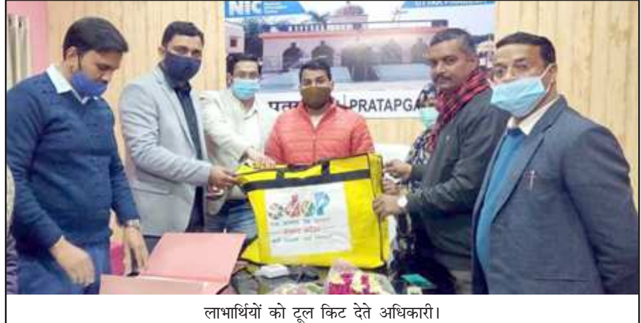
लाभार्थियों को टूल किट देते अधिकारी।

स्वरोजगार संगम कार्यक्रम में जनपद के लाभार्थियों को 1 करोड़ का ऋण वितरण किया गया जिसके अन्तर्गत स्टैण्डअप