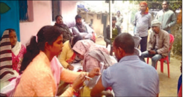
टीकाकरण केन्द्र पर टीका लगवाते लोग