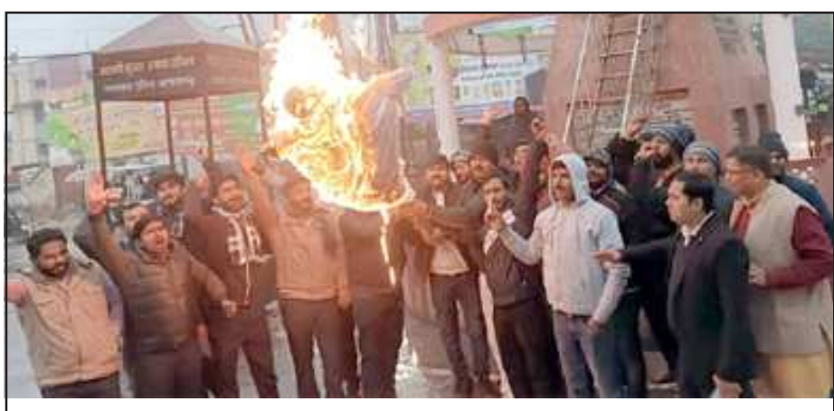
पंजाब के मुख्यमंत्री का पुतला दहन करते युवा मोर्चा के पदाधिकारिण।