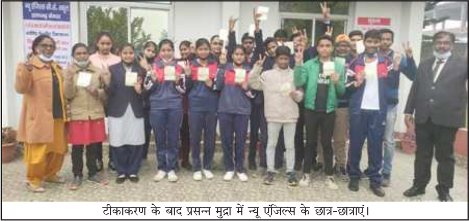
टीकाकरण के बाद प्रसन्न मुद्रा में न्यू एंजिल्स के छात्र-छात्राएं।