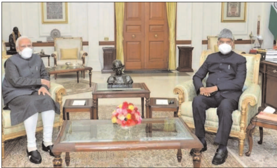
पंजाब में हुई सुरक्षा चूक मामले पर राष्ट्रपति रामनाथ कोविंद से मिले प्रधानमंत्री नरेंद्र मोदी, उपराष्ट्रपति वेंकैया नायडू ने भी चिंता जताई।

लिस्ट में शामिल किया हुआ है। वहां से फ्लाइट के करीब 11.30 बजे अमृतसर हवाई अड्डे पर लैंड होने के बाद हर यात्री का टेस्ट करने के आदेश दिए गए। फ्लाइट में कुल 179 यात्री थे।