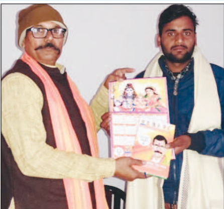
अखंड भारत संदेश

करछना में दर्जन भर से अधिक पत्रकार हुए सम्मानित