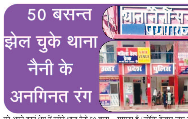
अखंड भारत संदेश

प्रयागराज। तीर्थराज प्रयागराज महानगर के थाना नैनी अपने स्थापना के 50 बसन्त के बाद भी पूणता के सपने देखते हुए अन्यायपूर्ण इटकों के बीच लोगों को न्याय दिलाने के पथ पर आज भी अग्रसर है। जानकारी के मुताबिक प्रयागराज महानगर का जुड़वा शहर कहे जाने वाले नैनी को औद्योगिक क्षेत्र के रूप में प्रसिद्धि प्राप्त है। नैनी थाना व थाना औद्योगिक क्षेत्र के रूप में दो पुलिस स्टेशन स्थापित हैं। जिनमें 1972 में स्थापित थाना नैनी वर्तमान 2022 में अपने स्थापना के 50 वर्ष पूरे कर रहा है। बताया जाता है कि आगामी 26 जनवरी को थाना नैनी के 50 वर्ष पूरे होने पर कार्यक्रम का आयोजन किया जाएगा।