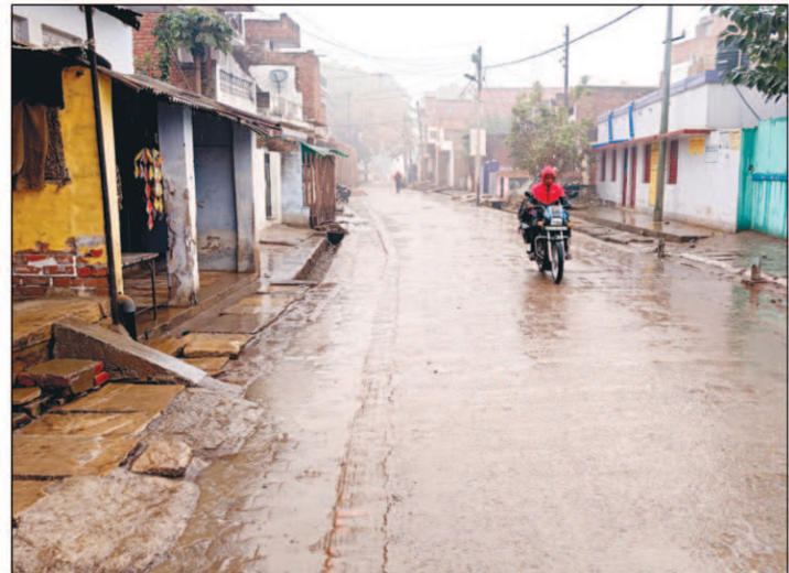
क्षेत्र में सर्द हवाओं व रिमझिम बारिश का दिन भर इस तरह से रहा दूरय।

शंकरगढ़। बुधवार को जहां दोपहर तक कोहरा का कहर जारी रहा, वहीं गुरुवार की सुबह जब लोग बिस्तर छोड़ बाहर निकले तो आसमान बादलों से ढका नजर आया। उम्मीद थी कि दोपहर होने तक मौसम कुछ साफ हो सकता है। सुबदेव के दर्शन मिल सकते हैं, लेकिन सुबह से ही बादलों से रिमझिम फुहारें गिरने लगीं और दोपहर होते होते रिमझिम फुहारों ने रफतार पकड़ ली। यह हाल पूरे यमुनापर का रहा। जनपद प्रयागराज के साथ ही समीपवर्ती जनपद प्रतापगढ़, चित्रकूट, मध्यप्रदेश और कौशांबी में कई स्थानों पर घंट भर फुहारें पड़ती रहीं।