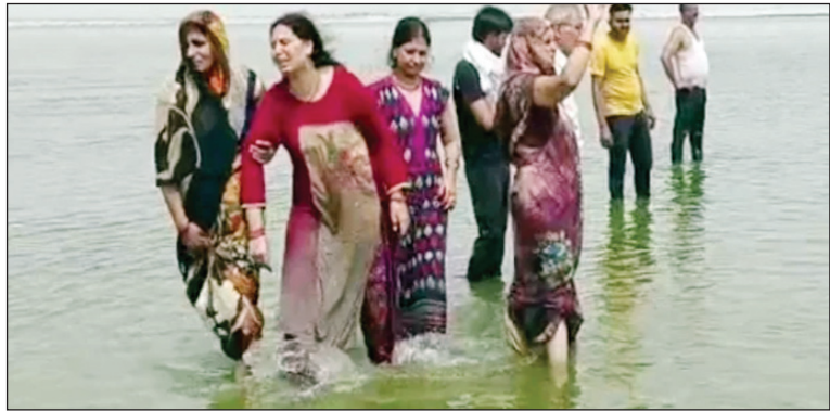
बदहावस अवस्था में डूबे हुए बच्चों के परिजन