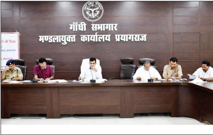
मंडलीय समीक्षा बैठक करते मंडलायुक्त

प्रयागराज। मण्डलायुक्त संजय गोयल की अध्यक्षता में सोमवार को गांधी सभागार में मण्डलीय उद्योग बंधु समिति की बैठक आयोजित की गयी। बैठक में मण्डलायुक्त ने उद्यमियों की समस्याओं को एवं उनके लम्बित आवेदन पत्रों को शीघ्र प्रार्थमिकता पर निस्तारित करने के निर्देश सम्बन्धित विभागों के अधिकारियों को दिए हैं। मण्डलायुक्त ने यह भी निर्देशित किया कि अनापत्ति प्रमाणपत्र भी निर्धारित समयसीमा के अन्तर्गत निर्गत किए जाएं। बैठक में निवेश मित्र पोर्टल पर प्राप्त प्रकरणों/समस्याओं को निर्धारित समयसीमा के अन्तर्गत निस्तारित करने तथा एमएसएमई विभाग की 100 दिन की कार्ययोजना के अन्तर्गत शत-प्रतिशत लक्ष्य प्राप्त करने के निर्देश दिए हैं। उन्होंने मुख्यमंत्री युवा स्वरोजगार योजना, प्रधानमंत्री रोजगार सृजन कार्यक्रम, एक जनपद एक उत्पाद योजना के अन्तर्गत शत-प्रतिशत लक्ष्य की प्राप्ति सुनिश्चित करने का निर्देश दिया है। उद्यमियों द्वारा औद्योगिक क्षेत्र नैनी में जल निकासी की समस्या उठाये जाने पर मण्डलायुक्त ने यूपीएसआईडीसी तथा नगर निगम को आपसी समन्वय बनाते हुए नालियों की साफ-सफाई नियमित रूप से कराये जाने का निर्देश दिया है। उन्होंने विद्युत विभाग को उद्यमियों की