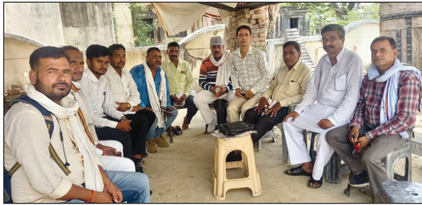
हिंदी पत्रकारिता दिवस पर चर्चा करते तमाम पत्रकार

दिया जाए लेकिन ब्रिटिश हुकूमत ने उनकी नहीं सुनी 79 अंक निकालने के बाद अखबार के संपादक की व्यवस्था चरमरा गई और अखबार का प्रकाशन 4 दिसंबर 1827 से बंद हो गया लेकिन 30 मई 1826 को हिंदी पत्रकारिता दिवस मनाया जाने लगा जो 195 वर्ष बाद भी निरंतर पत्रकार एक मंच पर एकत्रित होकर अपनी आवाज एक दूसरे से साझा करते हैं और हिंदी