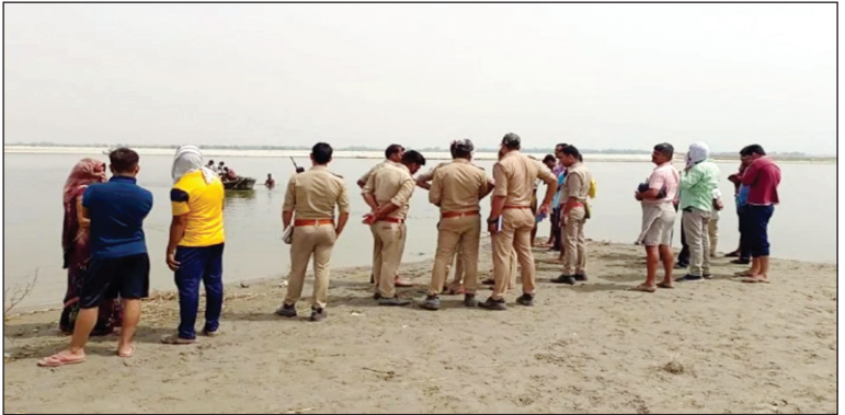
गंगा में डूबे वे बच्चों के छानबीन में लगी पुलिस