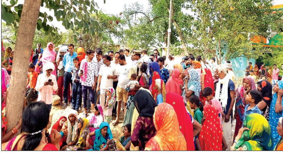
युवक की मौत को लेकर सड़क पर जाम लगाये परिजन व ग्रामीण