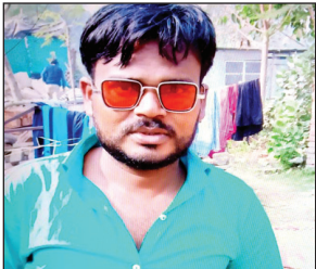
युवक पिता-पुत्र की फाइल फोटो

प्रशासन का इस ओर ध्यान आकृष्ट कराते हुए तालाब में पशुओं को गर्मी में पानी पीने हेतु व्यवस्था बनाये रखने की लोगों ने जिलाधिकारी प्रयागराज से मांग की है।