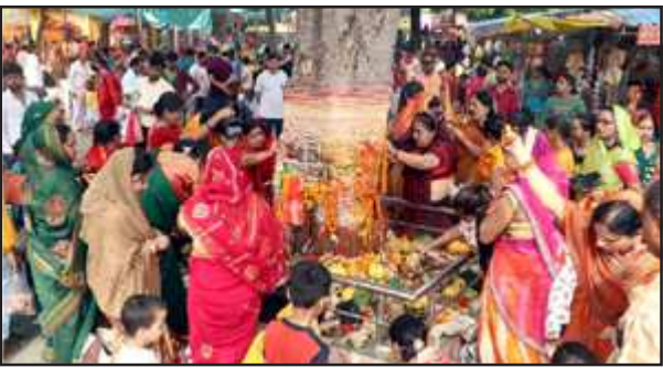
बरगद के वृक्ष की पूजा अर्चना करती सुहागिनों।

प्रतापगढ़। जिले में महिलाओं ने वट सावित्री की विधि-विधान से पूजा की। पति की लंबी आयु और अखंड सौभाग्य की कामना के लिए व्रती सुहागिनों ने बरगद की पूजा की। इस बार सोमवती अमावस्या और शनि जयंती का विशेष संयोग है। वट सावित्री की पूजा के लिए सूर्योदय के साथ ही बरगद के वृक्ष के नीचे सुहागिन जुटना शुरू हो गई थीं। बरगद के तने को कच्चे सूत (घागा) से लेपेट कर व्रत रखने वाली महिलाओं ने 7 या 21 बार परिक्रमा की। व्रती महिलाओं ने हलवा-पुड़ी, गुड़, भिगोया चना, आटे से बनी मिठाई, कुमकुम,