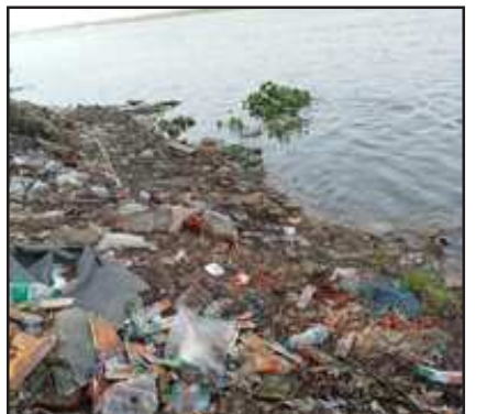
पालीथीन व गंदगी से पटा गंगा का किनारा।

पालीथीन, प्लास्टिक बोतल एवं अन्य पूजा सामग्री फेंक देते हैं जो गंगा घाटों को गन्दा करने के साथ ही गंगा जल को भी प्रदूषित कर रहे हैं इसकी साफ सफाई न होने से कूड़ा कचरा दिनों दिन बढ़ता ही जा रहा है यदि जल्द ही घाट