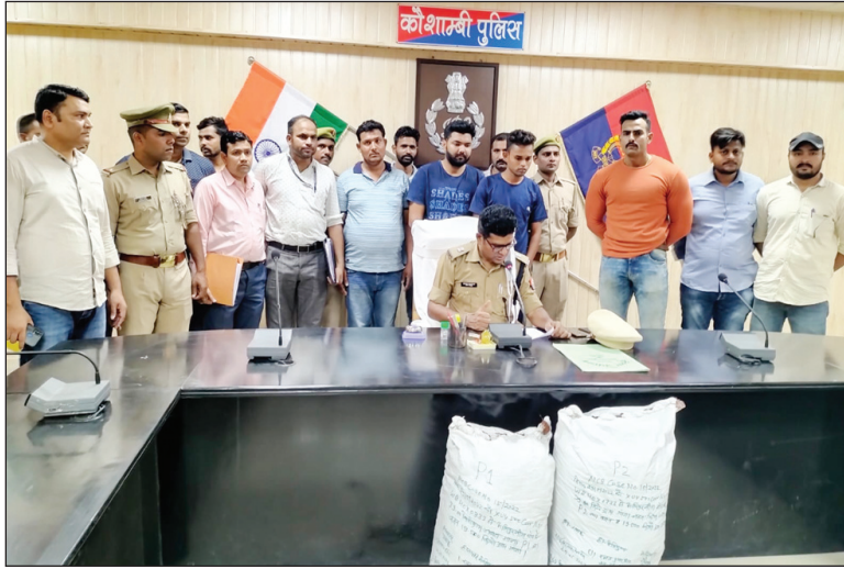
गांजा बरामदगी की जानकारी देते एडिशनल एसपी पीछे खड़े आरोपी गंग