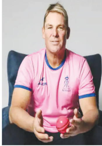
रह गया। 14 साल बाद भी राजस्थान रॉयल्स का खिताब जीतने का वनवास जारी है।

राजस्थान रॉयल्स आईपीएल के पहले सीजन में वॉन की कप्तानी में चैंपियन बनी थी, मगर इसके बाद टीम का परफॉर्मंस कुछ खास नहीं रहा था। आईपीएल 2022 के मेगा ऑक्शन में मैनेजमेंट ने एक धाकड़ टीम तैयार कर ट्रॉफी की उम्मीद जताई थी, मगर फाइनल में मिली हार के बाद यह सपना अधूरा ही