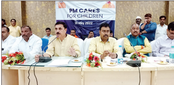
पीएम केयर्स की बैठक में उपस्थित सांसद डीएन वा अन्य

भुगतान पीएम केयर्स द्वारा किया जायेगा व्यक्तिगत जरूरतों के लिए 18 वर्ष की आयु पूरी करने पर मासिक वित्तीय सहायता, 23 वर्ष की आयु पूरी करने पर पीएम केयर्स से 10 लाख रुपए की सहायता, कक्षा 1-12 के बच्चों के लिए 20 हजार रुपए प्रति वर्ष की छात्रवृत्ति, कौशल प्रशिक्षण के लिए कर्मा छात्रवृत्ति तकनीकी शिक्षा के लिए स्वानाय छात्रवृत्ति एवं 50 हजार रुपए की अनुग्रह राशि दी जायेगी सांसद ने