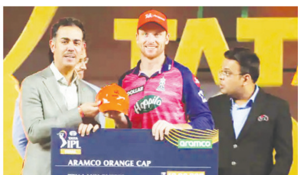
नई दिल्ली। राजस्थान रॉयल्स के बल्लेबाज जोस बटलर ने आईपीएल 2022 में इतिहास

रच दिया। जोस बटलर के बल्ले ने आईपीएल के इस सीजन में जमकर आग उगाली। जोस बटलर 850 से ज्यादा रन बनाने में सफल रहे, लेकिन एक मलाल उनको यह था कि राजस्थान की टीम खिताब नहीं जीत पाई। हालांकि, उन्होंने आईपीएल के एक सीजन में 6 अर्वाइस जीतने का काम किया है, जो किसी भी खिलाड़ी द्वारा एक रिकॉर्ड है।