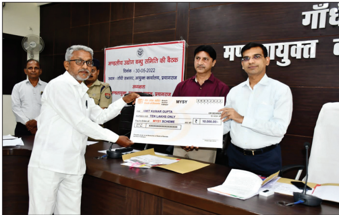
लाभार्थियों को चेक सौंप दे मंडलायुक्त