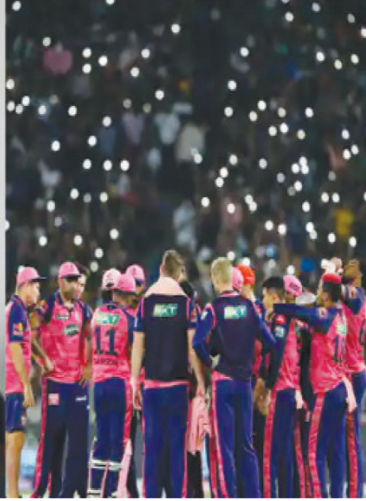
ट्रॉफी जीतकर शेन वॉन को

श्रद्धांजलि देना चाहते थे राजस्थान रॉयल्स के खिलाड़ी