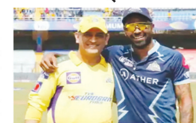
छक्का लगाया, तब भी हार्दिक के चेहरे पर एकस्ट्रा एक्साइटमेंट नहीं दिखा। वह काफी शांत नजर आए, जैसा कि धोनी अपने करियर के दौरान दिखे हैं। नए 'कैप्टन कूल' हैं हार्दिक

नई दिल्ली। Indian Premier League का खिताब जीतना किसी भी कप्तान के लिए बहुत बड़ी बात होती है और कप्तान के तौर पर डेब्यू सीजन में यह कारनामा कर दिखाया, दर्शाता है कि हार्दिक पांड्या कितने अच्छे कप्तान हैं। हार्दिक ने खुद कई बार इस बात को कहा है कि उनके करियर पर महेंद्र सिंह धोनी की छाप है और उन्होंने माही भाई से बहुत कुछ सीखा है। आईपीएल 2022 के दौरान कई मौकों पर देखा गया कि हार्दिक कप्तान के तौर पर कितने कूल रहे हैं। आईपीएल 2022 फाइनल मैच में शुभमन गिल ने जब विनिंग