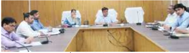
जिला स्वच्छता समिति की बैठक में बोले जिलाधिकारी डा0 नितिन बंसल।

समीक्षा के दौरान पाया गया कि जिला पंचायत राज अधिकारी द्वारा कार्यों में लापरवाही एवं शिथिलता बरती जा रही है जिस पर जिलाधिकारी ने जिला पंचायत राज अधिकारी को कड़ी फटकार