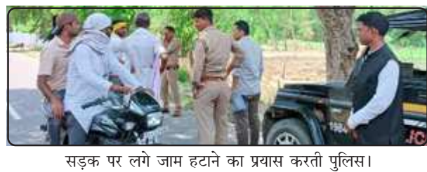
सड़क पर लगे जाम हटाने का प्रयास करती पुलिस।

परियावां, प्रतापगढ़। नवाबगंज थाना क्षेत्र के मददपुर गांव सड़क किनारे कुसुवापुर-सलवन मार्ग पर मंगलवार की सुबह लगभग नौ बजे विक्षिप्त निवस्त्र महिला सड़क पर डंडा लेकर खड़ी हो गई और सड़क से गुजरने वाले वाहनों के सीसे व लाइट को बांस का डंडा लेकर तोड़ने को दौड़ती थी। महिला की इस हकत को देखकर लोगों की आगे जाने की हिम्मत नहीं पड़ती थी। गांव में महिला की हकत से सहमे लोग घरों के दरवाजे बन्द रखते थे किसी की घर से बाहर निकलने की हिम्मत नहीं पड़ती थी। महिला की हकत गांव छोड़कर सड़क पर उतर आने से कुछ घंटों के लिए सलवन मददपुर मार्ग पर वाहनों का जाम लग गया। महिला के इस कारनामे से गांव के लोग परेशान थे जिसकी नवाबगंज पुलिस व लवाना चौकी इंचार्ज से शिकायत किया लेकिन विक्षिप्त