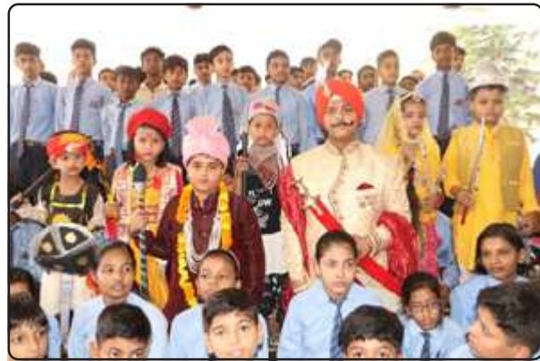
महाराणा प्रताप की वेषभूषा में सजे बच्चे।