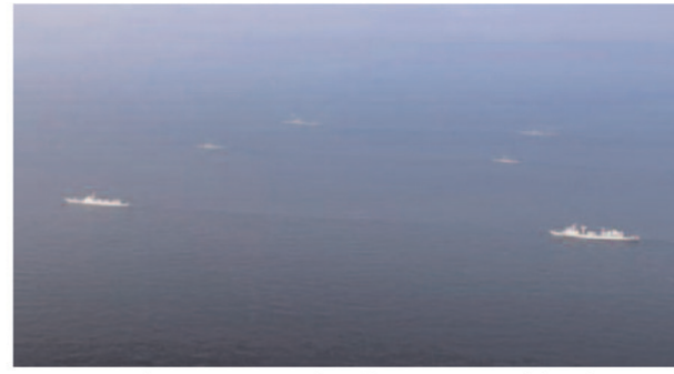
यह पहला आसियान-भारत समुद्री अभ्यास है और इसे भारतीय और