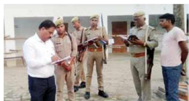
स्टॉग रूम का निरीक्षण करते अधिकारी।

जिले की बहुचर्चित नगर पंचायत सीट कुंडा के मतों की गिनती पांच टेबलों पर एक साथ होगी। इसके लिए प्रत्याशियों को पांच एजेंट के साथ एक रिलीवर यानी छह एजेंट बनाने होंगे। रिलीवर गिनती भी कराएगा और एजेंटों के लिए खाने की पीने की चीजें भी मुहैया कराएगा। इसी तरह से मानिकपुर नगर पंचायत व डेवका के लिए छह टेबल लगाई जाएगी जबकि हीरागंज बाजार