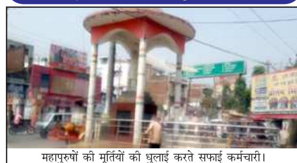
महापुरुषों की मूर्तियों की धुलाई करते सफाई कर्मचारी।

की धुलाई व सफाई की गई। नगर के अम्बेडकर चैराहा, टेंजरी चैराहा, भंगवा चूंगी, स्टेशन रोड, सदर बाजार मोड़ व चिलबिला की मूर्तियों की धुलाई व सफाई की गई है। इसके अलावा सफाई कर्मियों