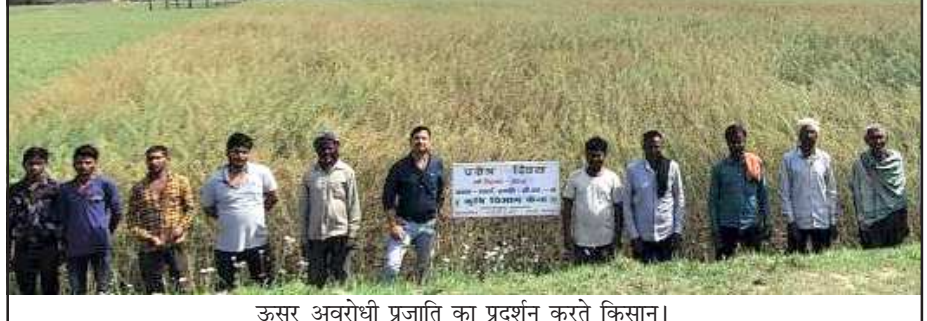
ऊसर अवरोधी प्रजाति का प्रदर्शन करते किसान।

है। सरसों की इस प्रजाति से कृषक अपनी उसरीली भूमि का भी उपयोग कर अपनी आय दुगुना कर सकते हैं। डा0 सिंह ने बताया कि तिलहन उत्पादन में यह प्रजाति अधिक ऊसर क्षेत्र के लिए है जहां की क्षारियता 9.5 तक और खारे पानी से सिंचाई की दशा में भी