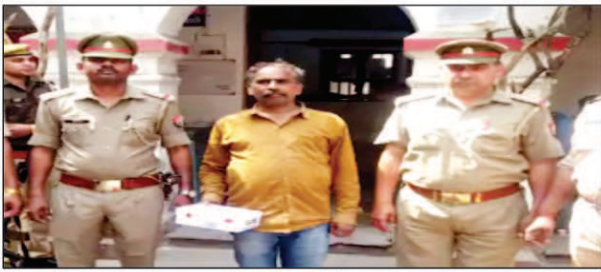
पुलिस के गिरफ्तार में नकली नोटों के साथ आरोपी झाड़वर

घर में ही छापता था नकली नोट पुलिस के मुताबिक, पूछताछ के दौरान जब आरोपी से यह पूछा गया कि उसे नकली नोट कहां से मिले, तो उसने बताया कि वह घर में ही नकली नोट छपाता है। पहले वह साइबर कैफे चलाता था, ऐसे में उसे कंप्यूटर की जानकारी है। बाद में घाटा होने पर उसने साइबर कैफे बंद कर दिया लेकिन इसी दौरान उसे नकली नोट छापने का आइडिया आया। फोटो प्रिंटिंग सोफ्टवेयर के जरिए कुछ नकली नोट छापकर उसने बाजार में चला दिए। इसके बाद से वह लगातार नकली नोट बाजार में खपाने लगा।