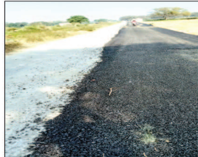
घटिया क्वालिटी की बन रही सड़क का दृश्य