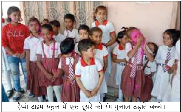
हैप्पी टाइम स्कूल में एक दूसरे को रंग गुलाल उड़ाने बच्चे।

प्रतापगढ़। आज स्कूलों में होली की छुट्टी हो गई। बच्चों के लिये स्कूल में आज होली के पहले का अंतिम दिन था, इसलिये बच्चों ने आज होली के रंग गुलाल के साथ खूब होली खेली। नगर के नया माल गोदाम रोड स्थित हैप्पी टाइम स्कूल में छोटे-छोटे बच्चे अबीर व गुलाल से सराबोर हुए। आपस में तो वह होली खेल ही रहे थे, बच्चों ने अपने शिक्षक-शिक्षिकाओं को भी टीका लगाकर उनका आशीर्वाद प्राप्त किया। सबसे ज्यादा उमंग छोटे बच्चों में देखने को मिली, जो बार-बार रंग लगाने का प्रयास कर रहे थे। पूरा स्कूल प्रांगण रंग व गुलाल से सराबोर हो गया था। रंग और गुलाल लगाने वालों में कक्षा-एक