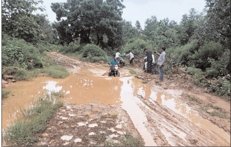
होकर श्रद्धालुओं को जाना पड़ता है। मठदर में पाटा क्षेत्र के कर्वा माफी, सोनेपुर, सिद्धपुर,