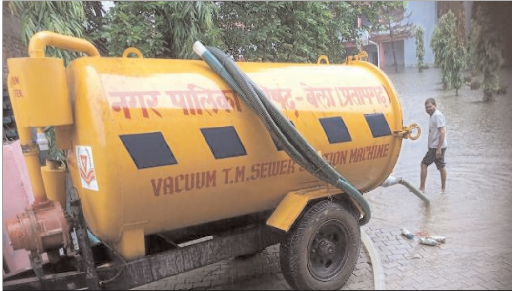
मशीन लगाकर जलभराव का पानी निकालते नगर पालिका कर्मों