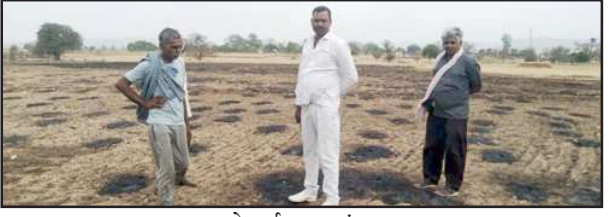
मुआयना करते पूर्व नगर पंचायत अध्यक्ष।