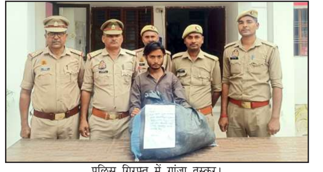
पुलिस गिरफ्त में गांजा तस्करो।