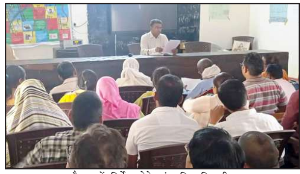
बैठक में निर्देश देते खंड शिक्षाधिकारी।

शुक्रवार को खंड शिक्षा अधिकारी मऊ ने वरिष्ठ सहायक