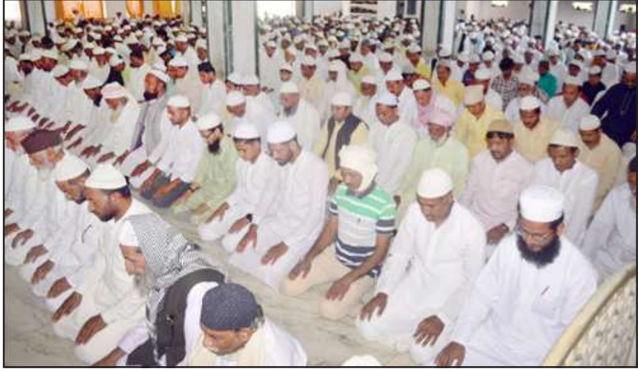
जामा मस्जिद में जुमे की नमाज अदा करते रोजेदार।