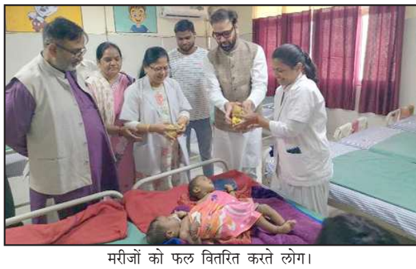
मरीजों को फल वितरित करते लोग।