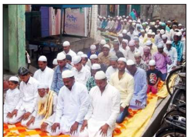
जामा मस्जिद में नमाज पढ़ते नमाजी।