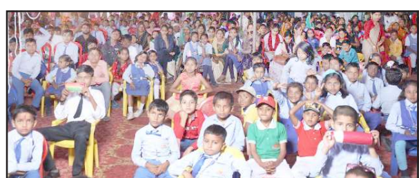
वार्षिकोत्सव में मौजूद छात्र-छात्राएं।