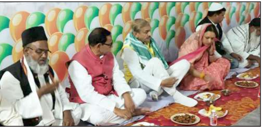
रोजा इफ्तार में शामिल राज्यसभा सदस्य प्रमोद तिवारी व विधायक आराधना मिश्रा।

लालगंज, प्रतापगढ़। सांगीपुर के गांधी इण्टर कालेज के बगल सामुदायिक प्रेक्षागृह में अल्पसंख्यक प्रकोष्ठ द्वारा रोजा इफ्तार कार्यक्रम में भारी तादात में रोजेदार जुटे दिखे। इफ्तार के पहले लोगों ने राज्यसभा में विपक्ष के उपनेता प्रमोद तिवारी तथा कांग्रेस विधानमण्डल दल की नेता एलाकाई विधायक आराधना मिश्रा मोना के साथ मुल्क में तरक्की तथा खुशहाली की दुआ की गयी। कार्यक्रम में वतौर मुख्य अतिथि राज्यसभा में विपक्ष के उपनेता प्रमोद तिवारी ने कहा कि दुनिया में हिन्दुस्तान की खूबसूरती हमारी कौमी