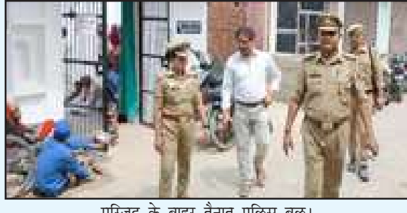
मस्जिद के बाहर तैनात पुलिस बल।