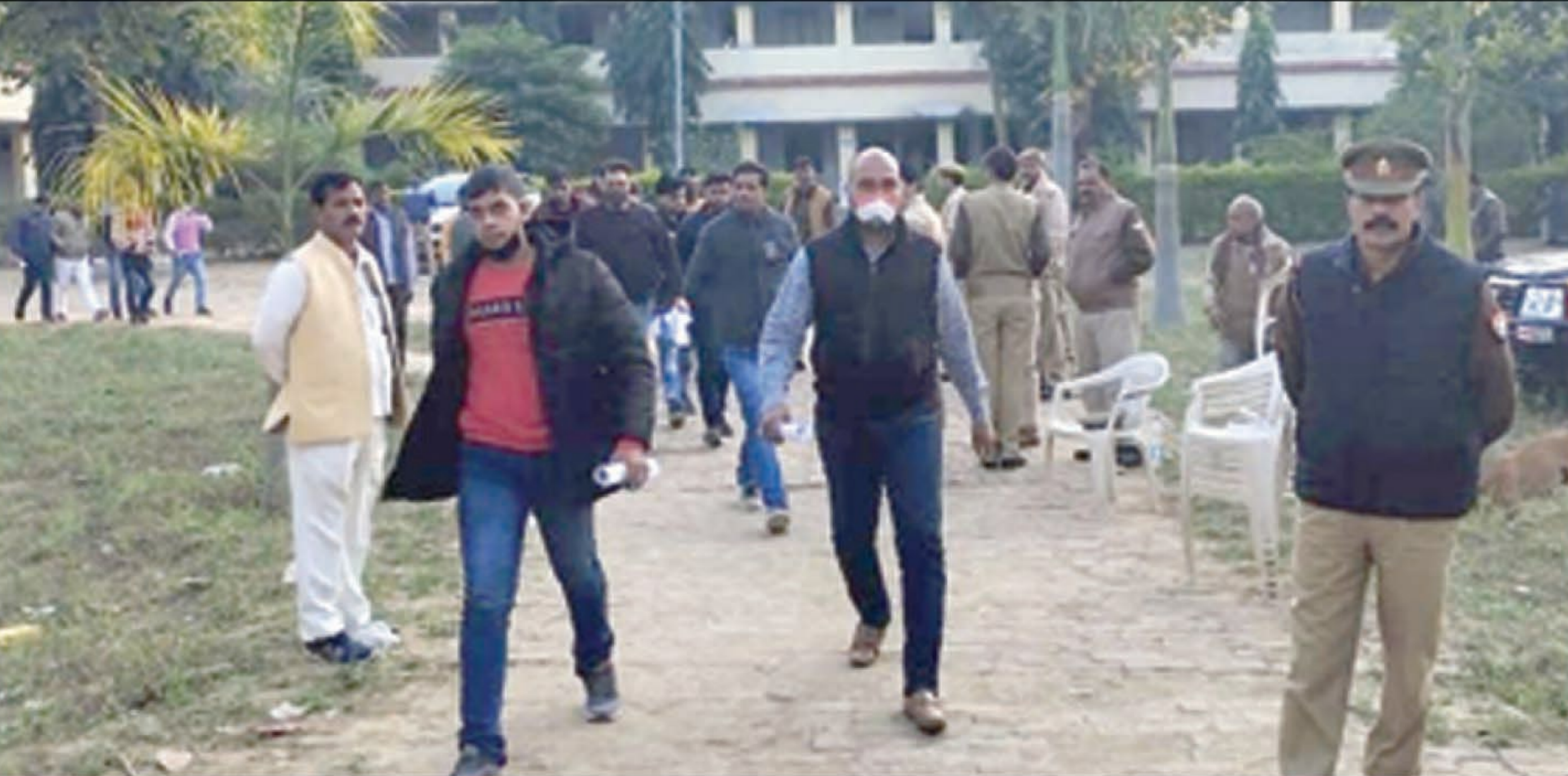
पुलिस भर्ती परीक्षा में परीक्षा देकर वापस केन्द्र से बाहर निकलते अभ्यर्थी