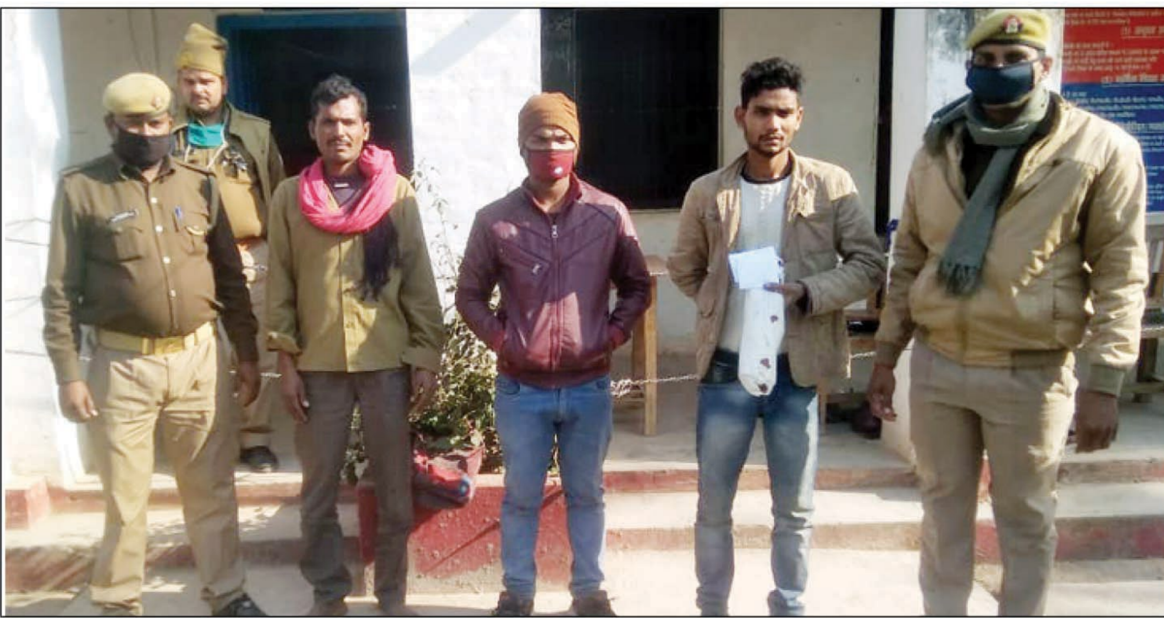
पुलिस की गिरफ्त में चोर

कोरांव। वरिष्ठ अधिकारियों के निर्देश पर चोरी लूट हत्या जैसी घटनाओं के रोकथाम के लिए पुलिस द्वारा अभियान चलाकर कार्यवाही की जा रही है। इसी शनिवार को कोरांव पुलिस ने तीन चोर को गिरफ्तार करते हुए जेल भेज दिया जिनके पास से दस हजार रुपया भी मिला।