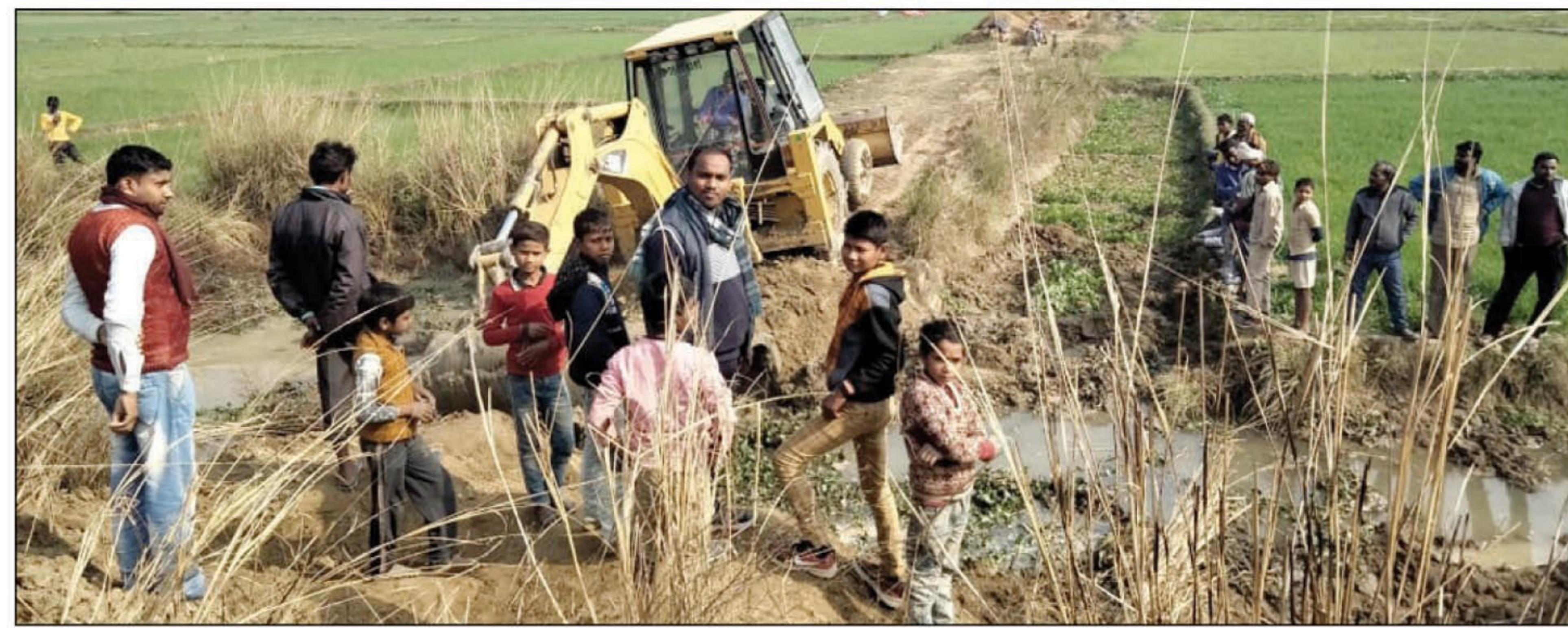
बाधित सड़क पर रास्ता बनाता जेसीबी

उतरांव। थाना क्षेत्र के सराय हुसे गांव में लगभग 50 वर्ष से एक चक मार्ग पुलिया के कारण बाधित था। जिस पर किसी भी नेताओं व जिम्मेदारों का ध्यान नहीं जा रहा था। मार्ग बाधित हो जाने से ग्रामीणों को काफी लंबा सफर तय करना पड़ता था। वही सराय हुसे गांव निवासी जिला पंचायत सदस्य प्रत्याशी