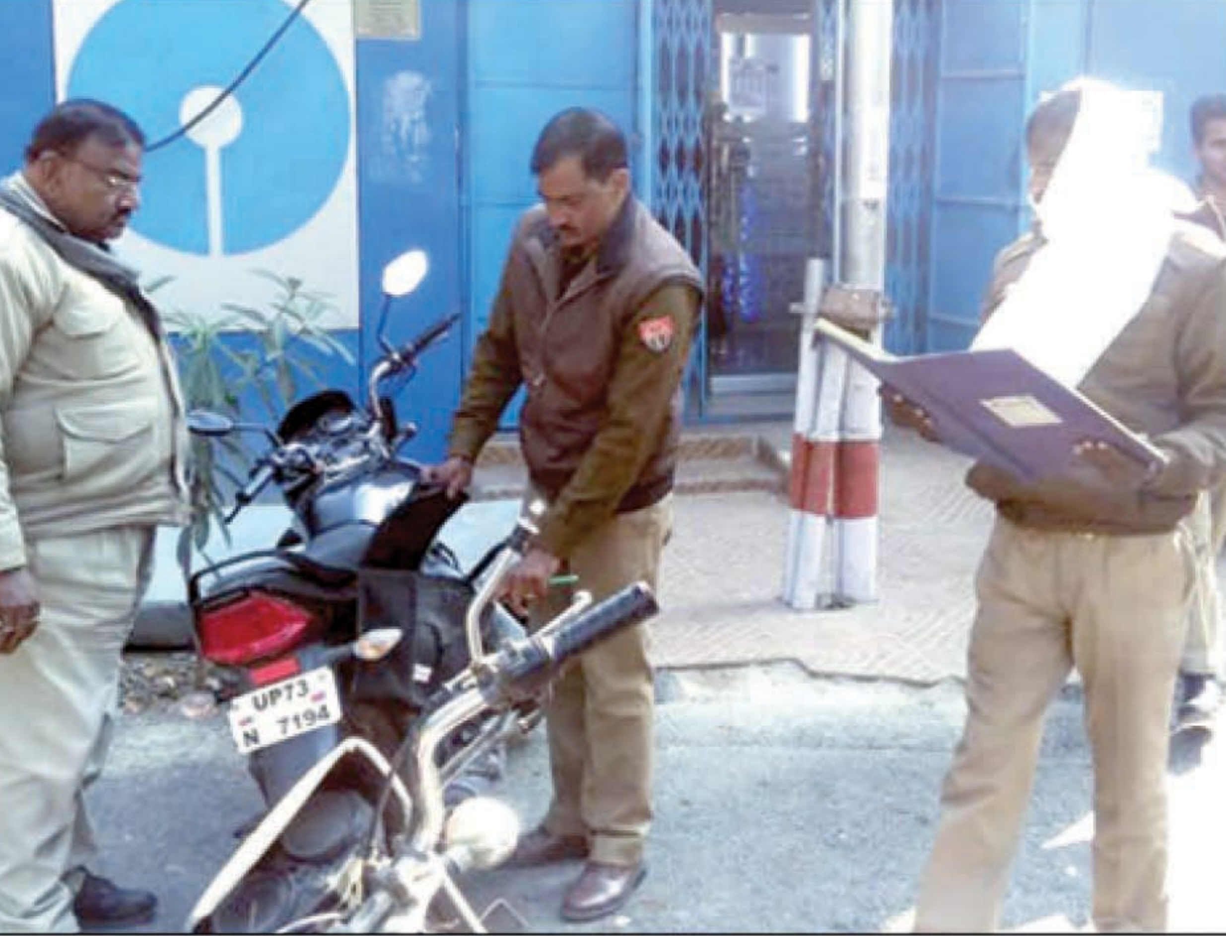
बैंकों की चेकिंग करते पुलिस चौकी इंचार्ज अड्डवा

गयी परीक्षा को सफुल सम्पन्न करने के लिए सभी परीक्षा केंद्रों पर पुलिस तैनात रही। गौरतलब है कि पुलिस भर्ती के लिए चायल तहसील इलाके में परीक्षा केंद्र बनाया गया था। दो पालियों में आयोजित होने वाली यह परीक्षा रसुलाबाद कोइलहा के मधु वाचस्पति कालेज और तिलहापुर मोड़ के कौशाम्बी