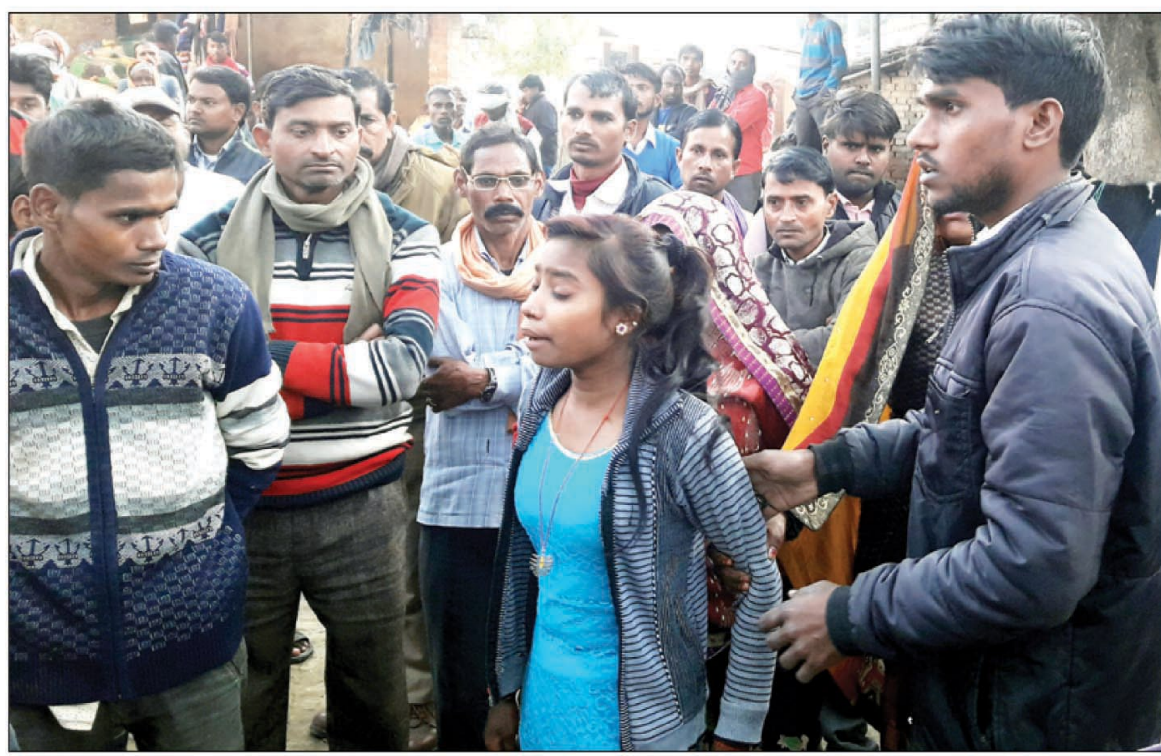
रोती बिलखती मृतका की पुत्री व जुटी भीड़