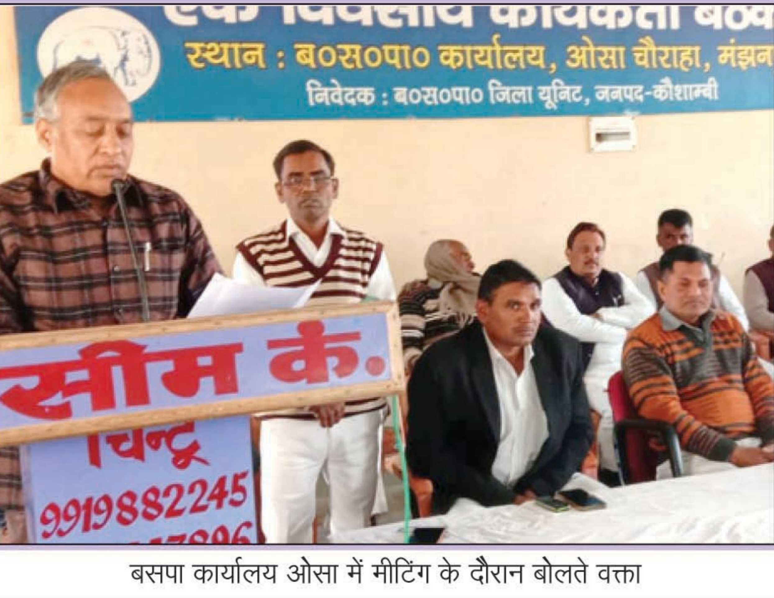
बसपा कार्यालय ओसा में मीटिंग के दौरान बोलते वक्ता