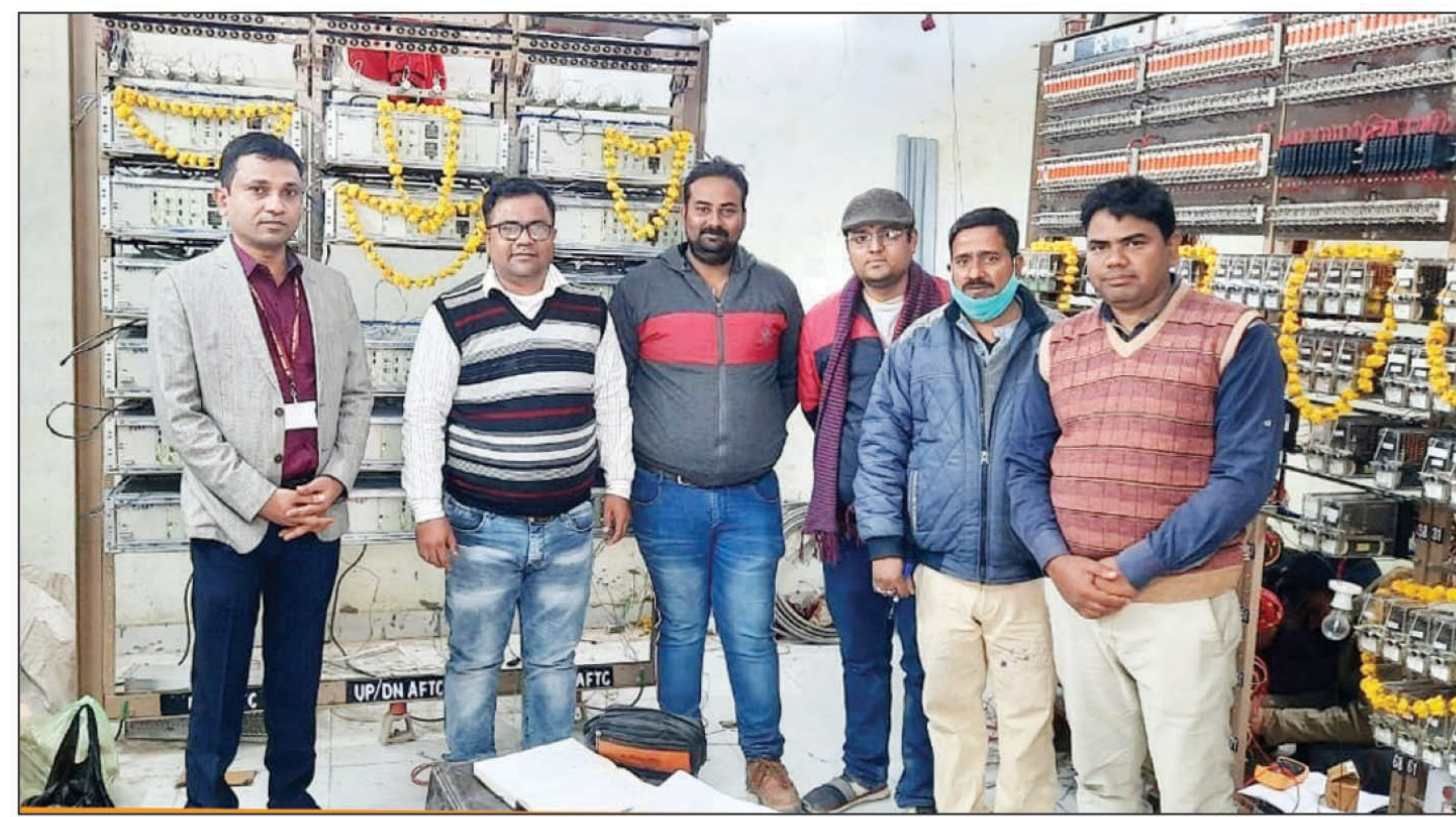
स्वचालित सिग्नलिंग सिस्टम

वरिष्ठ मंडल इंजीनियर-कक्र प्रयागराज, प्रयागराज एवं कानपुर के वरिष्ठ मंडल संकेत एवं दूरसंचार इंजीनियरों के मार्गदर्शन में संयुक्त