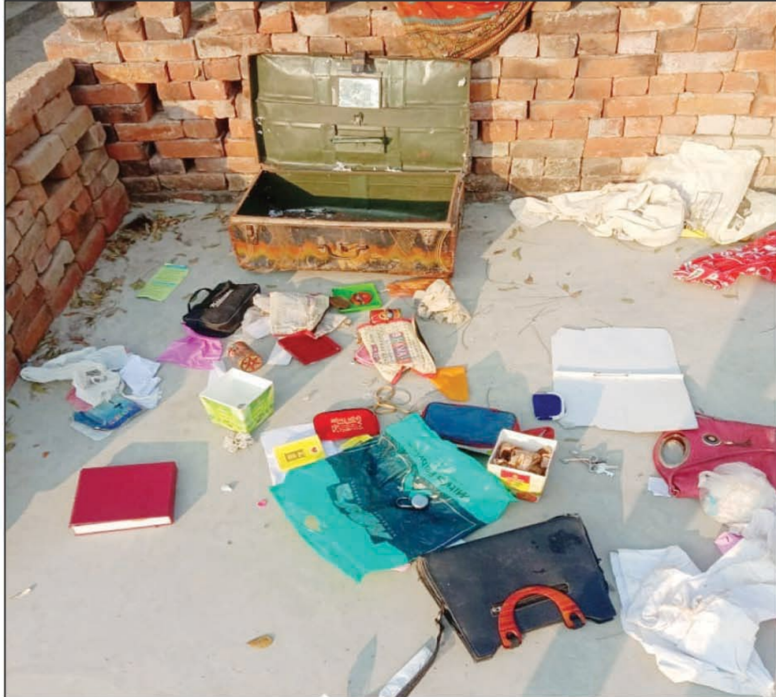
चोरी के बाद बिखरा सामान

मऊआइमा। शीत लहर का प्रकोप बढ़ते ही पुलिस गश्त लगाना बंद कर दी है तो चोरों के हाँसले चुलंद हो गए हैं। बीती रात चोरों ने दो घरों में कूद कर कमरों में प्रवेश कर गए। तथा घरों में रखे बक्सों का ताला तोड़कर लाखों की चोरी कर ले गए। सूचना पर पहुंची पुलिस जांच कर अज्ञात चोरों के खिलाफ मुकदमा दर्ज कर लिया है। इस चोरी की घटना से दोनों घरों में कोहराम मचा हुआ है।