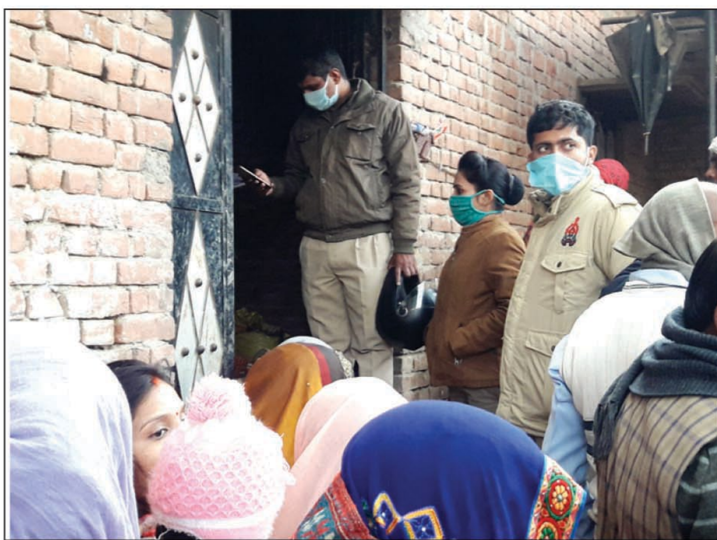
महिला की हत्या की जांच पड़ताल करती पुलिस