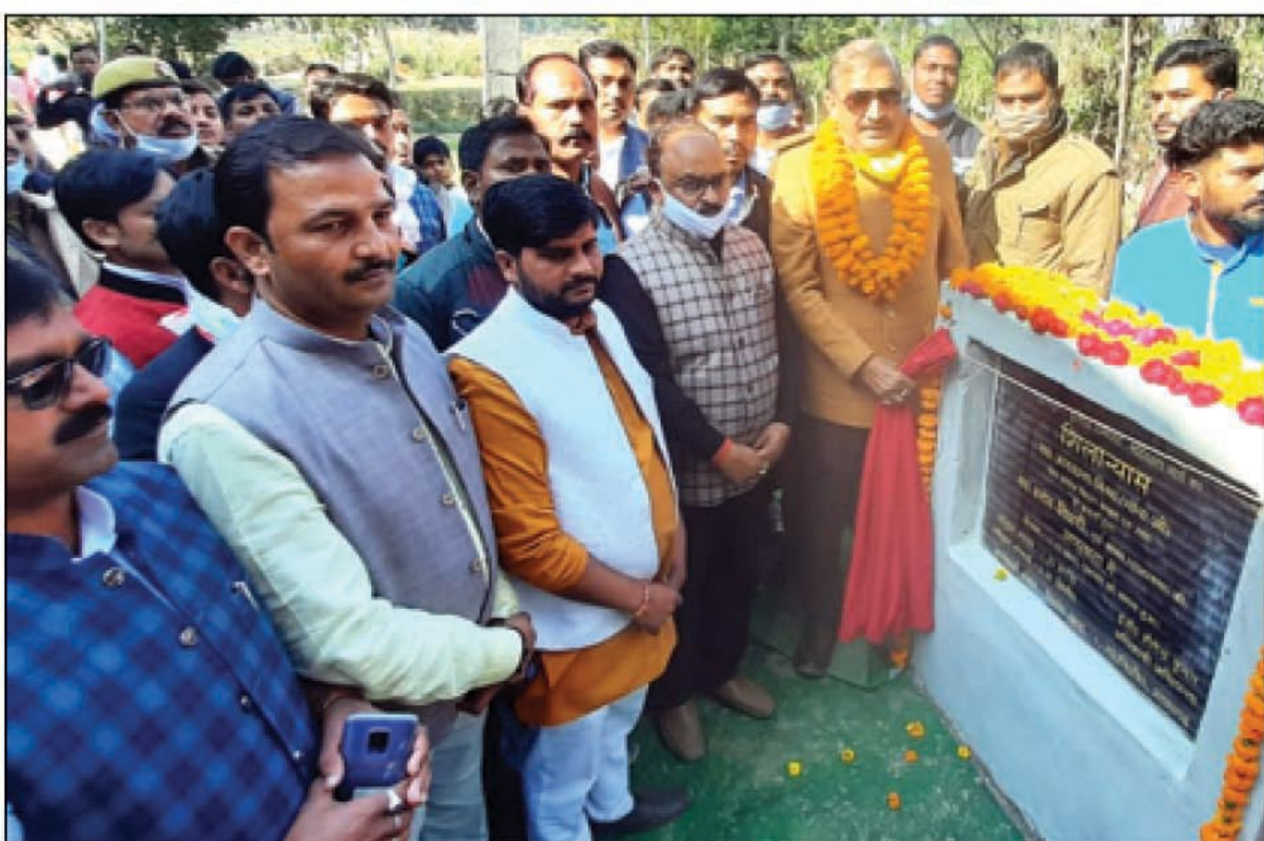
पिच मार्ग का भूमिपूजन करते सीडब्ल्यूसी मेंबर प्रमोद तिवारी

लालगंज, प्रतापगढ़। स्थानीय विकासखण्ड के मधुकरपुर मे गुरुवार को पूर्व राज्यसभा सदस्य व कांग्रेस वर्किंग कमेटी के सदस्य प्रमोद तिवारी ने सवा करोड़ की लागत से बनने वाली पिच रोड का भूमिपूजन किया। मधुकरपुर गांव मे भूमिपूजन के बाद जनसभा मे श्री तिवारी ने भारी भीड़ को संबोधित किया। लाव लश्कर के साथ यहां पहुंचे सीडब्ल्यूसी मेंबर व आउटरीच कमेटी के प्रदेश प्रभारी प्रमोद तिवारी ने मधुकरपुर-मटियारा वाया डुहिया पिच मार्ग का भूमिपूजन करने के बाद जनसभा में लोगों को संबोधित करते हुए कहा कि क्षेत्रीय विधायक आराधना मिश्रा मोना के प्रयास से एक करोड़ तैतीस लाख रुपए की लागत से बनने वाली दो किलोमीटर लंबे मार्ग से जनता के लिए फायदा होगा। इसके बन जाने से क्षेत्र के रामघाट, कौशिल्यपुर, पंचारा, पूरे नीमी, गड़हा, अगई, तेलियार का पुरवा