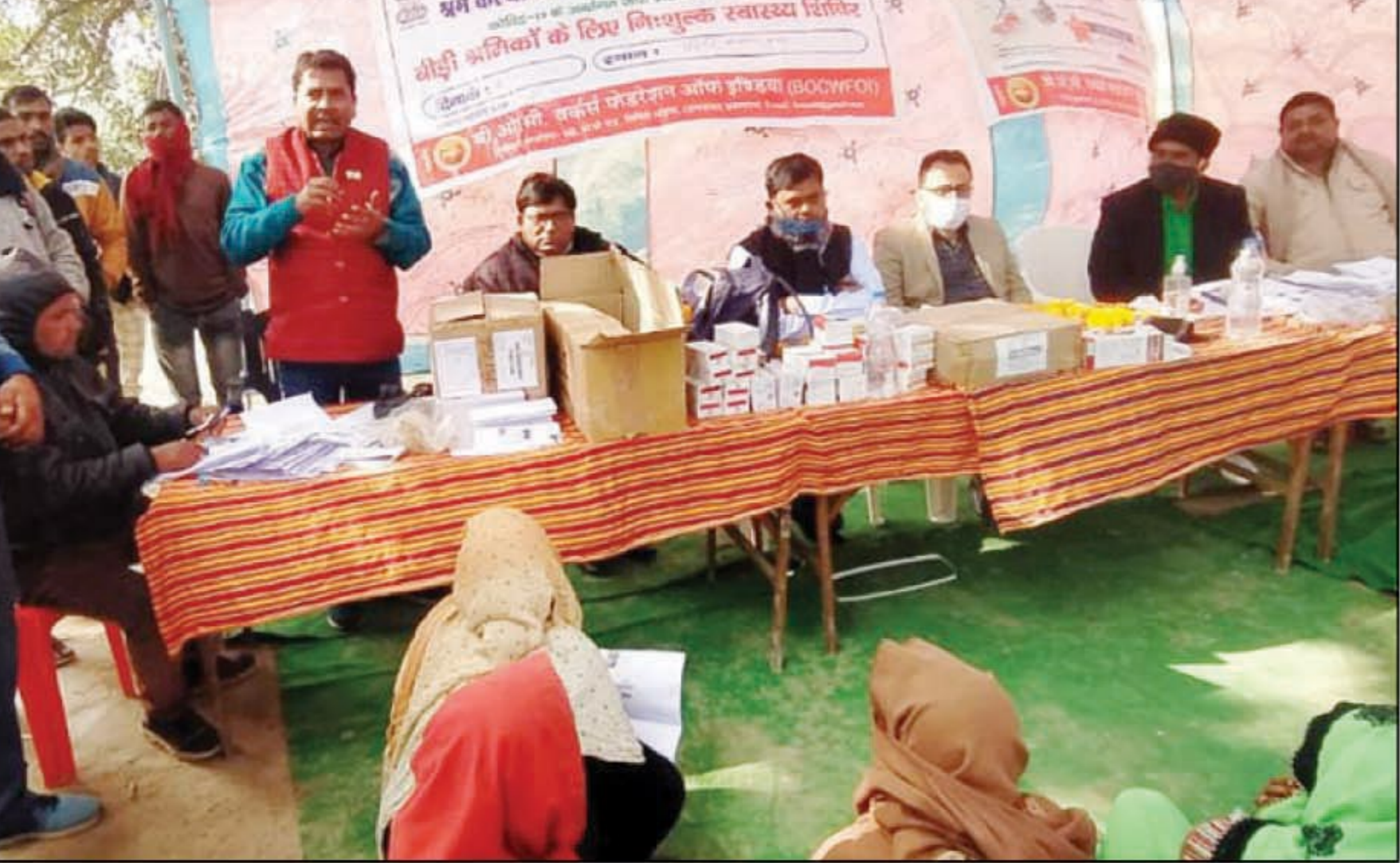
श्रमिकों को जागरूक करते कल्याण आयुक्त

प्रयागराज। श्रम कल्याण संगठन, श्रम एवं रोजगार मंत्रालय भारत सरकार इलाहाबाद परिक्षेत्र एवं बौ० ओ० सी० वरकर फेडरेशन ऑफ इंडिया द्वारा असंगठित कामगारों व बीड़ी श्रमिकों के मध्य pm-sym के प्रति जागरूकता कार्यक्रम व निशुल्क