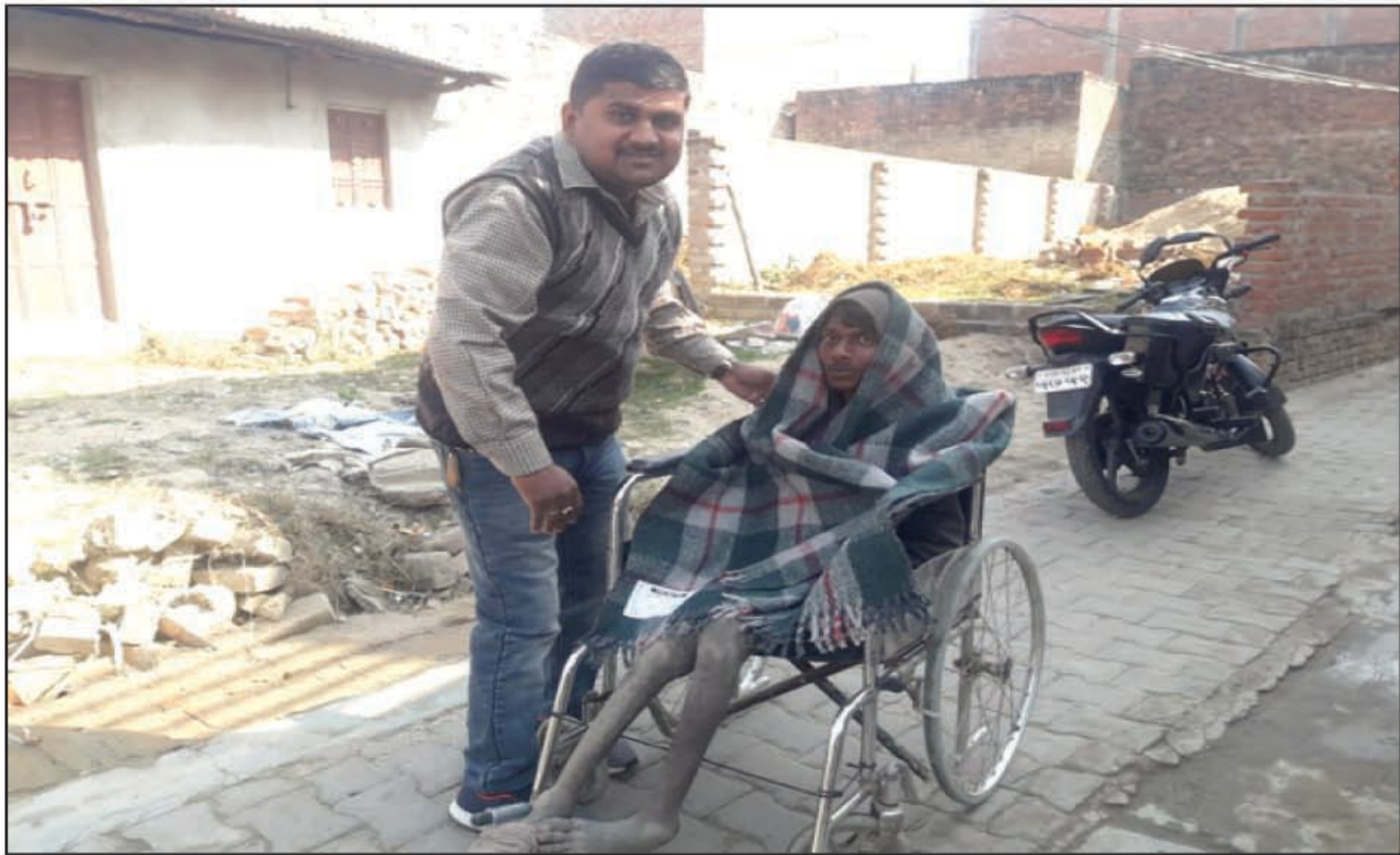
विकलांग को कंबल वितरित करते

कोखराज कौशाम्बी। सिराथू विकासखंड क्षेत्र के ग्राम पंचायत ककोड़ा में ग्राम प्रधान द्वारा गांव के गरीब असहाय विधवा और विकलांग लोगों को कंबल वितरण किया गया है बड़ती ठंड के चलते गरीबों के पास ठंड से बचाव के लिए कंबल नहीं थे जिस पर लोगों ने ग्राम प्रधान से सहयोग करने की अपील की ग्रामीणों