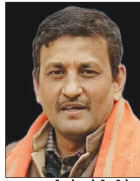
प्रधानमंत्री नरेंद्र मोदी जी के जनसभा के मीडिया प्रभारी राजेश केसरवानी होंगे

प्रयागराज। प्रधानमंत्री नरेंद्र मोदी की 21 मई को परेड मैदान में होने वाली रैली को सफल बनाने के लिए भाजपा ने ताकत झोंक दी है। सिविल लाइन स्थित महानगर कार्यालय में रविवार को हुई बैठक में 10 लाख की भीड़ पीएम की रैली में जुटाने का लक्ष्य रखा गया। रैली के संयोजक दिग्विजय सिंह होंगे। सह संयोजक क्षेत्रीय महामंत्री सुशील त्रिपाठी को बनाया गया है। रैली को सफल बनाने के लिए विधानसभा स्तर पर 200 बसें, 200 निजी साधन की व्यवस्था की जाएगी 1000 बाइक सवार युवा मोर्चा के कार्यकर्ता जनसभा स्थल परेड ग्राउंड पहुंचेंगे। रैली में मुख्यमंत्री योगी आदित्यनाथ, उप मुख्यमंत्री केशव प्रसाद मौर्य के साथ कई कैबिनेट मंत्री शामिल होंगे। इस बैठक में कैबिनेट मंत्री सुरेश खन्ना ने कार्यकाताओं रैली को सफल बनाने की अपील की। संचालन इलाहाबाद संसदीय लोकसभा के प्रभारी मनोज जायसवाल ने किया।