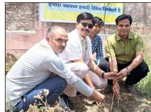
पौधारोपण करते आरोग्य भारती के पदाधिकारी।