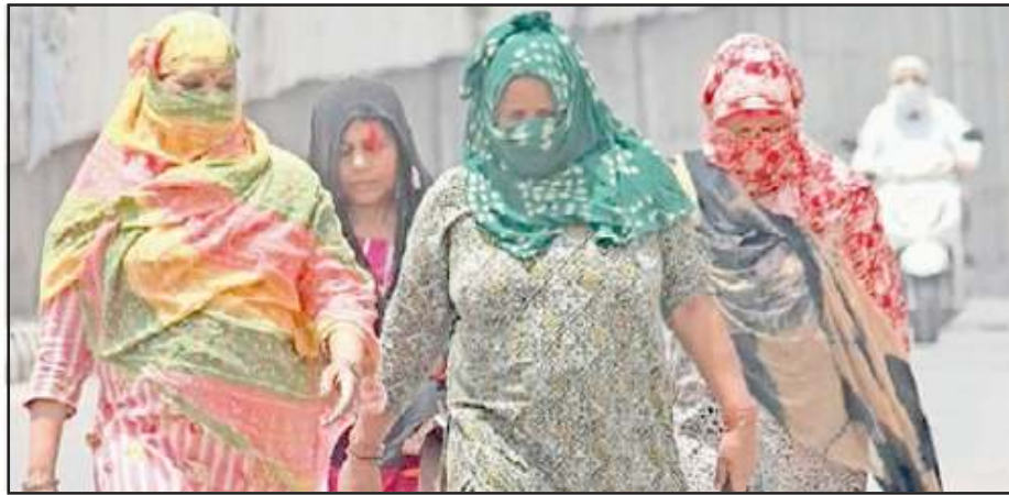
गर्मी से मुंह ढककर चलती महिलाएं।

प्रतापगढ़ में आज अधिकतम तापमान 45.5 डिग्री एवं न्यूनतम तापमान 30 डिग्री से अधिक रिकार्ड किया गया। गर्मी से बेहाल लोगों को बिजली कटौती झेलनी पड़ रही है। नया माल गोदाम रोड पर बुधवार की