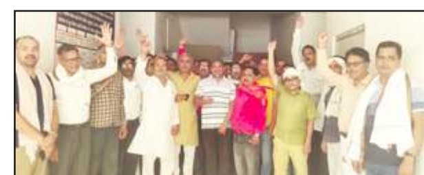
डीआईओएस कार्यालय पर प्रदर्शन करते राष्ट्रीय शैक्षिक महासंघ के पदाधिकारी।

जिलाध्यक्ष ने कहा कि जनपद में वे तदर्थ शिक्षक जिनकी सेवायें शासनादेश के द्वारा बाधित हैं, का नियमित वेतन भुगतान किया जाय तथा उनके पदों के साथ कोई छेड़छाड़ न किया जाय। शिक्षक एवं उनका परिवार वेतन न पाने से भुखमरी से कगार पर हैं। उच्च न्यायालय द्वारा पारित आदेश एवं