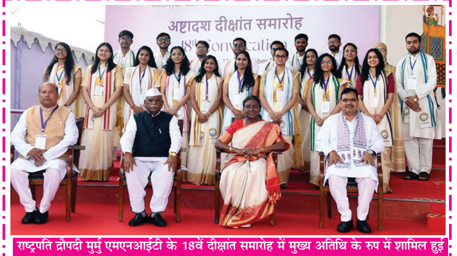
राष्ट्रपति द्रौपदी मुर्मू एमएनआईटी के 18वें दीक्षांत समारोह में मुख्य अतिथि के रूप में शामिल हुईं

संवाददाताओं से कहा, यह अच्छी बात है कि लोग सुबह से ही वोट देने के लिए अपने घरों से बाहर निकल रहे हैं। नेका उपाध्यक्ष ने एक सवाल का जवाब देते हुए कहा, इस दिन का लोग पिछले 10 साल से इंतजार कर रहे थे। हम समझ नहीं पा रहे हैं कि लोगों को उनके लोकतांत्रिक अधिकार से क्यों दूर रखा गया।