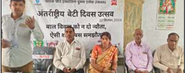
अन्तर्राष्ट्रीय बालिका दिवस पर आयोजित कार्यक्रम में बोलते अतिथि।