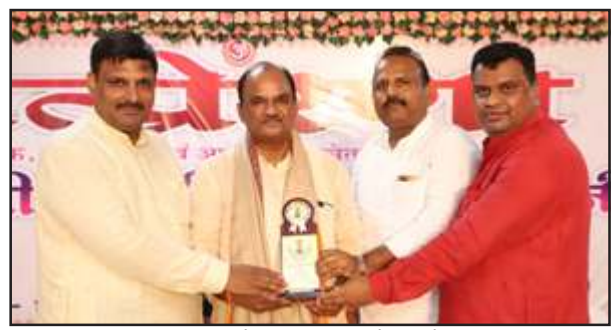
सदर विधायक को सम्मानित करते आयोजकगण।