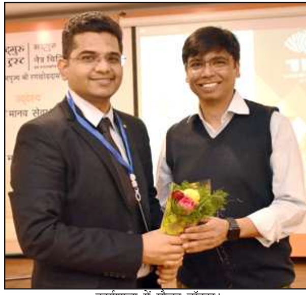
कार्यशाला में मौजूद डॉक्टर।

सोमवार को कार्यशाला आंख के अंदरूनी हिस्से में सूजन की बीमारी विषयक में नेत्र चिकित्सा के क्षेत्र से जुड़े विभिन्न विशेषज्ञों ने अनुभव, नवीन शोध, नवाचार पर चर्चा की। नेत्र रोगियों को चिकित्सा देकर देश से अंधत्व निवारण को गति दी। शुभारम्भ