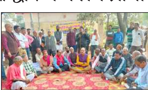
सड़क के पुनरोद्धार के लिये सत्याग्रह पर बैठे ग्रामीण।