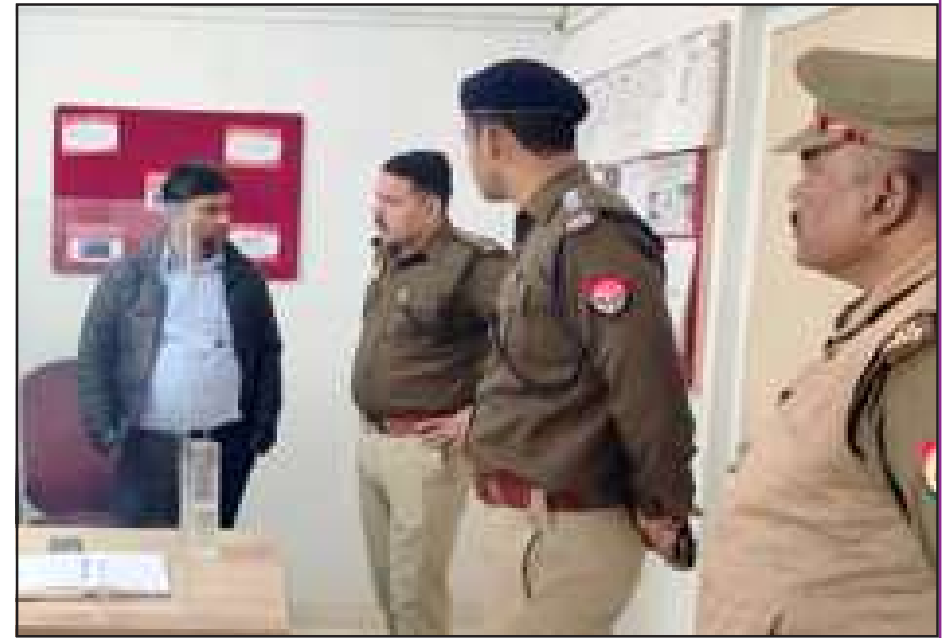
शाखा प्रबंधक से बात करते एएसपी।