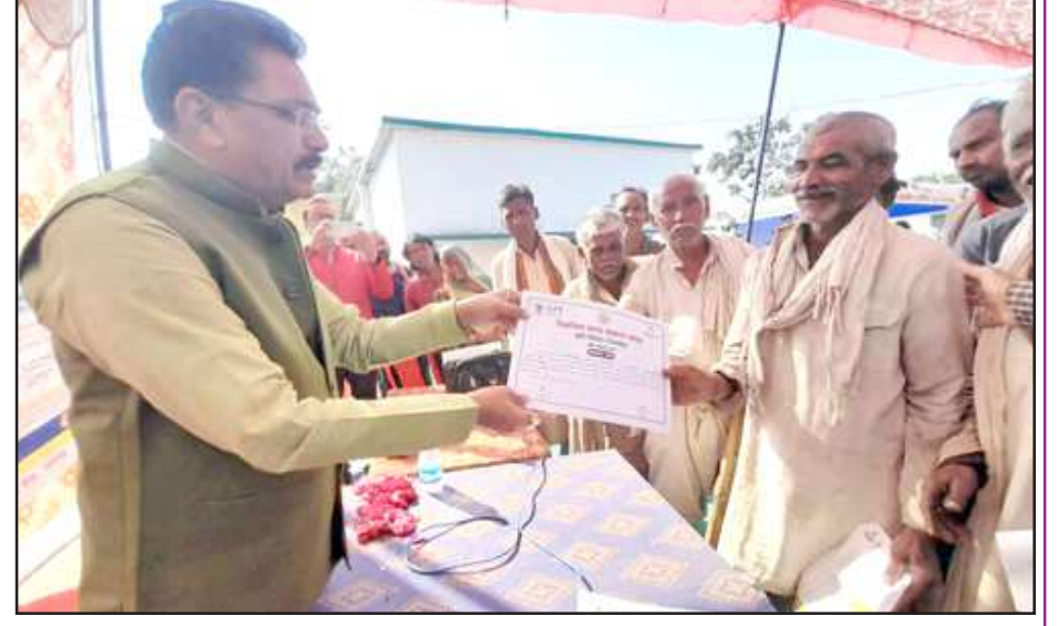
ग्रामीणों को प्रशस्ति पत्र देते चेयरमैन।