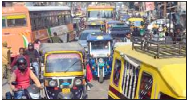
चौक घंटाघर पर लगा वाहनों का लम्बा जाम।

शहर में प्रयागराज-अयोध्या राजमार्ग पर शहर का चौक घंटाघर स्थित है। इस मार्ग के दोनों तरफ टेलेवालों व पटरियों पर बढ़ी दुकानों के कारण पटरियों पर चलना मुश्किल होता ही है और बीच सड़क पर वेतरतीब ढंग से चलने वाले टेम्पो व ई रिक्शा इस कदर जाम लगाते हैं कि स्कूटर व मोटरसाइकिल का आगे निकलना