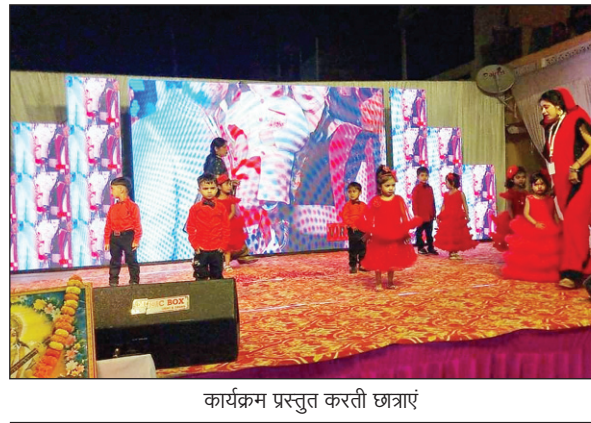
कार्यक्रम प्रस्तुत करती छात्राएं