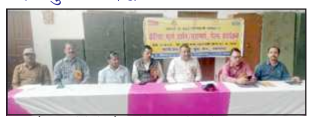
कैरियल मेले में मौजूद नेहरू युवा केन्द्र के पदाधिकारी।

संचालित की जा रही हैं जिससे युवा स्वरोजगार अपनाकर आत्मनिर्भरता की ओर बढ़ रहे हैं उन्होंने युवाओं का आवाहन किया कि वह अपनी रूचि के अनुसार विभिन्न शासकीय विभागों द्वारा संचालित स्वतः रोजगार से संबंधित योजनाओं का प्रशिक्षण