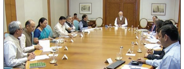
अनुसार, भारत में कोरोना वायरस के 1,134 नये मामले दर्ज किये गये हैं, वहीं उपचाराधीन मरीजों की संख्या बढ़कर 7,026 पहुंच गई। वहीं, ताजा जारी आंकड़ों के अनुसार, संक्रमण से पांच लोगों की

नई दिल्ली: देश में कोविड-19 के मामलों में एक बार फिर बढ़ोतरी देखी जा रही है। संक्रमण की बढ़ती स्थिति को देखते हुए पीएम मोदी ने बुधवार को एक उच्च स्तरीय समीक्षा बैठक की अध्यक्षता की। बैठक के दौरान प्रधानमंत्री ने सार्वजनिक स्वास्थ्य तैयारियों का जायजा लिया। बीते दिनों के दौरान देश में कोरोना वायरस संक्रमण के 1,134 नए मामले दर्ज किए गए। एक हजार से ज्यादा नए मामले: केंद्रीय स्वास्थ्य मंत्रालय के बुधवार को जारी ताजा आंकड़ों के