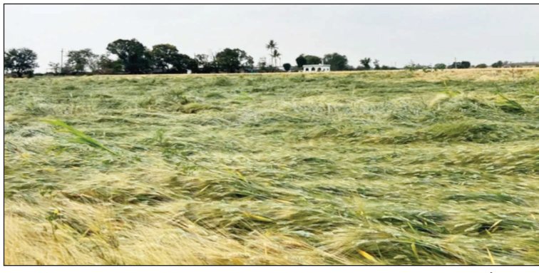
किसानों को जल्दी मदद देने की कोशिश तेज: राज्यों से कहा गया है कि किसानों को शीघ्र मदद देने के लिए राज्य सरकारें राज्य आपदा

नई दिल्ली: पिछले चार दिनों से असमय वर्षा और आंधी से रबी फसलों की व्यापक क्षति हुई है। सबसे ज्यादा असर गेहूँ की खड़ी फसलों पर पड़ा है। प्रारंभिक आकलन के अनुसार गेहूँ एवं सरसों के अतिरिक्त अन्य फसलों को अभी तक अधिक नुकसान नहीं हुआ है। कई राज्यों से गेहूँ की खड़ी फसलों की क्षति की सूचनाएं आ रही हैं। केंद्र ने राज्य सरकार को दिया निर्देश: केंद्र सरकार ने राज्यों को नुकसान का आकलन कराने का निर्देश दिया है, ताकि किसानों को सहायता पहुंचाई जा सके। कृषि मंत्रालय के मुताबिक, आंधी-वर्षा से प्रभावित राज्य सरकारें अपने स्तर से फसलों के नुकसान का आकलन कर रही हैं। केंद्र को अभी किसी राज्य की तरफ से रिपोर्ट नहीं मिली है।