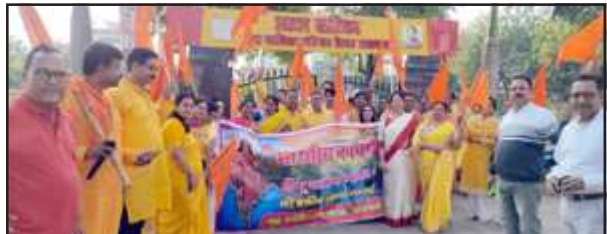
गुड मार्निंग क्लब द्वारा शहर में निकाली गई प्रभात फेरी।