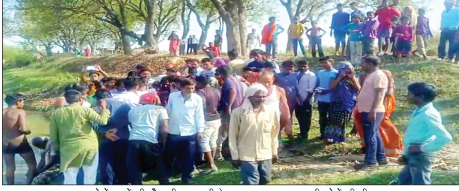
दोनों बच्चों की मौत की जानकारी के बाद घटनास्थल पर लगी लोगों की भीड़

कौशाम्बी। जिले के मंझनपुर थाना क्षेत्र में तालाब में डूबने से दो बच्चों की मौत हो गई, तालाब में नहाने के दौरान दर्दनाक हादसा हो गया, दोनों को डूबता देख बाहर खड़े एक बच्चे ने शोर मचाकर लोगों को जानकारी दी, तो ग्रामीणों ने बच्चों को तालाब से निकाला और अस्पताल ले गए जहां चिकित्सकों ने दोनों को मृत घोषित कर दिया। बच्ची की मौत से परिजनों में कोहराम मच गया। घटना की सूचना पर पहुंची पुलिस ने दोनों बच्चों के शव को कब्जे में लेकर पोस्टमार्टम के लिए भेज दिया और जांच में जुट गई। घटना क्रम के मुताबिक मंझनपुर थाना क्षेत्र के भक्तन का