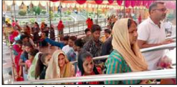
बेलहा देवी मंदिर में दर्शन को लगी श्रद्धालुओं की भीड़।

महूर्त में कलशा स्थापना की। घरों तथा मंदिरों में दुर्गा सप्तसती पाठ का भी आयोजन हुआ दिखा। नगर के हरिहरमंदिर में श्रद्धालुओं ने मां दुर्गा व मां