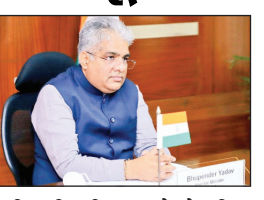
ब्लू प्रिंट विकसित करने के लिए समुद्र स्थानिक योजना (एमएसपी) के साथ आगे बढ़ रही है। मंत्री ने एनसीएससीएम को तटीय समुदायों की टोस आय पर ध्यान देने के साथ मैंग्रोव संरक्षण के लिए मिशन मिट्टी (मैंग्रोव इनसेटिव फॉर शोरलाइन हेबिटेट्स एंड टेंजबल इनकम) में योगदान देने का भी निर्देश दिया।

नई दिल्ली: केंद्रीय पर्यावरण, वन तथा जलवायु परिवर्तन मंत्री भूपेन्द्र यादव ने बुधवार को पर्यावरण वन तथा जलवायु परिवर्तन मंत्रालय के संस्थान नेशनल सेंटर फॉर सस्टेनेबल कोस्टल मैनेजमेंट (एनसीएससीएम) की पहली जनरल बॉडी बैठक की अध्यक्षता की। इस मौके पर उन्होंने कहा कि प्रधानमंत्री नरेन्द्र मोदी तृतीय समुदायों की आजीविका पर फोकस के साथ नीली अर्थव्यवस्था को काफी अधिक महत्व देते हैं। यादव ने कहा कि सरकार बहु-प्रबंधन उद्देश्यों के साथ क्षेत्र आधारित प्रबंधन के लिए