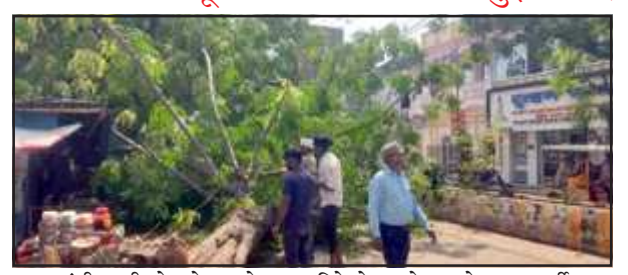
आंधी पानी से स्टेशन रोड पर गिरे पेड़ को हटाते नपा कर्मी।

कम्पनी गार्डन सहित लगभग दस पेड़ तो शहर में ही गिर गये थे। इसी तरह की सूचना ग्रामीण क्षेत्रों से भी मिली है। शहर में जिला प्रशासन के निर्देश पर नगर पालिका के कर्मचारी देर रात तक पेड़ काटते रहे लेकिन स्टेशन रोड, कम्पनी