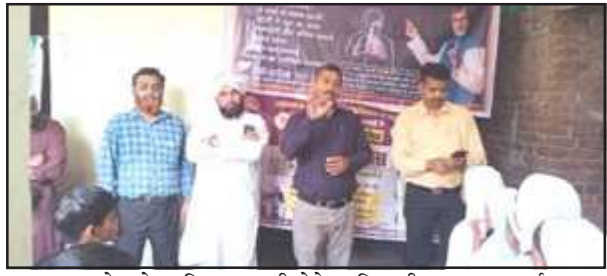
क्षय रोग के प्रति जानकारी देते अधिकारी व प्रधानाचार्य।

इस दौरान जानकारी देते हुए सरकार द्वारा प्रदत्त टीबी के मरीजों को निःशुल्क जांच एवं उपचार की व्यवस्था जनपद के सभी सामुदायिक स्वास्थ्य केन्द्र एवं