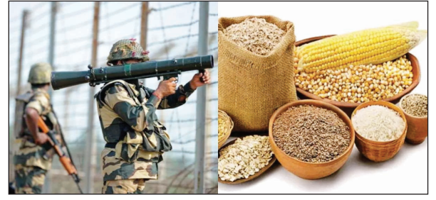
थी। संयुक्त राष्ट्र ने साल 2023 को अंतरराष्ट्रीय मोटा अनाज वर्ष घोषित किया है, इसीलिए अब भारतीय सेना ने भी मोटे अनाज की खपत को बढ़ावा देने का फैसला लिया है। सेना में सभी रैंकों को दिये जाने वाले आहार में मोटे अनाज से तैयार किये गए आटे को शामिल किया गया है।

नई दिल्ली: अब सेना में सभी रैंकों के लिए मोटा अनाज दैनिक भोजन का एक अभिन्न हिस्सा होगा। भारतीय सेना ने मोटे अनाज की खपत को बढ़ावा देने के उद्देश्य से सैनिकों के राशन में बाजरा, ज्वार और रागी का आटा शामिल किया है। सैनिकों को पांच दशक बाद देशी और पारंपरिक अनाज की आपूर्ति किए जाने का फैसला लिया गया है, क्योंकि इससे पहले गेहूँ के आटे को बढ़ावा देने के लिए इस तरह के अनाजों की आपूर्ति बंद कर दी गई