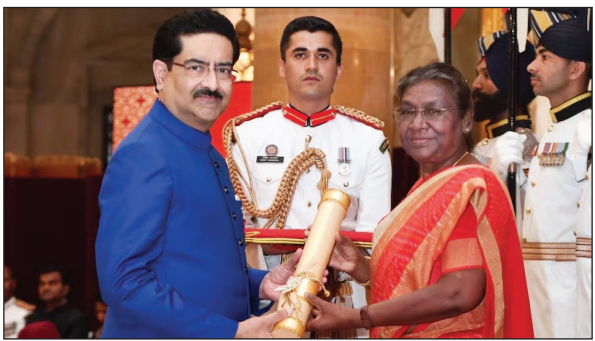
गतिविधियों के क्षेत्रों में पुरस्कार दिए जा रहे हैं। इस वर्ष, राष्ट्रपति ने 106 पद्म पुरस्कार प्रदान करने की मंजूरी दी,

नई दिल्ली: बुधवार को राष्ट्रपति भवन में पद्म पुरस्कारों का वितरण किया गया। कार्यक्रम के दौरान राष्ट्रपति द्रौपदी मुर्मू ने सभी गणमान्य लोगों को पद्म पुरस्कारों से नवाजा। हर साल की तरह इस साल भी गणतंत्र दिवस 2023 के मौके पर पुरस्कारों की घोषणा हो चुकी है, लेकिन पुरस्कार समारोह का आयोजन बुधवार को राष्ट्रपति भवन में किया जा रहा है। राष्ट्रपति ने तीन श्रेणियों - पद्म विभूषण, पद्म भूषण और पद्म श्री में सम्मान प्रदान किया। यह पुरस्कार कला, सामाजिक कार्य, सार्वजनिक