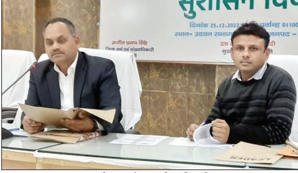
समीक्षा करते अपर जिलाधिकारी

आईजीआरएस एवं सीएम हेल्पलाइन के प्राप्त शिकायतों के निस्ताराण की प्रगति की एडीएम ने की समीक्षा