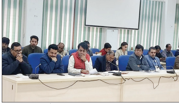
समीक्षा बैठक में उपस्थित विभिन्न विभाग के अधिकारी

में अपर जिलाधिकारी ने आईजीआरएस एवं सीएम हेल्पलाइन के तहत प्राप्त शिकायतों की विभागवार विस्तृत समीक्षा करते हुए सभी अधिकारियों से कहा कि 29 दिसम्बर तक सभी शिकायतों का निस्ताराण गुणवत्तापूर्ण सुनिश्चित किया जाय,