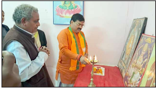
मां सरस्वती के चित्र पर दीपदान करते सांसद संगम लाल गुप्ता।

उन्होंने कहा कि आप अपना मत किसी को भी दे लेकिन उम्मीदवार आपको आकांक्षाओं को आपके लिए, आपके क्षेत्र के लिए और आपके समाज के लिए हर क्षण जागृत रहना चाहिए। एक राष्ट्र, सर्वश्रेष्ठ राष्ट्र की कल्पना तभी मूर्त रूप लेगी। जो हमारी