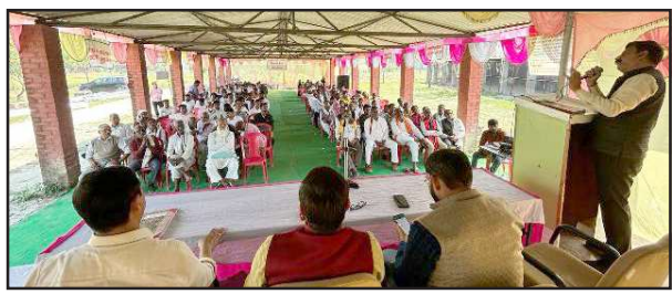
किसान मेले में किसानों को जानकारी देते अतिथि।