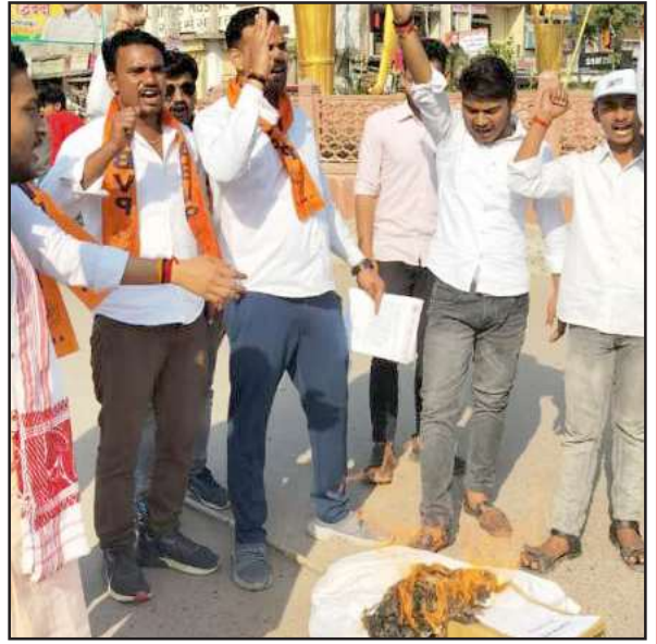
पुतला दहन करती अभाव।