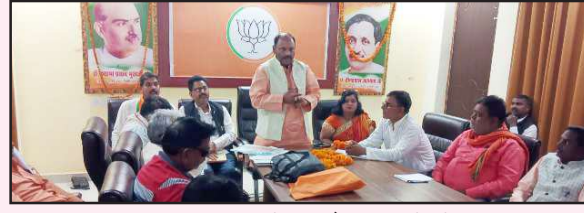
भाजपा कार्यालय पर आयोजित बैठक में बोलते अतिथि।