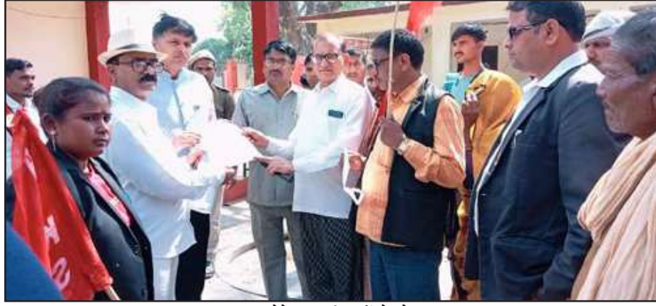
ज्ञान देते वामपंथी दलों के नेता।

मंगलवार को वामपंथी नेताओं के साथ आये लोगों ने भ्रष्टाचार बंद करो, सीआईसी बम ब्लास्ट की न्यायिक जांच कराओ, मंहगाई कम करो, बेरोजगारी कम करो, सड़कों को दुरुस्त करो की आवाज