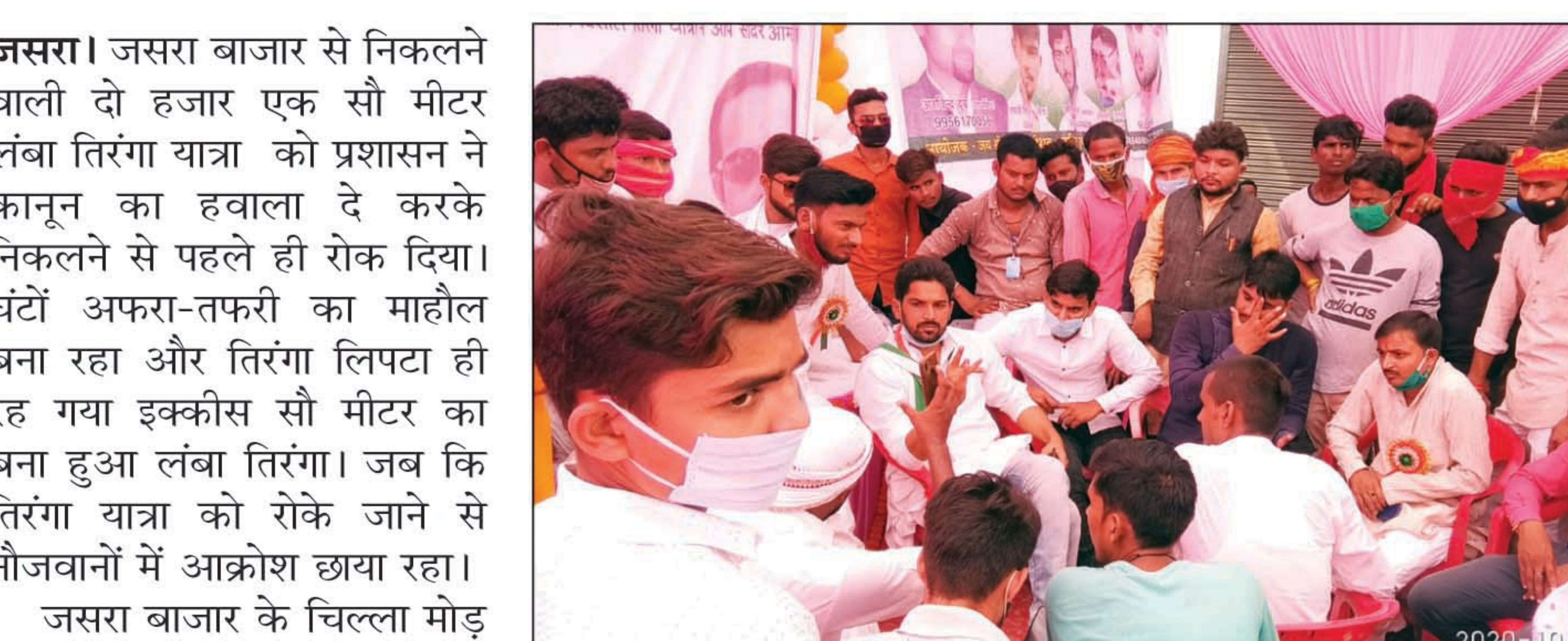
आक्रोशित युवा बैठक करते हुए

जसरा। जसरा बाजार से निकलने वाली दो हजार एक सौ मीटर लंबी तिरंगा यात्रा को प्रशासन ने कानून का हवाला दे करके निकलने से पहले ही रोक दिया। घंटों अफरा-तफरी का माहौल बना रहा और तिरंगा लिपटा ही रह गया इक्कीस सौ मीटर का बना हुआ लंबा तिरंगा। जब कि तिरंगा यात्रा को रोके जाने से नौजवानों में आक्रोश छाया रहा।