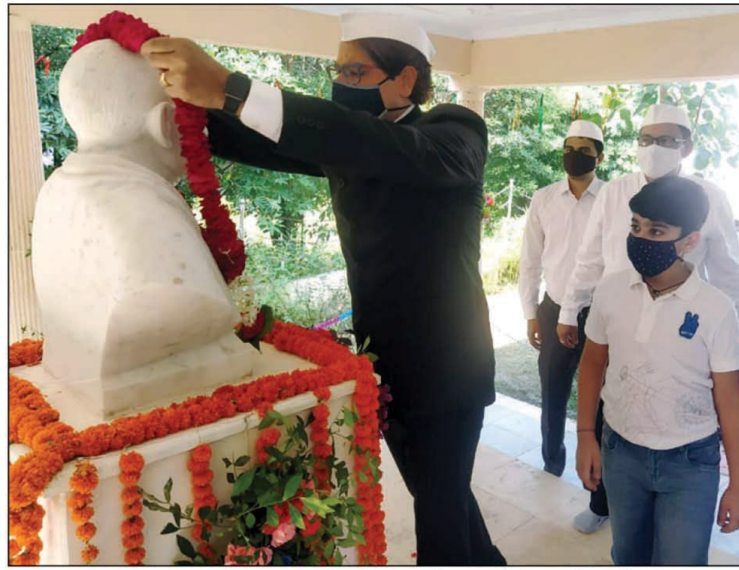
महात्मा गांधी की प्रतिमा पर माल्यार्पण करते जिलाधिकारी

नेतृत्व की अद्भुत क्षमता थी। मण्डलायुक्त ने कहा कि गांधी जी का व्यक्तित्व, उनके आदर्श एवं सिद्धान्त आज भी प्रासंगिक है। सादा जीवन उच्च विचार