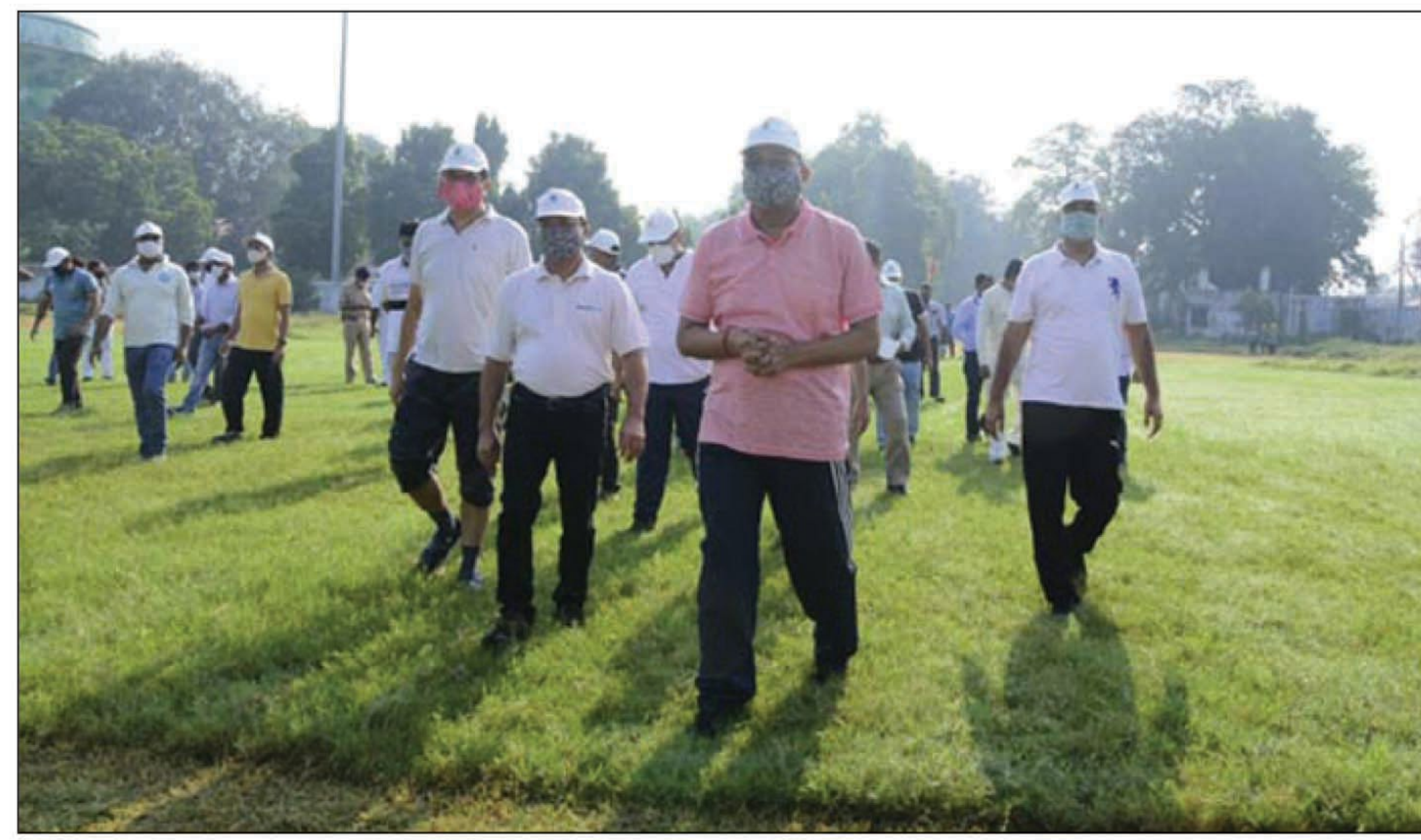
डीएसए ग्राउंड में रेलवे कर्मि

मंडल रेल प्रबंधक एवं उनकी टीम द्वारा रेलवे स्टेडियम में रेलवे परिसर की सफाई की गई। साथ ही नवीनीकृत बैडमिंटन कोर्ट का भी उद्घाटन किया।