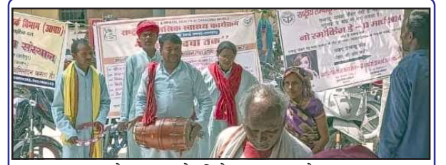
तंबाकू से दुष्प्रभाव के लिये जागरूक करते कलाकार।

प्रयागराज के स्वरूप रानी मेडिकल कॉलेज रेफर किया गया था जहां पर इलाज चल रहा था देर रात युवक की मौत हो गई। मौत की सूचना मिलते ही परिजनों में कोहराम मच गया।