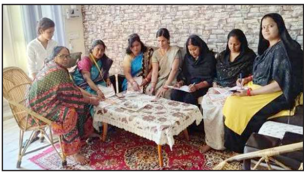
सुझाव लिखकर पीएम को भेजती महिलाएं।