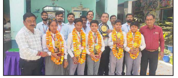
सैनिक स्कूल प्रवेश परीक्षा में चयनित चिल्ड्रेन पैराडाइज के छात्रगण।