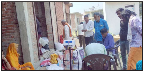
कोटेदार की दुकान पर लगी राशन कार्ड धारकों की भीड़।

सरकार दावा कर रही है की सार्वजनिक वितरण प्रणाली की नई व्यवस्था से घटतीला कालाबाजारी पर लगाम लग सकेगी और फर्जी कार्डधारकों को चिन्हित किया जा सकेगा, लेकिन राशन वितरण की नई व्यवस्था में घटतीला के खेल