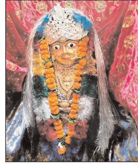
शिवजी को जल चढ़ाती हैं। प्रतिमाओं को ले जाने का सिलसिला शुरू हो चुका है। देवी-मन्दिरों में

ज्यादातर दुर्गा मां की प्रतिमायें शेर पर बैठी हुई एवं