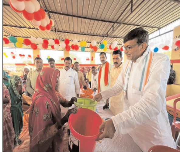
सभी प्रयास सरकार कर रही है। गांव से शहरों तक नदियों की स्वच्छता व पर्यावरण संरक्षण को