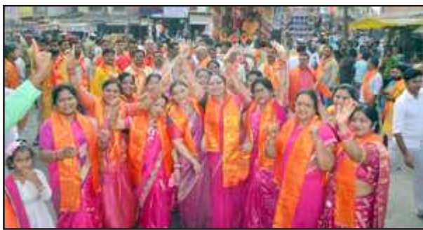
भोलेनाथ की बारात में नाचती महिलाएं।