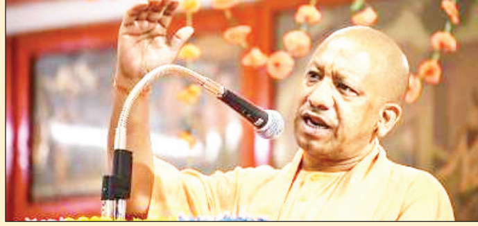
(एफआरएस) एवं टेक्नो कार्मिशनराल उपलब्ध कराने के निर्देश दिये गये हैं। इतना ही नहीं सेफ सिटी परियोजना के तहत यूपी-112 की ओर से प्रदेश में बेटियों से छेड़छाड़ एवं संवेदनशील 1861 हॉट स्पॉट को चिन्हित किया गया

के साथ इंटीग्रेसन के टेस्टिंग का काम पूरा कर लिया गया है। परिवहन विभाग और ऊबर की ओर से सीसीटीवी कैमरे और पैनिक बटन लगाने को लेकर एक एमओयू तैयार किया जा रहा है। इसके साथ ही सीसीटीवी और पैनिक बटन के लिए 9.912 लाख की धनराशि का प्रस्ताव बनाकर शासन को भेज दिया गया है। शासन से हरी झंडी मिलते ही ऊबर में सीसीटीवी और पैनिक बटन लगाने के साथ इंटीग्रेसन की कार्यवाही शुरू कर दी जाएगी। उधर, ओला के साथ इंटीग्रेसन को लेकर एक कंपनी से दोबारा संशोधित फेसियल रिक्वाइजिशन साफ्टवेयर