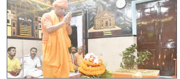
की आराधना की। इसके साथ ही कलश स्थापना कर की शैलपुत्री की आराधना की। इसके साथ ही गोरखनाथ मंदिर में विजयदशमी महोत्सव की शुरुआत भी हो गयी। मंदिर परिसर में होने वाले आयोजन परंपरागत कलश यात्रा निकाली जाएगी।

गोरखपुर गोरक्ष पीठाधीश्वर और उत्तर प्रदेश के मुख्यमंत्री योगी आदित्यनाथ ने रविवार को कलश स्थापना की। इसके साथ ही गुरु गोरक्षनाथ की तपोभूमि गोरखनाथ मंदिर में शारदीय नवरात्र के अवसर पर आयोजित होने वाली मां आदिशक्ति की परंपरागत पूजा की शुरुआत हो गयी। नवरात्र के पहले दिन रविवार को मंदिर परिसर स्थित अपने आवास के शक्तिपीठ में शाम पांच बजे कलश स्थापित किया। मां भगवती के पहले स्वरूप शैलपुत्री