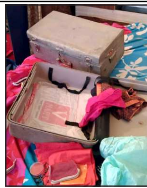
चोरी के बाद बिखरा पड़ा सामान

लालगंज, प्रतापगढ़। शुक्रवार की रात अज्ञात चोरों ने दरवाजा तोड़कर फौजी समेत दो घरों से लाखों की नगदी व जेवरात उठा ले गए। घटना की जानकारी परिजनों को सुबह हो सकी। सूचना पर पहुंची पुलिस जांच में जुट गई।