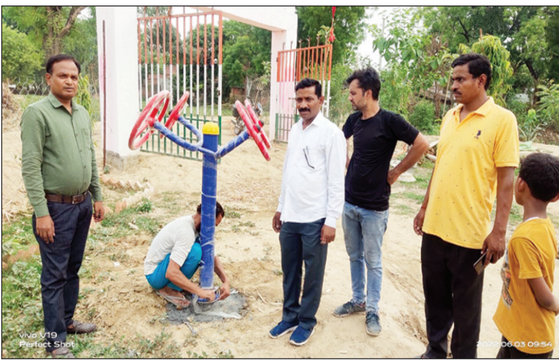
महाबली परिसर में लगा ओपन जिम को देखते लोग