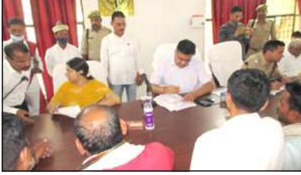
समाधान दिवस पर समारोह में जिलाधिकारी व मुख्य विकास अधिकारी

सम्पूर्ण समाधान दिवस में 417 शिकायतकर्ता आये, 13 का हुआ निस्तारण