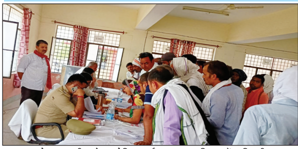
कोरांव तहसील में आयोजित संपूर्ण समाधान दिवस में फरियादी

फरियादी बार-बार अपनी फरियाद संपूर्ण समाधान दिवसों में करते रहते हैं। शनिवार को कोरांव तहसील में 156 शिकायतों में सर्वाधिक 132 शिकायतें राजस्व विभाग की रही, वहीं पुलिस विभाग की 33, विकास विभाग की 15, समाज कल्याण से 6, तथा 70 अन्य विभागों की शिकायतें दर्ज की गईं। संपूर्ण समाधान दिवस में शिक्षा व स्वास्थ्य से जुड़ी कोई भी शिकायतें नहीं मिली। प्रत्येक संपूर्ण समाधान दिवसों में राजस्व विभाग की ही सर्वाधिक शिकायतें मिलती हैं जिम्मेदार व कर्मचारी पूरे वर्ष भर