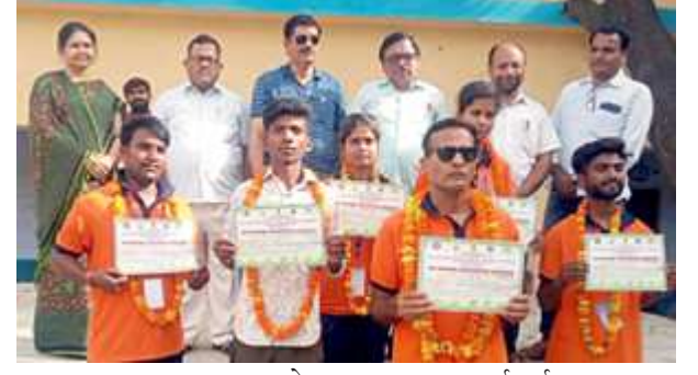
प्रमाण पत्र के साथ एनएसएस कार्यकर्ता।