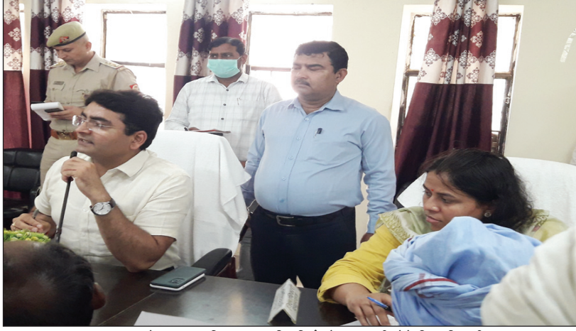
करछना में समाधान दिवस पर फरियादियों से जानकारी लेते जिलाधिकारी