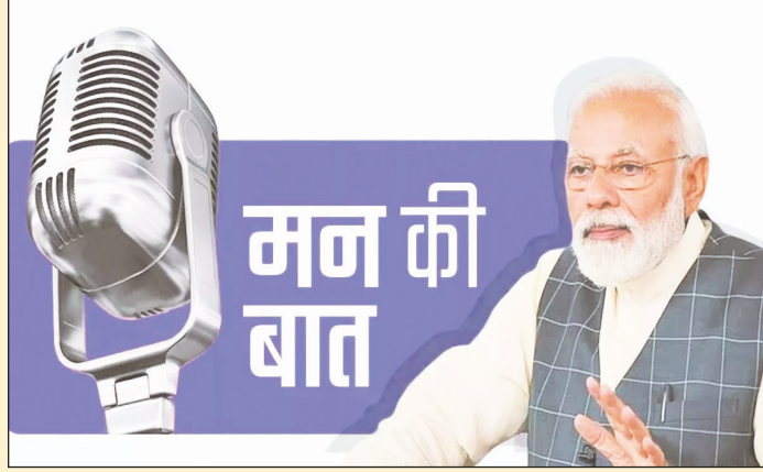
आकांक्षी हो जाएं, तो उस देश को विकसित बनने से भला कौन रोक सकता है। पहली बार वर्ल्ड यूनिवर्सिटी गेम्स में 26 मेडल जीते, पीएम ने तारीफ की: खेल पर बात करते हुए पीएम ने कहा- कुछ ही दिनों पहले चीन में वर्ल्ड यूनिवर्सिटी गेम्स हुए थे। इन खेलों में इस बार भारत का प्रदर्शन अब तक का सबसे अच्छा रहा। हमारे खिलाड़ियों ने कुल 26 पदक जीते, जिनमें से 11 गोल्ड मेडल थे। आपको ये जानकर अच्छा लगेगा कि 1959 से लेकर अब तक जितने वर्ल्ड यूनिवर्सिटी गेम्स हुए हैं, उनमें जीते

का महीना, भारत के सामर्थ्य का साक्षी बनने जा रहा है। इसके अलावा पीएम मोदी ने वर्ल्ड यूनिवर्सिटी गेम्स, पर्यटन, डेयरी इंडस्ट्री और हर घर तिरंगा अभियान पर भी बात की। पीएम ने चंद्रयान मिशन को लेकर कहा - साथियों, आपको याद होगा इस बार मैंने लाल किले से कहा है कि हमें महिलाओं के नेतृत्व में डेवलपमेंट को राष्ट्रीय चरित्र के रूप में सशक्त करना है। भारत का मिशन चंद्रयान, नारीशक्ति का भी जीवंत उदाहरण है। इस पूरे मिशन में अनेकों महिला वैज्ञानिक और इंजीनियर्स सीधे तौर पर जुड़ी रही हैं। भारत की बेटियां अब अनंत समझे जाने