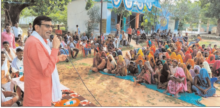
रविवार को सांसद आरके सिंह पटेल ने कहा कि बुंदेलखंड एक्सप्रेस-वे

चित्रकूट। बांदा-चित्रकूट लोकसभा के सांसद आरके सिंह पटेल ने मानिकपुर विधानसभा के पाठा क्षेत्र में जनता से सीधा संवाद किया। रुकमा खुर्द, ददरी माफी, लंका पुरवा व कर्का पुरिया के इलाक़ा पुरवा में ग्रामीणों से सांसद ने संवाद कर कहा कि केंद्र में प्रधानमंत्री नरेन्द्र मोदी की जारी गरीब कल्याण योजनाओं किसान सम्मान निधि, वैश्विक महामारी कोरोना काल से लगातार तीन वर्षों से मुफ्त राशन व प्रत्येक पुरवा-मजरा में विद्युतीकरण, बुंदेलखंड एक्सप्रेस-वे भरतकूप से बढ़ाकर देवांगना एयरपोर्ट तक बनने जा रहा है।