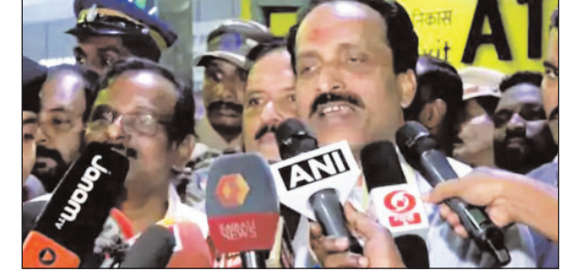
एस सोमनाथ का भी एक बयान सामने आया है, जिसमें उन्होंने कहा है कि भारत के पास चंद्रमा, मंगल और शुक्र की यात्रा करने की क्षमता है लेकिन हमें और ज्यादा इन्वेस्टमेंट की जरूरत है।

बेंगलुरु: चंद्रयान-3 की सफलता से स्पेस वेंचर में इन्वेस्टमेंट को बढ़ावा मिलने की उम्मीद तेजी से बढ़ी है। बोते हफ्ते इसरो के सप्लायर्स और उनसे जुड़ी कंपनियों के शेयर्स की कीमतों में भी तेजी देखी गई। रॉयटर्स की रिपोर्ट के मुताबिक लार्सन एंड टूब्रो और हिंदुस्तान एयरोनॉटिक्स समेत 20 कंपनियां स्मॉल सैटेलाइट लॉन्चिंग व्हीकल के प्राइवेटाइजेशन के लिए होने वाली नीलामी में बोली लगा सकती हैं। इस बीच, इसरो चीफ