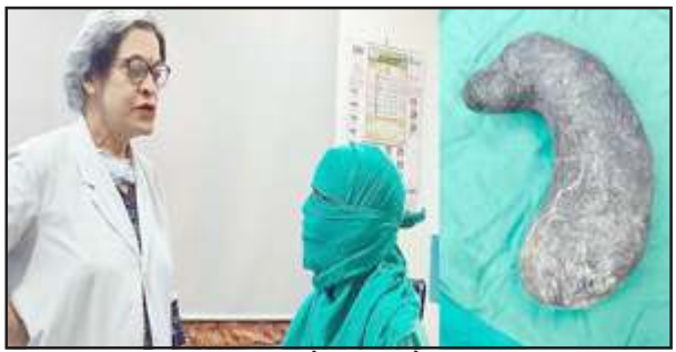
पीड़ित महिला से बात करते डाक्टर।