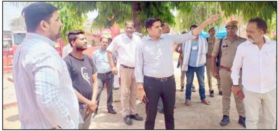
मतगणना स्थल का निरीक्षण करते डीएम आदि।

चित्रकूट। जिलाधिकारी/जिला निर्वाचन अधिकारी अभिषेक आनन्द ने लोकसभा चुनाव सकुशल शांतिपूर्ण संपन्न होने पर 236 चित्रकूट व 237 मानिकपुर विधानसभा के मतगणना स्थल राष्ट्रीय रामायण मेला परिसर सीतापुर स्थित स्ट्रॉंग रूम का निरीक्षण किया। बुधवार को जिला निर्वाचन अधिकारी ने दोनों विधानसभाओं की मतगणना टेबल, बैरीकेडिंग, पेयजल, शौचालय, कुलर, पंखा, प्रकाश व्यवस्था, मीडिया सेंटर आदि देखा। जिला निर्वाचन अधिकारी ने एडीएम एफआर से कहा कि 236 चित्रकूट व 237 मानिकपुर