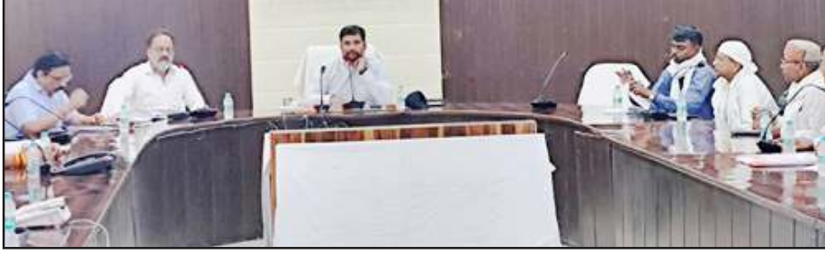
मतगणना बाबत चर्चा करते डीएम।