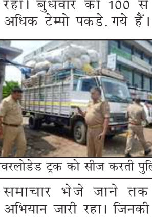
समाचार भेजे जाने तक अभियान जारी रहा। जिनकी

प्रतापगढ़। दो दिन पहले लीलापुर क्षेत्र में हुई भीषण दुर्घटना में हुई 12 लोगों की मौत के बाद पुलिस महकमा एक्शन मोड में है। मंगलवार को टेम्पो चालकों की धरपकड़ शुरू की गई है। मंगलवार को 97 टेम्पो, 7 बस और एक ई-रिक्शा पकड़ा गया है। उसे पकड़कर पुलिस लाइन में लाया गया था। आज भी पुलिस का यह अभियान जारी