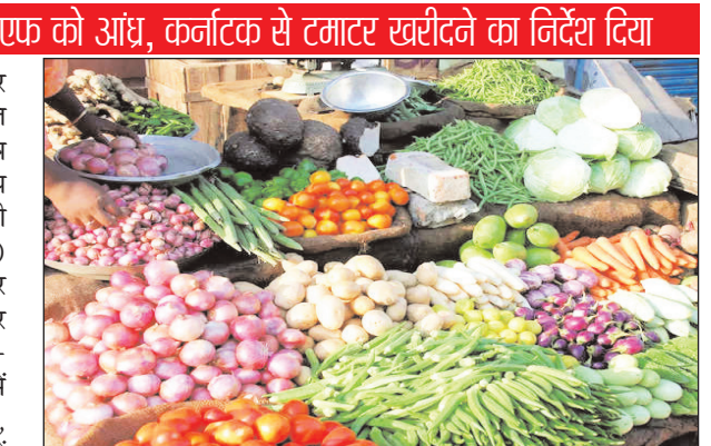
जानकारी दी। इसमें कहा गया है कि टमाटर का स्टॉक इस सप्ताह शुक्रवार तक दिल्ली-एनसीआर क्षेत्र में उपभोक्ताओं को रियायती कीमतों पर खुदरा दुकानों के माध्यम से वितरित किया जाएगा।

केंद्र ने नेफेड, एनसीसीएफ को आंध्र, कर्नाटक से टमाटर खरीदने का निर्देश दिया नई दिल्ली: केंद्र सरकार ने टमाटर की बढ़ती कीमतों को नियंत्रित करने के लिए राष्ट्रीय कृषि सहकारी विपणन महासंघ (नेफेड) और राष्ट्रीय सहकारी उपभोक्ता महासंघ (एनसीसीएफ) को आंध्र प्रदेश, कर्नाटक और महाराष्ट्र की मंडियों से टमाटर खरीदने और उन्हें दिल्ली-एनसीआर सहित प्रमुख केंद्रों में वितरित करने का निर्देश दिया है, जहां पिछले एक महीने में कीमतों में सबसे अधिक वृद्धि दर्ज की गई है। उपभोक्ता मामलों के विभाग ने बुधवार को एक बयान में यह