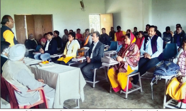
विवेकानंद जयंती पर कार्यक्रम मनाते एकल अभियान के लोग