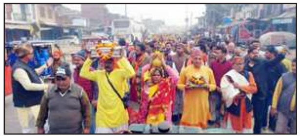
सिर पर कलश रखकर कलश यात्रा में चलते लोग।