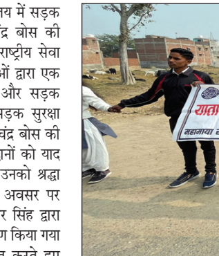
सुभाष चंद्र बोस की जयंती पर मानव श्रृंखला बनाते महामाया स्कूल के छात्र