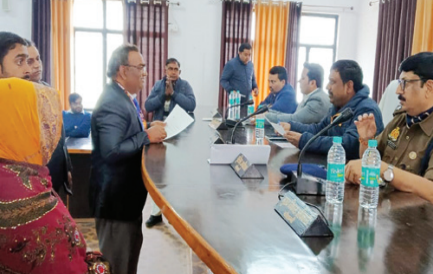
तहसील समाधान दिवस में फेरियाद सुनते डीएम एसपी

आईजीआरएस के तहत प्राप्त शिकायतों को डिफाल्टर होने से पूर्व ही निरास्तारित करना सुनिश्चित किया जाय