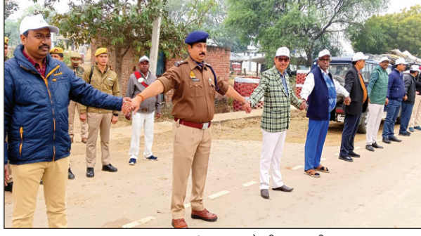
सड़क सुरक्षा पर मानव श्रृंखला बनाते डीएम एसपी व अन्य