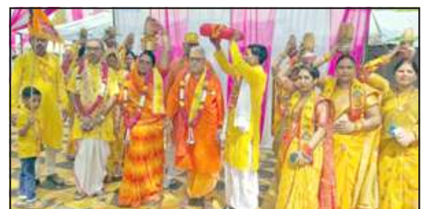
सिर पर कलश लेकर मौजूद महिलाएं।