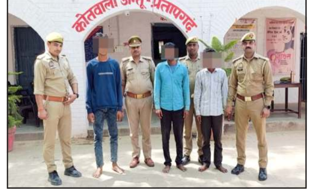
पुलिस की हिरासत में अभियुक्तगण।