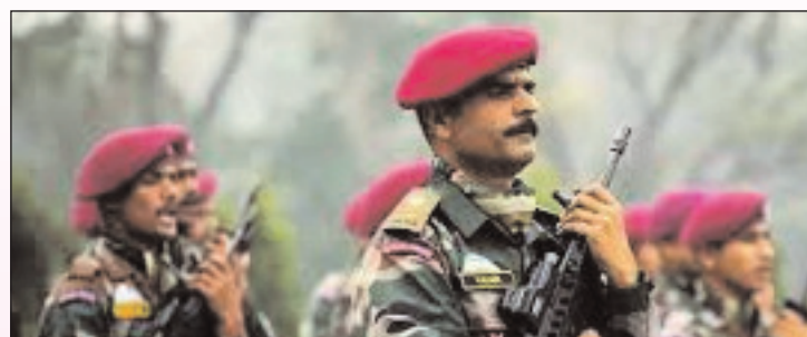
है। सरकार बनने के बाद इस पर कोई बड़ा फैसला लिया जा सकता है। वहीं सेना के पूर्व अफसरों का कहना है कि इस योजना को रद्द करने, पुरानी भर्ती प्रक्रिया को लागू किया जाए। भाजपा सरकार ने इस योजना को 14 जून 2022 को लागू किया था। जेडीयू और लोजपा ने की समीक्षा की मांग

नई दिल्ली मांदी सरकार 3.0 के शपथग्रहण समारोह से पहले ही एनडीए के सहयोगियों ने अग्निपथ योजना की समीक्षा करने की मांग शुरू कर दी है। जेडीयू के केसी त्यागी के बाद लोजपा रामविलास के राष्ट्रीय अध्यक्ष चिराग पासवान ने इस योजना पर पुनर्विचार करने की इच्छा जताई है। वहीं अब अंदरखाने खबरें आ रही हैं कि इस योजना में बदलाव किया जा सकता