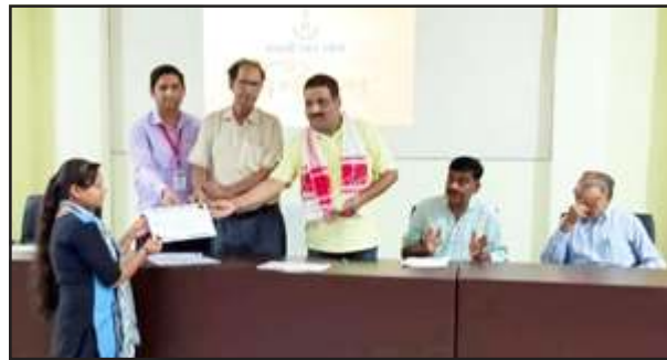
छात्रों को सम्मानित करते अतिथि।

चित्रकूट। महात्मा गांधी चित्रकूट ग्रामोदय विश्वविद्यालय ने मंत्र बोर्ड से कक्षा बारहवीं की परीक्षा में कला, विज्ञान, वाणिज्य व कृषि में चित्रकूट कस्बे के विद्यालयों में प्रथम, द्वितीय, तृतीय आने वाले 50 से अधिक प्रतिभाशाली विद्यार्थियों व शिक्षकों, अधिभावकों तथा ग्रामोदय परिवार की मौजूदगी में सम्मानित किया।