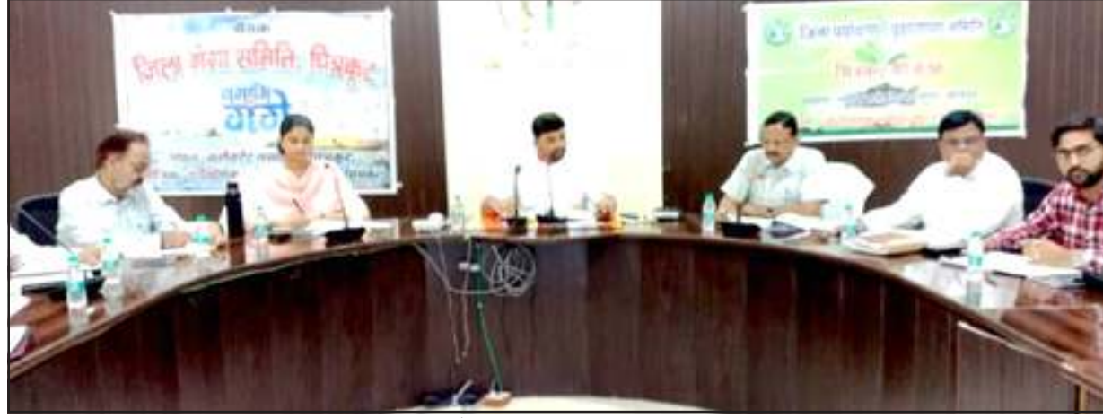
बैठक में निर्देश देते डीएम।

उन्होंने कहा कि ग्राम समूह की महिलाओं को प्रेरित करें कि दोना-पत्तल के कार्य में प्रगति लगावें, ताकि पर्यावरण संरक्षित किया जा सके। डीएम को निर्देश दिये कि