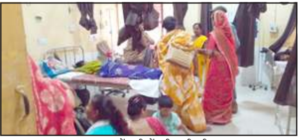
अस्पताल में मरीजों की बढ़ी भीड़।

पट्टी, प्रतापगढ़। इलाके में उमस भरी गर्मी से लोग बेहाल हैं। आलम यह है कि जरा सी लापरवाही से लोगों को अस्पताल पहुंचाना पड़ रहा है। अस्पताल में मरीजों की संख्या भरी पड़ी है। एक एक चिकित्सक सैकड़ों मरीज प्रतिदिन देख रहा है। कुछ दिन पूर्व लोग नीतपा के कहर से परेशान ही थे कि तभी हल्की सी बरसात ने लोगों को राहत दिया। पर हल्की सी बरसात ने मौसम का मिजाज इस तरह बदल दिया कि लोग उमस भरी गर्मी से बीमार हो रहे हैं। अस्पताल में मरीजों की संख्या खचा