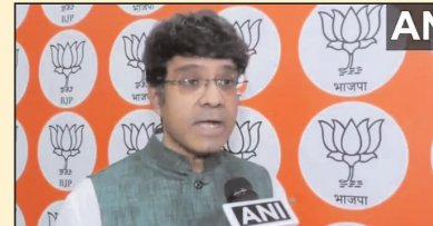
राहुल गांधी ने 3 जून को शेयर मार्केट में स्कैम का दावा किया था एक जून को एरिजट पोल के बाद 3 जून को शेयर मार्केट 600 अंकों के बड़े गैपअप के साथ खुला। थोड़ी ही देर में रिकॉर्ड हाई 23,338.70 को छू लिया। लेकिन 4 जून को जब लोकसभा चुनाव का परिणाम आया तो शेयर मार्केट आँधे मुह गिर गया। संसेक्स 6 हजार अंकों की गिरावट के साथ 70374 हजार के लेवल तक आ गया। वहीं दूसरी ओर निफ्टी इंडेक्स करीब 1947 अंक की भारी गिरावट के साथ फिसलकर 21,316 के लेवल पर पहुंच गया था। कोरोना काल के बाद ये बाजार की सबसे बड़ी गिरावट आ गई।

चेन्नई तमिलनाडु में भाजपा नेता सीआर केसवन ने राहुल गांधी पर तंज कसते हुए कहा है कि उनका राजनीतिक शेयर बहुत निचले स्तर पर पहुंच गया है। वह लोकसभा चुनाव में मिली हार के कारण सदमे में पहुंच गए हैं। केसवन बोले- राहुल गांधी को जनता ने खारिज कर दिया है। भाजपा नेता ने कहा कि राहुल गांधी की लगातार निराशावादी राजनीति, झूठे प्रसार को जनता ने तिरास कर चुनाओं में खारिज कर दिया है। राहुल गांधी इस हार से पूरी तरह टूट गए हैं और सदमे में हैं। वह इस सच को स्वीकार ही नहीं