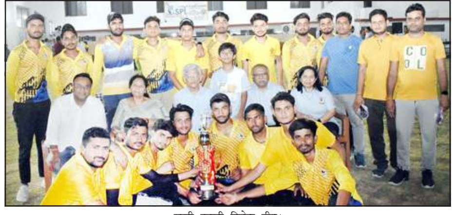
खुशी मनाती विजेता टीम।