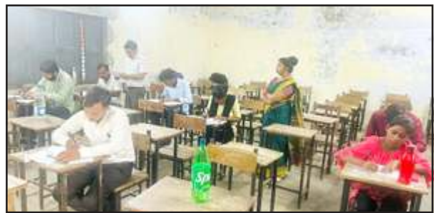
परीक्षा कक्ष का निरीक्षण करते शिक्षकगण।