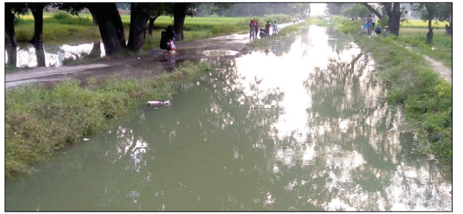
करछना रजबहा उफान पर लोगों की डूब रही धान की फसल