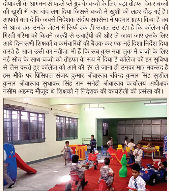
खेलकूद में लगे बच्चे