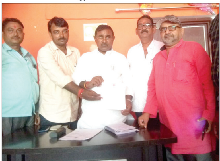
जनसुनवाई के दौरान श्रमिकों के हितार्थ पत्र व्यवहार भेजते व सुनवाई करते विधायक कोराव राजमणि कोल व अन्य।

कोराव। विधायक कोराव राजमणि ने अपने आवास पर जनसुनवाई के दौरान भूमि हीनों की परेशानियों के दृष्टिगत ग्राम सभा के ग्राम प्रधान बंधुओं से ग्राम की खाली पड़ी नवीन परती, बंजर आदि की जमीनें भूमि हीनों को आवंटित किए जाने का आह्वान किया। विधायक ने राजस्व अधिकारियों को भी गांवों में ग्राम समाज की खाली पड़ी जमीनों को खाली कराकर भूमि हीन एवम आवास विहीन पात्र लोगों को तत्काल आवंटन करने के निर्देश दिए। जिससे प्रधान मंत्री आदि आवास योजना के लाभ से कोई वंचित न रहे। उन्होंने विद्युत विभाग द्वारा कई गांवों में बिना कनेक्शन दिए मीटर लगा कर बिल भेज कर वसूली करने की प्रक्रिया पर नाराजगी जताई। और अधिकारियों को ऐसे उप भोक्ताओं से बिल न लेने को कहा। विधायक ने श्रम विभाग के अफसरों पर नाराजगी जताते हुए कहा कि जिनके श्रम कार्ड बने हैं।