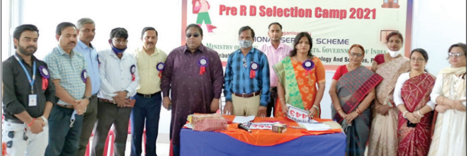
शुआट्स की राष्ट्रीय सेवा योजना के अन्तर्गत प्री-आरडी चयन शिविर में लोग