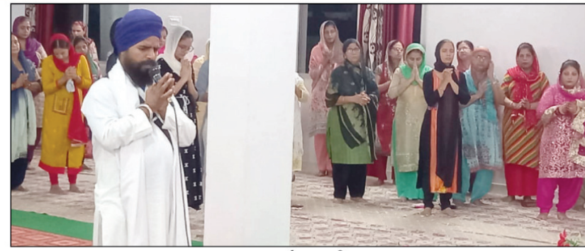
गुरुदास प्रकाश पर्व पर एकत्रित श्रद्धालु।