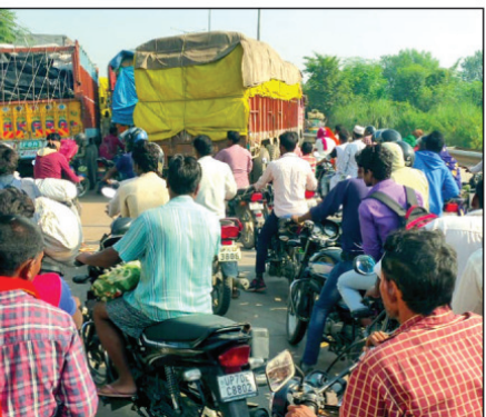
घूरपुर हाईवे के जाम में फंसे राहगीर

घूरपुर। इरादतगंज रेलवे स्टेशन के रैक पर गेहूँ लादकर पहुंचाने वाले ट्रकों की लंबी लाइन से घूरपुर बाजार से इरादतगंज दो किलोमीटर तक लगने से हाईवे पर दिन रात जाम की स्थिति बने रहने से जहां दुकानदारों का काफ़ी नुकसान हो रहा है वहीं लंबी ट्रकों की लाइन से सड़क जाम होने से घंटों राहगीरों को भारी फजीहत का सामना करना पड़ रहा है। बता दे कि इरादतगंज रेलवे स्टेशन पर लगने वाले रैक पर तीन दिन सैकड़ों ट्रक गेहूँ लादकर पहुंचते हैं। ट्रकों की लम्बी लाइन घूरपुर बाजार से इरादतगंज तक विगत तीन दिनों से लगी है। ट्रकों की लंबी लाइन लगने से हाइवे पर खुले सैकड़ों व्यवसायिक प्रतिष्ठान बुरी तरह से प्रभावित हो रहे हैं। जिससे बाजार के कारोबारियों में काफ़ी रोष व्याप्त है। साथ ही ट्रकों की आड़ी तिखी लाइन के चलते बाइक सवार व साइकिल सवार राहगीर दुर्घटना के शिकार होते हुए चुटकील हो रहे हैं। राहगीर घंटों जाम में फंसे रहते हैं। एक तरफ की ही सड़क पर ट्रकों की दोनों तरफ ट्रकें खड़े किए जाने से दिन रात जाम की स्थिति रहती है। आरोप है कि स्थानीय पुलिस से बाजार वासियों ने कतार वह खड़े किए जाने व जाम से निजात दिलाने की गुहार लगाने के बावजूद भी कोई कार्रवाई नहीं कर रही है। बाजार के लोगों ने आक्रोश व्यक्त करते हुए