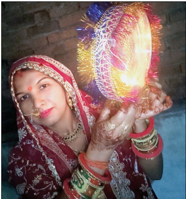
अखंड भारत संदेश

पति की लंबी उम्र के लिए सुहागिनों ने रखा करवा चौथ का व्रत