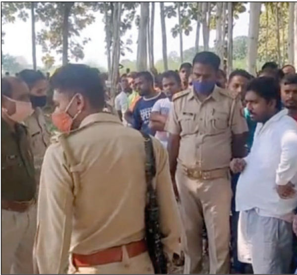
युवक का शव मिलने के बाद मौके पर लगी ग्रामीण और पुलिस की भीड़

पड़सा थाना क्षेत्र के कैमा गांव की एक बाग में रक्त रंजित मिला युवक का शव, ननिहाल में रह रहा था युवक लोगों से चल रहा था संपत्ति विवाद