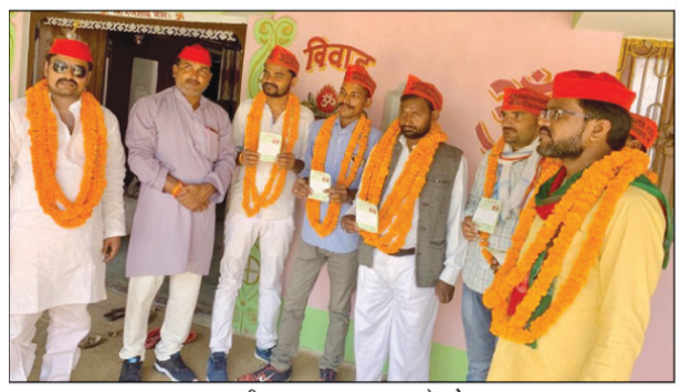
सपा की सदस्यता ग्रहण करते लोग।