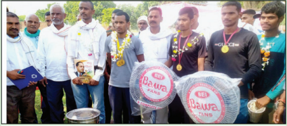
खेलकूद प्रतियोगिता में सम्मानित खिलाड़ी