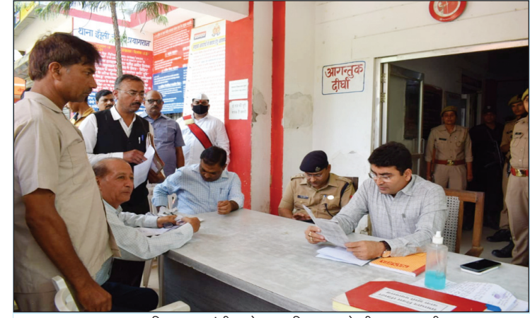
समाधान दिवस पर झूंसी थाने पर फरियाद सुनते डीएम एसएसपी

जिसपर जिलाधिकारी एवं वरिष्ठ पुलिस अधीक्षक ने आवेदनों को गम्भीरता से लेते हुए तत्काल वहां पर भी शिकायतों के निस्तारण करने के लिए नायब तहसीलदार, राजस्व निरीक्षक एवं लेखपालों एवं पुलिस टीम बनाकर मौके पर निस्तारण हेतु रवाना किया तथा जो भी आवेदन प्राप्त हो, उसका गुणवत्तापूर्ण ढंग से निस्तारण सुनिश्चित करने के निर्देश दिये हैं।