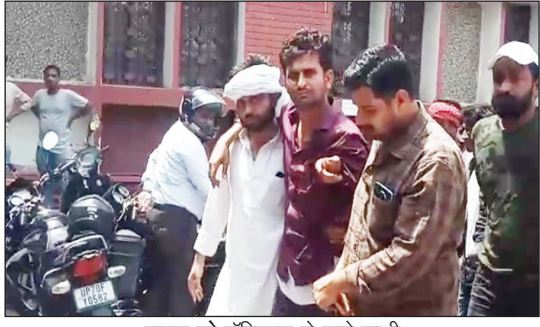
घायल को हॉस्पिटल ले जाते साथी