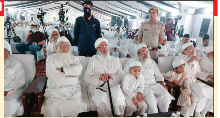
है। सभी लोग राष्ट्र निर्माण और राष्ट्र को मजबूत करने की बात करते हैं लेकिन नफरत के मुद्दे पर खामोश रहते हैं। कहा कि नफरत की दुकान खोलने वाले और नफरत का बाजार सजाने वाले लोग देश के दुश्मन हैं। नफरत का जवाब कभी नफरत नहीं हो सकता, हम नफरत का जवाब मोहब्बत से देने वाले लोग हैं।

कि बेइज्जत होकर खामोश रहना कोई मुसलमान से सीखे। देश में नफरत का बाजार सजना जा रहा है। ये सब का इतिहास है। उन्होंने कहा कि सरकारें आने-जाने वाली चीज है, लेकिन देश को जोड़ने वाले और मजबूत करने वाले ही इस देश की ताकत हैं। इंदगाह के विशाल मैदान में आयोजित सम्मेलन के पहले चरण में अध्यक्षीय भाषण में मौलाना महमूद मदनी ने इशारों इशारों में सरकार और आरएसएस पर हमला बोला। कहा कि एकता और अखंड भारत की बात करने वाले वर्ग विशेष को परेशान कर रहे हैं। उन्होंने कहा कि हमें सबसे ज्यादा प्यार इस देश की शांति से