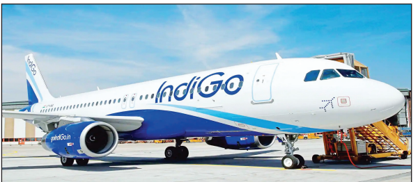
एयरलाइन के कर्मचारियों ने सात मई को एक दिव्यांग बच्चे को रांची हवाईअड्डे पर विमान में चढ़ने से रोक दिया था। इंडिगो ने इसका कारण बताया था कि बच्चा विमान में यात्रा करने से घबरा रहा था। इस घटना के सामने आने के बाद जहां विमानन नियामक डीजीसीए ने मामले में जांच करने के निर्देश दिए थे।

रांची: रांची एयरपोर्ट पर दिव्यांग बच्चे को फ्लाइट में न चढ़ने देने के मामले में विमानन महानिदेशक डीजीसीए ने इंडिगो एयरलाइन कंपनी पर पांच लाख का जुर्माना लगाया है। डीजीसीए ने कहा कि इंडिगो के ग्राउंड स्टाफ ने दिव्यांग बच्चे के साथ जैसा बर्ताव किया, वह ठीक नहीं था और इससे स्थितियां भद्दक उठीं। डीजीसीए ने एयरलाइन को कारण बताओ नोटिस भी जारी किया और घटना पर नाराजगी जाहिर की। डीजीसीए ने दिए पांच लाख का आदेश: इससे पहले इंडिगो