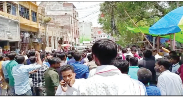
चक्का जाम करते व्यापारी

प्रयागराज। शहर के कोतवाली क्षेत्र बहादुरगंज में मोबाइल दुकानदार को थाने ले जाए जाने पर जमकर हंगामा हुआ। दुकानें बंद कर व्यापारी सड़क पर आ गए और विरोध प्रदर्शन करते हुए जाम लगा दिया। सूचना पर पुलिस पहुँची और फिर किसी तरह समझाकर उन्हें शांत कराया गया। पुलिस का कहना है कि मामला एप्पल कंपनी की नकली एसेसरीज बेचने का है। जांच पड़ताल की जा रही है। घटना शनिवार दोपहर की है। एप्पल इंडिया कंपनी के अफसरों को सूचना मिली थी कि शहर के कोतवाली इलाके में स्थित एक दुकान पर कंपनी के नाम पर नकली एसेसरीज बेची जा रही हैं। इस पर कंपनी के अफसर शनिवार को कोतवाली थाने पहुँचे और पुलिस से शिकायत की। इसके बाद पुलिस को साथ लेकर लक्ष्मण मार्केट में स्थित एक मोबाइल की दुकान पर पहुँचे। यहाँ