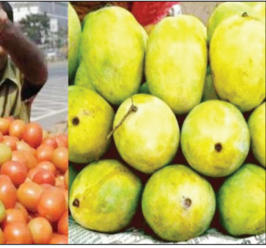
गर्मी और लू का बुरा असर: गर्मी और लू के थपड़ों ने सब्जियों में खासकर टमाटर और फलों के राजा आम की कीमतें इतनी बढ़ा दी हैं कि ये सब्जी और फल आम आदमी की पहुंच से दूर हो गए हैं। टमाटर की जरूरत हर घर के किचन में होती है और आम तो

नई दिल्ली: आम को फलों का राजा ऐसे ही नहीं कहा जाता, वर्तमान हालात को देखें तो आम आदमी के लिए यह फल अब खास बन गया है। गर्मी में लोग आम का लुत्फ उठाने का इंतजार करते हैं। ताजा हाल की बात करें तो आम के दाम इस तेजी से बढ़े हैं कि ये आम आदमी की पहुंच से दूर होता जा रहा है। इसके अलावा टमाटर भी सुर्ख लाल आंखें दिखा रहा है। एक रिपोर्ट के मुताबिक, जहां सब्जी मार्केट में टमाटर का दाम 120 रुपये प्रति किलो तक पहुंच गया है, आम का दाम 100 रुपये के पार चला गया है।