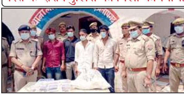
पुलिस की गिरफ्त में अवैध तमंचा तस्क़र।

तो उनके पास से आधा दर्जन निर्मित, तीन अर्धनिर्मित, आठ कारतूस के साथ तमंचा बनाने