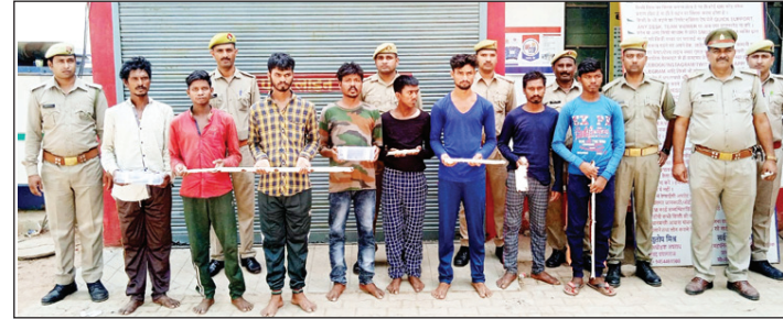
पुलिस की गिरफ्तार में दुर्दांत डकैत