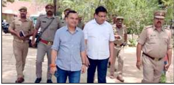
थाने का निरीक्षण करते डीएम-एसपी।