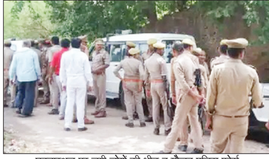
घटनास्थल पर लगी लोगों की भीड़ व मौजूद पुलिस फोर्स