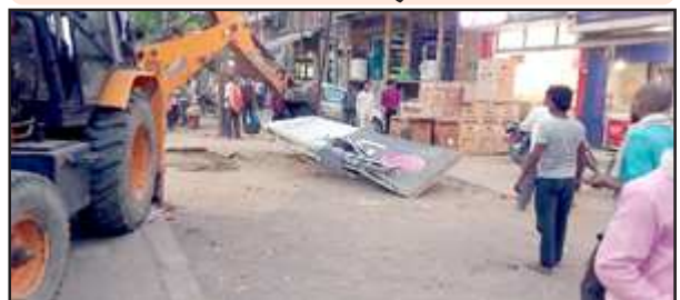
जेसीबी से होर्डिंग को उतारते नगर पालिका कर्मी।

हटाया गया था। रेलवे स्टेशन के बाहर चाय-पाय की दुकानों के छपर और चाय की गुमटी हटाई गई। नगर पालिका ने सभी व्यवसायियों से नाली के पीछे दुकान लगाने का निर्देश दिया है। इसके अलावा