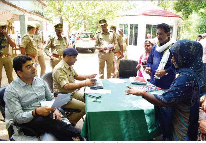
समाधान दिवस पर जनता की समस्याओं को सुनते जिलाधिकारी व वरिष्ठ पुलिस अधीक्षक

झूंसी, सरायइनायत एवं उतरांव थाने में समाधान दिवस पर लगी भीड़, प्राप्त शिकायतों के निस्तारण हेतु तत्काल राजस्व एवं पुलिस टीम का गठन कर मौके पर किया रवाना, वरासत सम्बंधी मामलों में लापरवाही बरतने पर दो लेखपालों को दी कड़ी चेतावनी