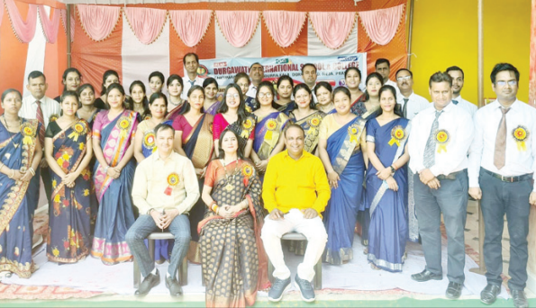
समापन समारोह में उपस्थित विद्यालय के अध्यापक