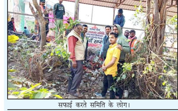
सफाई करते समिति के लोग।