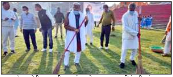
बेल्हा देवी घाट की सफाई करते नपाध्यक्ष व निरंकारी संत।