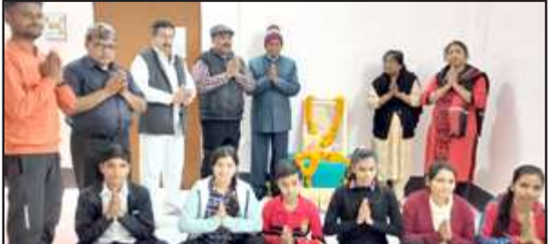
संत गाडगे महाराज की जयंती पर मौजूद अतिथिगण।