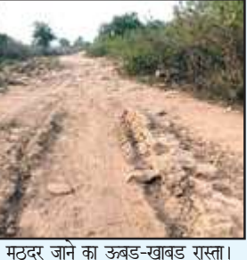
मठर जाने का ऊबड़-खाबड़ रास्ता।

चित्रकूट। पाठा क्षेत्र के मडहन में आस्था के केंद्र मठर के भैरम बाबा की उपेक्षा से श्रद्धालु आहत हैं। यहां सड़क-बिजली जैसी बुनियादी सुविधाओं का अभाव है। वैसे तो यहां वर्ष पर्यन्त बंधारे होते रहते हैं। भादों माह में दर्जनों गांवों के हजारों लोगों का जमावड़ा लगता है। बुंदेली सेना ने सूबे के मुख्यमंत्री से मठर में बुनियादी सुविधाओं की मांग की है। रिवार को बुंदेली सेना जिलाध्यक्ष अजीत सिंह ने बताया कि मठर के नजदीक मुख्यमंत्री योगी आदित्यनाथ ने जनसभा की थी। मुख्यमंत्री की जनसभा से करीब ग्राम पंचायत ने आदर्श तालाब बनवाया है। मुख्य सड़क से तालाब को इंटरलाकिंग मार्ग बना है। नजदीक ही मठर की सड़क अथुरी पड़ी है। वन विभाग क्षेत्र में आने वाली ये सड़क मुख्य मार्ग से तीन किमी लम्बी है। यहां ऊबड़-खाबड़, पथरीले रास्ते से होकर श्रद्धालु मठर जाने को मजबूर हैं। आस्था के बड़े केंद्र में पाठा क्षेत्र की छह ग्राम पंचायतों के दर्जनों गांव के लोग पहुंचते हैं। सोनेपुर, कर्वा माफी, कोल गदहिया के ग्रामीण व कर्वा नगर के ज्योपारी यहां साल भर में एकबार बंधारा करने व प्रसाद चढ़ाने जाते हैं। यहां पेयजल की विकट समस्या थी। कैबिनेट मंत्री आशीष पटेल ने सोलर पम्प लगाकर श्रद्धालुओं को राहत दी है। सड़क और बिजली की समस्या दूर हो जाये तो मठर में बुनियादी सुविधाएं हो जायेंगी। मुख्यमंत्री को भेजे पत्र में समस्या निराकरण की मांग की गई है।