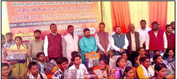
कम्प्यूटर वितरण के दौरान अतिथिगण।