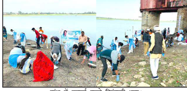
बांध में सफाई करते निरंकारी भक्त।