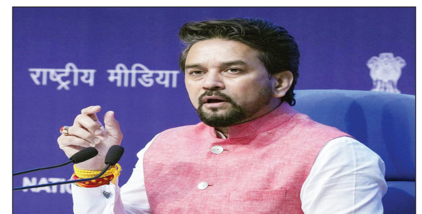
रन' के मौके पर की। उन्होंने कानून व्यवस्था के मुद्दे पर पश्चिम बंगाल सरकार पर भी निशाना साधा। उन्होंने आईआईएफएल जीतो अहिंसा रन पर कहा कि यह दौड़ शांति और अहिंसा के साथ फिट इंडिया का संदेश दे रही है। ठाकुर ने कहा कानून व्यवस्था कैसे चरमराती है, इसकी सबसे बड़ी रोल मॉडल ममता बनर्जी हैं।

नई दिल्ली: केंद्रीय सूचना एवं प्रसारण मंत्री अनुराग ठाकुर ने कहा है कि राहुल गांधी ने वीर सावरकर का अपमान किया है। उसके लिए देश उन्हें कभी माफ नहीं करेगा। राहुल गांधी 10 जन्म लेगे तब भी सावरकर नहीं बन सकते। सावरकर ने आजादी के लिए पूरा जीवन खपा दिया। राहुल ने अंग्रेजों की सहायता लेकर भारत के लोकतंत्र को कमजोर करने में समय बिताया। केंद्रीय मंत्री ठाकुर ने आज (रविवार) यह टिप्पणी राष्ट्रीय राजधानी के जवाहर लाल नेहरू स्टेडियम में 'आईआईएफएल जीतो अहिंसा