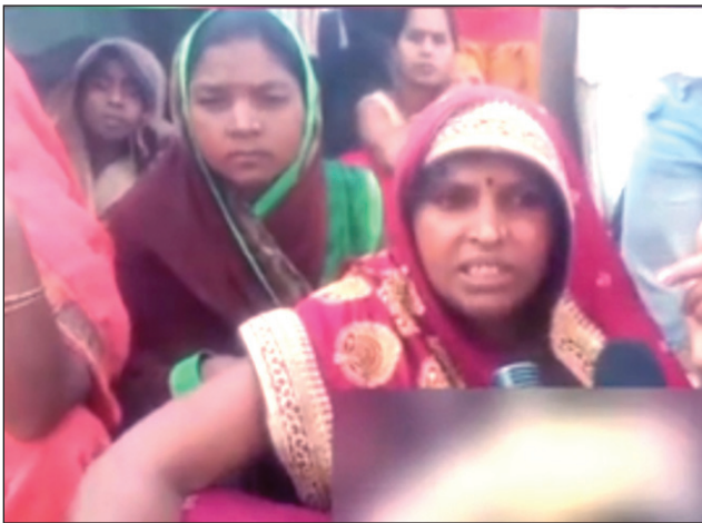
अखंड भारत संदेश

पास में मिली दारू की शीशी, परिजन बोले- जहरीली शराब के सेवन से गई जान