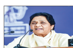
रिपोर्ट ली। उन्होंने प्रगति पर संतोष व्यक्त करते हुए कार्यों में आने वाली कमियों को दूर करने की हिदायत भी दी। उन्होंने यूपी में निकाय चुनाव को पूरी गंभीरता से लेकर उस पर पूरा ध्यान केंद्रित करने के निर्देश दिए। रक्षा के ताजा हालात व राजनीतिक घटनाक्रमों आदि से

लखनऊ: बहुजन समाज पार्टी (बसपा) की राष्ट्रीय अध्यक्ष मायावती रविवार को लखनऊ मॉल एवेन्यू स्थित पार्टी कार्यालय में बैठक की। यह बैठक नगर निकाय चुनाव को लेकर की जा रही है। बैठक में पार्टी के प्रदेश अध्यक्ष, मंडल कोऑर्डिनेटर, जिलाध्यक्ष समेत अन्य पदाधिकारी भी शामिल रहे हैं। मायावती ने सबसे पहले पार्टी संघठन की मजबूती और प्रदेश के गांव-गांव में पार्टी के जनाधार को केंद्र के आधार पर बढ़ाने के दिसम्बर माह में दिए गए कार्यों की