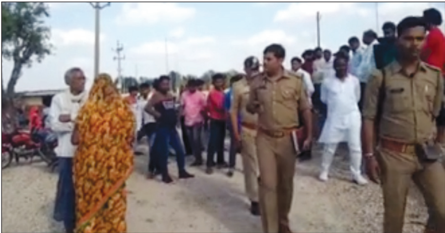
अखंड भारत संदेश

प्रयागराज। इंडस्ट्रियल एरिया थाना अंतर्गत अजवैया गांव में रविवार की दोपहर एक कारपेंटर की संदिग्ध परिस्थिति में मौत हो गई। उसके घरवालों ने आरोप लगाया कि जहरीली शराब पीने की वजह से उसकी मौत हुई है। पोस्टमार्टम रिपोर्ट में मौत की वजह हार्ट अटैक बताई जा रही है। पुलिस ने शव को परिजनों को सौंप दिया है।