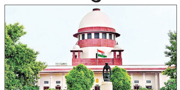
भट और दीपांकर दत्ता की पीठ ने नार्कोटिक्स ड्रग्स एंड साइकोट्रॉपिक सब्सटेंस (एनडीपीएस) एक्ट के तहत आरोपित एक व्यक्ति को जमानत पर रिहा करते हुए यह टिप्पणी की। पीठ ने कहा कि जहां अभियुक्त सबसे कमजोर आर्थिक तबके से ताल्लुक रखते हैं।

नई दिल्ली: सुप्रीम कोर्ट ने कहा कि जेलों में क्षमता से अधिक कैदी हैं और वहां रहने की स्थिति अक्सर भयावह होती है। ऐसे में अदालतों को यह सुनिश्चित करना चाहिए मुकदमों को तेजी से पूरा किया जाए, खासकर उन मामलों में जहां विशेष कानून के तहत कड़े प्रविधान लागू होते हैं। शीर्ष अदालत ने दिया तर्क: शीर्ष अदालत ने कहा कि यदि मुकदमों की सुनवाई समय पर पूरी नहीं होती है, तो व्यक्ति के साथ होने वाले अन्याय की कोई सीमा नहीं है। जस्टिस एस रवींद्र