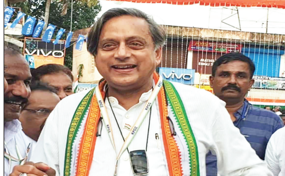
नई दिल्ली: अगले साल होने वाले लोकसभा चुनाव में भाजपा को हराने के लिए विपक्षी पार्टियों के बीच एकजुट होने को लेकर चर्चा जारी है। इसी बीच कांग्रेस नेता और लोकसभा सांसद शशि थरूर ने विपक्षी एकता को लेकर बड़ा बयान दिया है। लोकसभा सांसद शशि थरूर ने हालिया 'विपक्षी एकता की लहर' का स्वागत करते हुए रविवार को कहा कि कांग्रेस हकीकत में वह आधार बनेगी, जिसके चारों ओर अन्य पार्टियां जुटेंगी। लेकिन उन्होंने जोर देकर कहा कि अगर वह पार्टी नेतृत्व में होते, तो वह इसके बारे में बात नहीं करते और 2024 के आम चुनाव में भाजपा से मुकाबला करने के लिए गठबंधन के संयोजक

रुपये है कि जुबान तक लड़खड़ा जाए। वीडियो में क्या कहा गया?: भाजपा की तरफ से जारी वीडियो में कहा गया कि कांग्रेस ने जनता की गाड़ी कमाई के 48 खरब 20 अरब 69 करोड़ रुपये लूटे हैं। इस दौरान कोयला से लेकर 2-जी और कॉमनवेलथ घोटाले तक का जिक्र किया गया है। वीडियो में कहा गया कि 48 खरब 20 अरब 69 करोड़ रुपये से देश की सुरक्षा से लेकर प्रगति तक के न जाने कितने काम किए जा सकते थे।