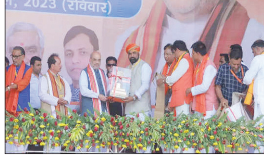
लोकसभा चुनाव के बाद नीतीश सरकार खुद ही गिर जाएगी। भाजपा दंगा करने वालों को उल्टा लटकाकर सीधा कर देगी।

अमित शाह ने कहा कि प्रधानमंत्री को कुर्सी अभी खाली नहीं है। उन्होंने कहा कि लालू यादव गलतफहमी में हैं। तेजस्वी यादव सीएम नहीं बनेंगे। नीतीश कुमार तेजस्वी को कभी सीएम नहीं बनायेंगे। लोकसभा चुनाव के बाद गिर जाएगी नीतीश की सरकार: शाह ने कहा कि इनके मंत्री भाजपा का दरवाजा खटखटा रहे हैं। आपके लिए भाजपा के दरवाजे हमेशा के लिए बंद हो चुके हैं। बिहार में जंगलराज फिर लौटा आया है। बिहारशरीफ और सासाराम में आग लगी है। आज पूरा बिहार चिंता कर रहा है।