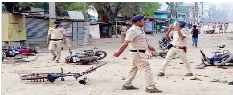
ऐसे असामाजिक तत्व को बक्सा नहीं बख्शा जाएगा। कानून पूरी ताकत के साथ उनसे निपटेगा। यह निश्चित तौर पर एक प्रयास था राज्य की अमन शांति को प्रभावित करने की। जिसको पुलिस प्रशासन ने मिलकर के विफल किया है और हम पूरी तरह कॉन्फिडेंट हैं कि आगे हम ऐसी घटना नहीं होने देंगे नहीं होने देंगे। जिससे कि आम आम सामान्य