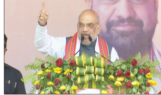
मैं गृह मंत्री, बिहार मेरे हिस्से में- शाह: अमित शाह ने बिहार में हिंसा को लेकर कहा कि सासाराम में अशोक जयंती में जाना था। वहां तो गोली चल रही है, नहीं जा सका। सासाराम की जनता से माफी मांगता हूँ। मैं वहां जरूर जाऊंगा। केंद्रीय गृह मंत्री ने कहा कि मैं गृह मंत्री हूँ, बिहार मेरे हिस्से में है। नीतीश कुमार

शांति नहीं ला सकते हैं। बिहार में शांति हो, इसलिए गवर्नर को फोन किया। इससे ललन जी बुरा मान गए। बिहार में जीतेंगे 40 की 40 सीटें: शाह अमित शाह ने 2024 के लोकसभा चुनाव में बिहार की 40 सीटें जीतने का दावा किया। उन्होंने कहा कि पूरे बिहार में कमल खिलने वाला है। 2024 में फिर से मोदी जी सभी 40 सीटें जीतने जा रहे हैं। शाह ने केंद्र द्वारा किए गए कामों का उल्लेख किया और कहा कि कश्मीर हमारा है। भाजपा ने कश्मीर से धारा 370 हटाई। हमने राम मंदिर बनाया।