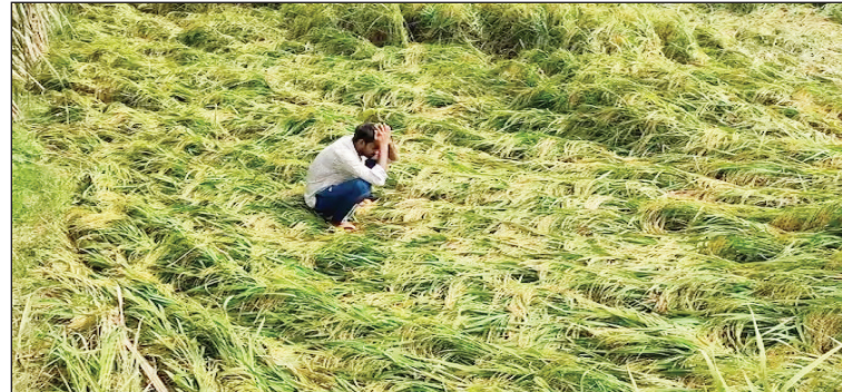
उत्तर प्रदेश में लगभग 5.23 लाख हेक्टेयर गेहूं की फसल खराब होने का अनुमान लगाया गया है। रिकॉर्ड 11.22 करोड़ टन गेहूं उत्पादन का अनुमान: साथ ही, उन्होंने कहा कि पंजाब और हरियाणा में गेहूं की फसल को हुए

नई दिल्ली: बेमौसम बारिश, ओलावृष्टि और तेज हवाओं ने कई राज्यों में परेशानी खड़ी कर दी है। वहीं, मध्य प्रदेश, राजस्थान और उत्तर प्रदेश में 5.23 लाख हेक्टेयर से अधिक गेहूं की फसल को प्रभावित किया है, जिससे किसानों में भारी उपज नुकसान और कटाई की चुनौतियों का डर पैदा हो गया है। तीन राज्यों में गेहूं की फसल को भारी नुकसान: भारत गेहूं के प्रमुख उत्पादकों में से एक है और इस तरह की क्षति वैश्विक स्तर पर लगातार उच्च मुद्रास्फीति और खाद्य सुरक्षा संकट जैसे हालात पैदा कर सकता है। अधिकारियों के अनुसार, खराब मौसम के कारण तीन राज्यों मध्य प्रदेश, राजस्थान और