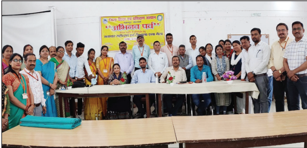
कार्यक्रम में उपस्थित शिक्षक और छात्र