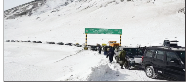
जम्मू-कश्मीर के बीच प्रवेश द्वार के रूप में कार्य करता है। इसे मौसम की कठिन परिस्थितियों के बीच अथक बर्फ निकासी अभियानों के माध्यम से इसको 6 जनवरी तक यातायात के लिए खुला रखा गया था। दर्रा बंद होने के बाद बीआरओ ने प्रयास किये कि जोजिला दर्रा कम से कम समय के लिए बंद हो। पिछले वर्ष यह 73 दिन में और बीते वर्षों के 160-180 दिनों की तुलना में इस वर्ष केवल 68 दिनों के लिए ही अवरुद्ध रहा है।

नई दिल्ली: सीमा सड़क संगठन (बीआरओ) ने गुरुवार को ग्रेटर हिमालयन रेंज पर सामरिक रूप से महत्वपूर्ण जोजिला दर्रा खोल दिया है। 11,650 फीट ऊंचाई पर स्थित जोजिला दर्रा मौसम की कठिन परिस्थितियों के बीच भीषण बर्फबारी के बाद 6 जनवरी को बंद कर दिया गया था। पिछले वर्ष इसे 73 दिनों बाद खोला गया था। इस बार बीआरओ ने पांच दिन पहले ही यातायात के लिए खोल दिया है, जिससे लद्दाख और गुरेज घाटी से संपर्क बहाल हो गया है। जोजिला दर्रा केंद्र शासित प्रदेशों लद्दाख तथा