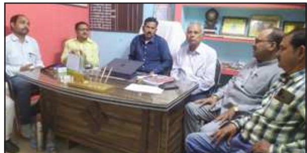
जिला स्तरीय पड़ोस युवा संसद की बैठक में मौजूद पदाधिकारी।

सांसद संगम लाल गुप्ता 17 मार्च को करेंगे शुभारंभ