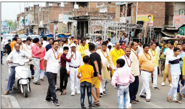
शोभायात्रा में शामिल आर्य समाजी