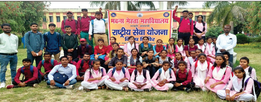
राष्ट्रीय सेवा योजन कार्यक्रम में उपस्थित स्कूली छात्र