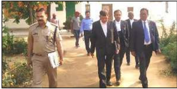
जिला कारागार का निरीक्षण करते अपर जिला जज।

कुल 12 बच्चे हैं जिसमें 08 लड़की व 04 लड़के हैं जिनमें 01 बच्चा