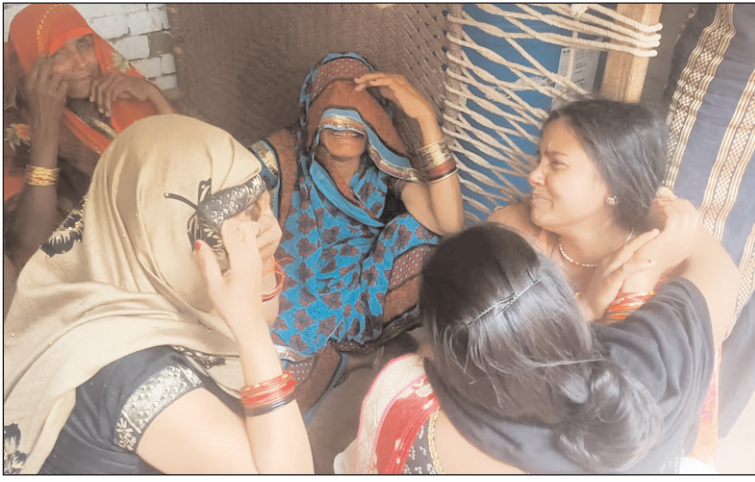
महिला की मौत के बाद रोते बिलखते परिजन