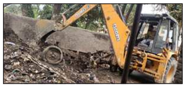
जेसीबी से कुड़ा उठाते नगर पालिका कर्मचारी।

वार्ड में रेल लाइन के किनारे नाले की सफाई गैंग लगाकर तथा