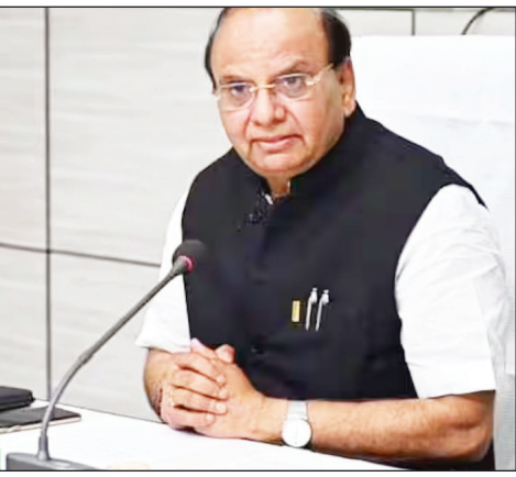
आरोपी नंबर 4 भी हैं। इतना संगीन आरोप होने के बाद भी उसे दिल्ली का एलजी बना दिया गया। सिंह ने कहा कि एलजी कोर्ट की कार्यवाही से भाग रहे हैं। उन्हें पता है कि सजा हो जाएगी। सिंह ने सवाल

नई दिल्ली: दिल्ली के एलजी विनय कुमार सक्सेना पर आम आदमी पार्टी ने गुरुवार को गंभीर आरोप लगाए। आप के राज्यसभा सांसद संजय सिंह ने साबरमती आश्रम से संबंधित 20 साल पुराना वीडियो जारी कर कहा कि इस वीडियो को देख देश के लोगों को शर्म आएगी। राज्यसभा सांसद संजय सिंह ने वीडियो के जरिए एलजी पर आरोप लगाते हुए कहा कि दिल्ली में एक ऐसे व्यक्ति को जिम्मेदारी वाले पद पर बिठा दिया गया है, जो आज से 20 साल पहले साबरमती आश्रम में मेधा पाठकर पर हमला करने वाले हिंसक समूह के सरगना रहे हैं और