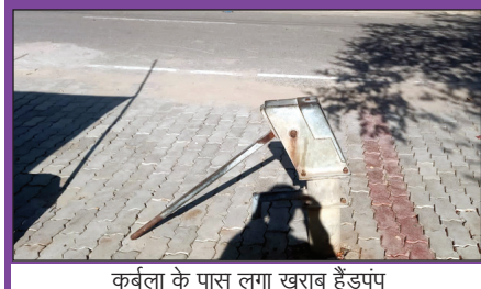
कर्बला के पास लगा खराब हैडपंप

स्तर से भी की शासन से हैडपंप मरम्मत का निर्देश भी दिया गया लेकिन उसके बाद भी शासन के निर्देश की अवहेलना करते हुए हैडपंप की मरम्मत नहीं कराई गई है आखिर नगर पालिका परिषद मंझनपुर के अधिकारियों को इतना पश्चाताप कहां हो सके है सूत्रों की माने तो बीते वर्ष हैडपंप मरम्मत के नाम पर 45 हैडपंप के मरम्मत का बजट अभिलेखों से निकाल लिया गया है लेकिन एक भी हैडपंप की मरम्मत नगरपालिका के अधिकारियों ने नहीं कराई है फर्जी तरीके से हैडपंप की मरम्मत करवाए जाने में लगे नगरपालिका के अधिकारियों के कारनाम पर आला अधिकारी भी लापरवाह बने हुए हैं यदि हैडपंप मरम्मत की जांच आला अधिकारियों ने कराई तो नगरपालिका के अधिशासी अधिकारी की मुखिकल बड़ सकती है लेकिन क्या नगर पालिका के अधिकारियों के भ्रष्टाचार पर जांच करा कर इन्हें आला अधिकारी दंडित करेंगे या किसी दबाव में नगर पालिका के अधिकारियों को मनमानी करने की छूट मिलती रहेगी।