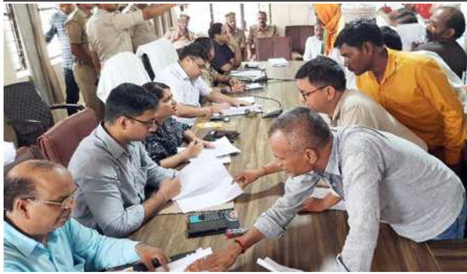
लालगंज में सम्पूर्ण समाधान दिवस में समस्याओं की सुनवाई करते डीएम व एसपी तथा अन्य अफसर।

दो सौ बहतर शिकायतों में सात का हुआ निस्तारण