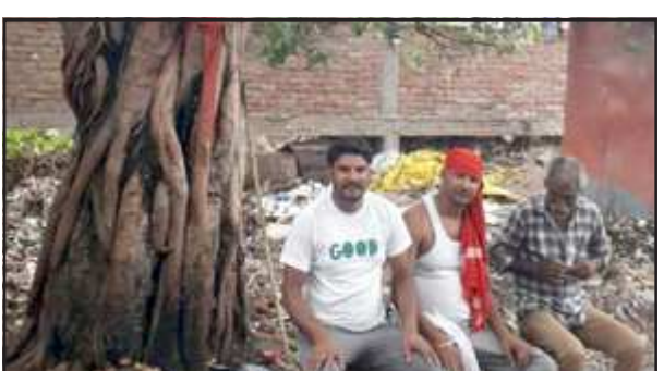
पीपल के पेड़ के नीचे आक्सीजन लेते लोग।

पक्षियों को देव वृक्षों से हमेशा मिलता है आहार