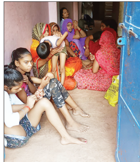
वृद्ध महिला की मौत के बाद रोते बिलखते परिजन

पुलिस को सूचना दी। सूचना पर पहुंची पुलिस ने शव को कब्जे में लेकर पोस्टमार्टम के लिए भेजा और जांच शुरू कर दी है आधी रात को वृद्ध महिला सड़क क्यों क्रास कर रही थी यह जांच का विषय है।