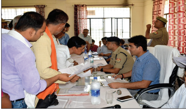
समस्याओं का निस्तारण करते जिलाधिकारी व एसएसपी

समाधान दिवस में कुल 345 शिकायतें प्राप्त हुईं, जिसमें से 27 शिकायतों का मौके पर ही निस्तारण सुनिश्चित किया गया, प्राप्त शिकायतों का एक सप्ताह में गुणवत्तापूर्ण निस्तारण करें सुनिश्चित। जिलाधिकारी