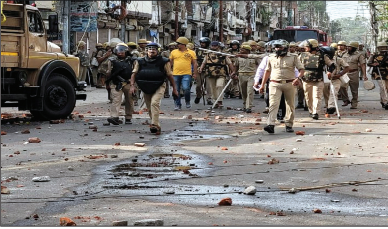
उपद्रव के दौरान गश्त करती पुलिस