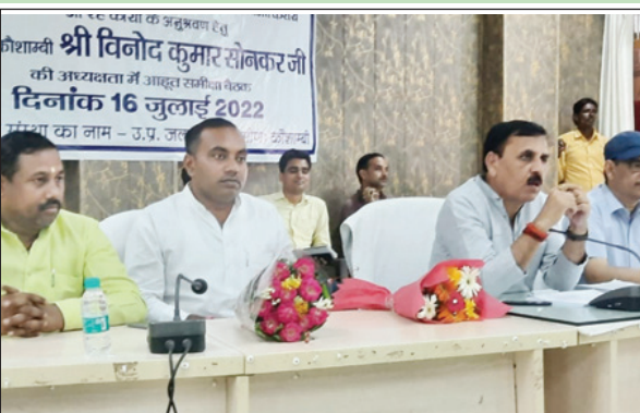
जल योजना की बैठक करते सांसद

समीक्षा के दौरान सांसद ने जे०एम०सी० एवं बाबा कन्स्ट्रक्शन कम्पनी को तेजी से कार्य पूर्ण करने के दिये निर्देश, जल-जीवन मिशन फेज-01 का कार्य 30 सितम्बर 2022, फेज-2 का कार्य सितम्बर 2023 एवं फेज-03 का कार्य मार्च 2024 तक पूर्ण कर सम्बन्धित राजस्व ग्रामों में हर घर तक नल से जल पहुंचा दिया जायेंगा