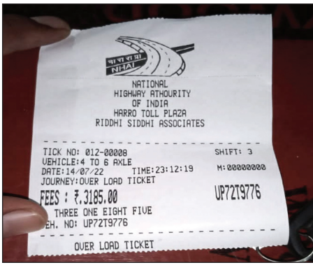
टुक ड्राइवर द्वारा प्रस्तुत हैंड बिल रसीद जिस पर अंकित है ओवरलोड टिकट यह अवैध और अमान्य टिकट है