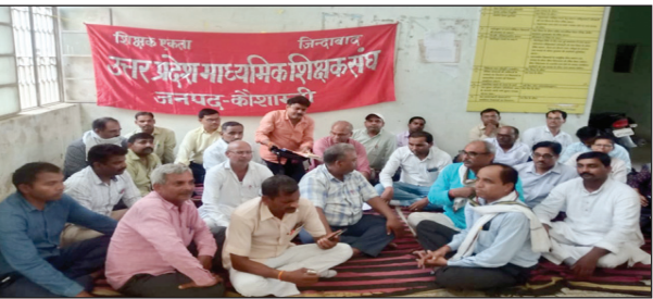
बैठक करते शिक्षक

मिलने सहित आदि समस्यायें आ रही हैं, उन सभी समस्याओं की सूची उन्हें उपलब्ध करा दिया जाय, ताकि उप जिलाधिकारी सहित सम्बन्धित अधिकारियों से समस्या का समाधान कराया जा सके। उन्होंने सभी अधिकारियों से कहा कि जल जीवन मिशन के कार्यों को आपसी समन्वय बनाकर तेजी से पूर्ण करें तथा जो कार्य पिछड़े गये हैं, उन सभी कार्यों को 30 अगस्त तक पूर्ण करते हुए आगे के कार्यों को तेजी से पूर्ण कराया जाय, ताकि निर्धारित समय तक सभी कार्य पूर्ण हो जाय। उन्होंने दोनों कम्पनियों से कहा कि कार्यों को तेजी से पूर्ण कराने के लिए आवश्यकतानुसार मैनापार बढ़ाया जाय। उन्होंने कहा कि हर घर तक नल से जल पहुंचाना पुण्य का कार्य है, इस कार्य को करने में किसी भी स्तर पर लापरवाही न किया जाय। इस अवसर पर मुख्य विकास अधिकारी डॉ० रवि किशोर त्रिवेदी सहित अन्य सम्बन्धित अधिकारीगण उपस्थित रहे।