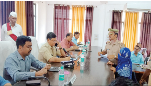
समाधान दिवस में फरियादियों की समस्या सुनते डीएम एसपी

सम्पूर्ण समाधान दिवस में कुल 47 शिकायतें प्राप्त हुईं, जिसमें से 07 शिकायतों का मौके पर किया गया निस्तारण