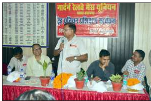
सभा को सम्बोधित करते कर्मचारी नेता।

नार्दन रेलवे में मेंस यूनियन की सभा में मांगो के सम्बन्ध में जुटे कर्मचारी