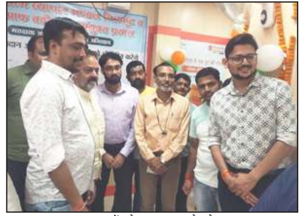
मतदाताओं को जागरूक करते लोग।

जो कहा वो किया। जो नहीं कहा, वो भी किया। मोदी ने सबका साथ, सबका विकास, सबका विश्वास, सबका प्रयास के मंत्र को आत्मसात कर गांव, गरीब, शोषित, वंचित, पीड़ित, युवा, किसान, महिलाओं को मजबूती देने का काम किया। एक समय उत्तर प्रदेश बीमारू राज्य कहलाता था। आज मोदी-योगी की अगुवाई में उत्तर प्रदेश देश के अग्रणी राज्यों में खड़ा हो गया है। डिफेंस इंडस्ट्रियल कॉरिडोर में चित्रकूट को भी शामिल किया है। यहां आने से चित्रकूट- बांदा की तस्वीर बदल जाएगी। यहां के नौजवानों को रोजगार के नए अवसर मिलेंगे।