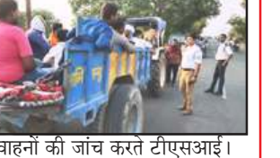
वाहनों की जांच करते टीएसआई।