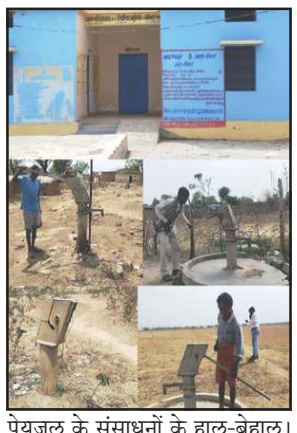
पेयजल के संसाधनों के हाल-बेहाल।

आदिवासियों ने कई बार अधिकारियों व जनप्रतिनिधियों को चेताया, कहीं कोई सुनवाई नहीं हुई। अब इन आदिवासियों ने