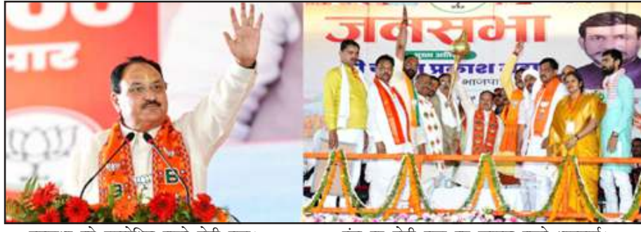
जनसभा को सम्बोधित करते जेपी नड्डा।

गुरुवार को भाजपा राष्ट्रीय अध्यक्ष जेपी नड्डा ने बेडीपुलिया में हुई चुनावी जनसभा में कहा कि ये सब परिवारवाद की पार्टियां हैं। आजकल राहुल गांधी संविधान की किताब लेकर घूम रहे हैं। उन्होंने राहुल से कहा कि कभी किताब पढ़ भी लिया करें। कांग्रेस दलित, पिछड़े, आदिवासियों के आरक्षण पर डाका डालना चाहती है। धर्म के नाम पर