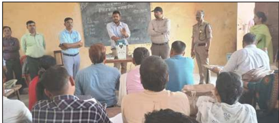
मतदान प्रशिक्षण का निरीक्षण करते डीएम-एसपी।

गुरुवार को डीएम-एसपी ने प्रशिक्षण कक्षा में मतदान बाबत मास्टर ट्रेनर्स के दिव्ये जा रहे प्रशिक्षण को बारीकी से समझा। जिला निर्वाचन अधिकारी ने निरीक्षण करते हुए मास्टर ट्रेनर्स से कहा कि अच्छी तरह से मतदान कर्मियों को प्रशिक्षण दें, ताकि मतदान के दिन कोई समस्या न हो। जिलाधिकारी ने मतदान कर्मियों से कहा कि लोकसभा चुनाव सफुल संपन्न कराने में आप