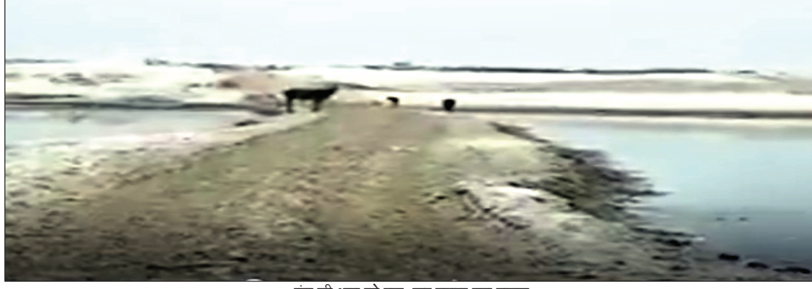
गंगा की धारा को पाट कर बनाया गया सड़क

अफसरों की नाक के नीचे हो रहा अवैध खनन प्रयागराज में संगम छतनाग होते हुए गंगा वाराणसी की ओर चली जाती है। संगम से आगे छतनाग क्षेत्र पड़ता है, जिसके पास छिबैया सुमेरपुर गांव है, जहां गंगा दो धाराओं में बंट जाती है। यहां बेखौफ खनन माफिया ने गंगा की एक धारा को पाटकर उसपर सड़क बना डाली है। यहां से रोज कई ट्रैक्टर बालू का अवैध खनन हो रहा है। ताजुब की बात तो यह है कि