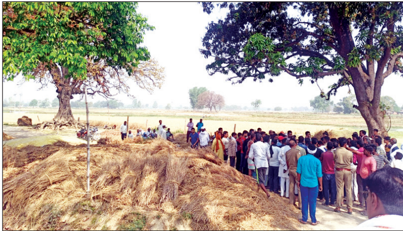
शव दफनाने के विवाद का निस्तारण करते राजस्व और पुलिस अधिकारी

कौशाम्बी। पश्चिम शरीरा थाना क्षेत्र के नागरेहा कला गांव की एक विवाहिता की बीमारी के चलते मौत हो गई विवाहिता का मायका इसी थाना क्षेत्र के मिरदाहन के पुरवा गांव में है विवाहिता के शव को दफन करने के लिए मिरदाहन का पुरवा गांव लोग लेकर पहुंचे और शव को दफन करने की तैयारी करने लगे जिस जमीन पर शव को दफन करने की तैयारी की जा रही थी वह जमीन मिरदाहन के पुरवा गांव के सीमावर्ती गांव रकसौली की सरकारी भूमि थी जिस पर रकसौली के लोगों ने दूसरे गांव में शव दफन करने का विरोध शुरू किया मामले की जानकारी मिलते ही स्थानीय थाना पुलिस ग्राम प्रधान नायब तहसीलदार लेखपाल सहित ग्रामीणों की मौके पर भीड़ लग गई काफी देर तक शव दफनाने को लेकर हाई वोल्टेज ड्रामा चलता रहा