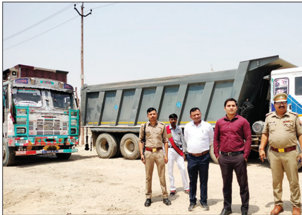
ओवरलोड वाहनों पर कार्रवाई करते अधिकारी

कौशाम्बी। मंझनपुर एसडीएम प्रखर उत्तम के नेतृत्व में खनन अधिकारी और टीम ने ओवरलोड बालू गिट्टी लदे 11 वाहनों को पकड़ कर मंझनपुर पुलिस को सौंप दिया है ताबड़तोड़ कार्यवाही से माफियाओं में हड़कंप मचा हुआ है मंझनपुर के ओसा और समदा रोड के बीच जांच के दौरान ओवरलोड लगे बालू और गिट्टी के वाहनों को पकड़ लिया गया है उप जिला अधिकारी ने बताया कि अवैध वाहनों पर लगातार जांच अभियान जारी रहेगा पकड़े गये सभी ओवरलोड वाहन चित्रकूट जनपद के बताए जा रहे हैं अवैध वाहनों के विरुद्ध कार्रवाई जांच में एसडीएम के नेतृत्व में खनन