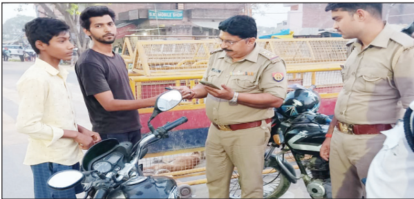
वाहनों की चेकिंग करते मंझनपुर कोतवाल