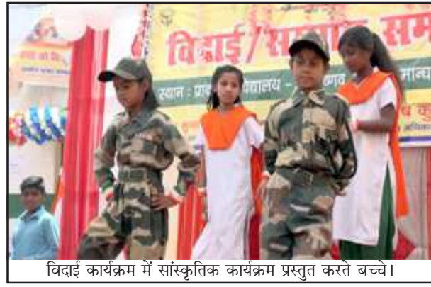
विदाई कार्यक्रम में सांस्कृतिक कार्यक्रम प्रस्तुत करते बच्चे।