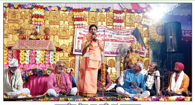
सम्मानित किए गए कवि एवं कलाकार