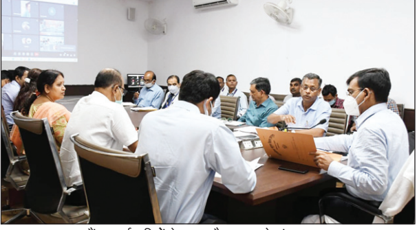
बैंक कर्मचारियों के साथ बैठक करते मंडलायुक्त

कोई कोताही की जा रही है तो उसकी जानकारी उनके समक्ष प्रस्तुत करने को भी कहा है ताकि संबंधित बैंक के चेयरमैन को चिट्ठी लिख कर अधिकारी के खिलाफ कार्यवाही सुनिश्चित कराई जा सके। उन्होंने सभी बैंकों को 25 अप्रैल तक सभी लंबित आवेदनों का निस्तारण करने के भी निर्देश दिए हैं। आवेदनों संबंधित समस्याओं को सुनते हुए उन्होंने 18 अप्रैल से 5 दिन का विशेष अभियान चलाकर सभी आवेदकों को संबंधित ब्रांच में बुलाने