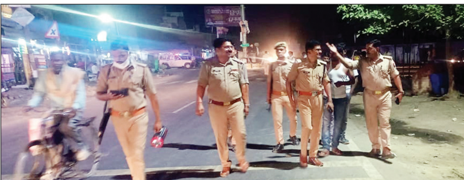
पुलिस टीम के साथ पैदल गस्त करते अपर पुलिस अधीक्षक