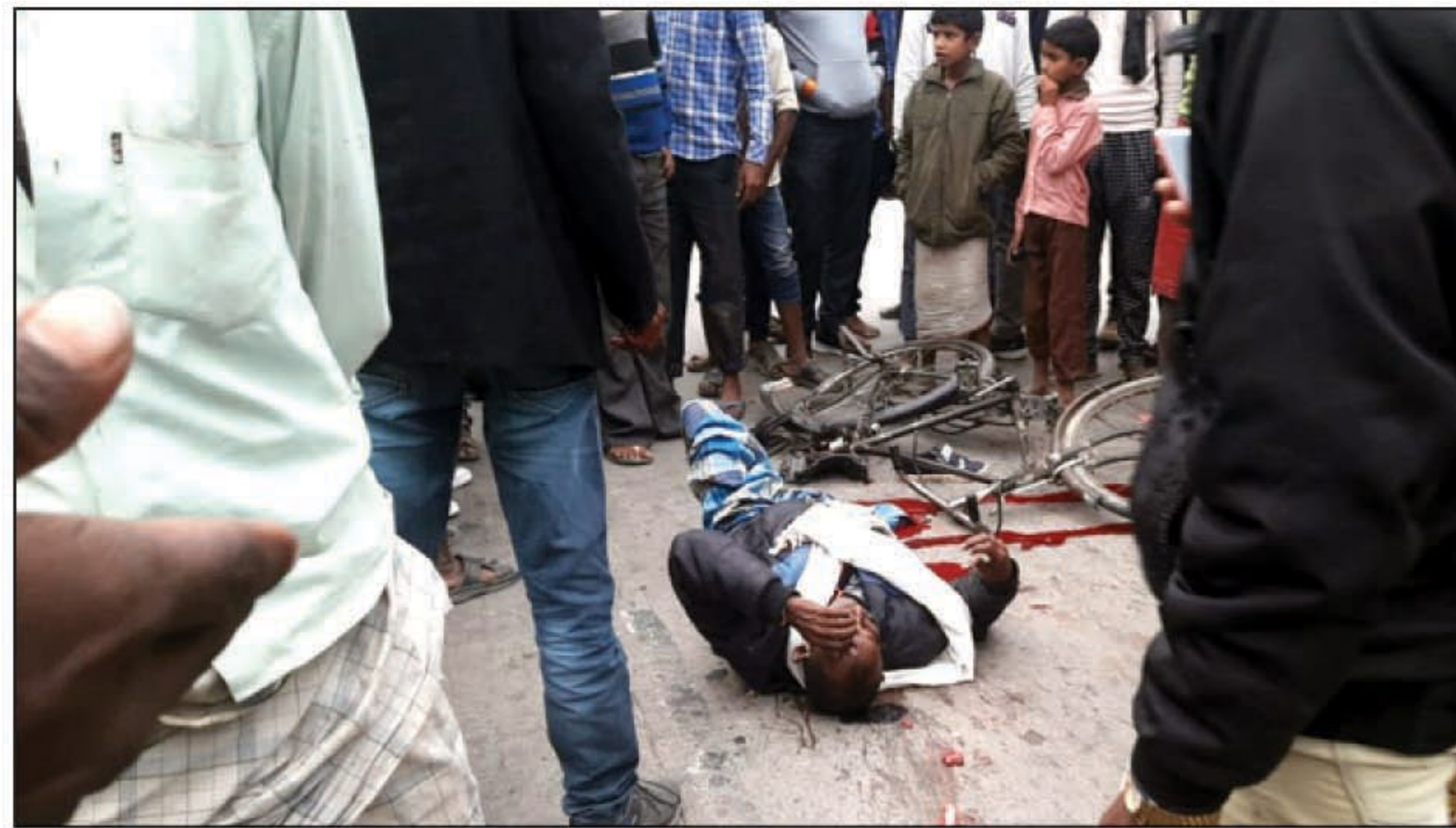
घटनास्थल पर लगी ग्रामीणों की भीड़ और मौके पर पड़ा घायल