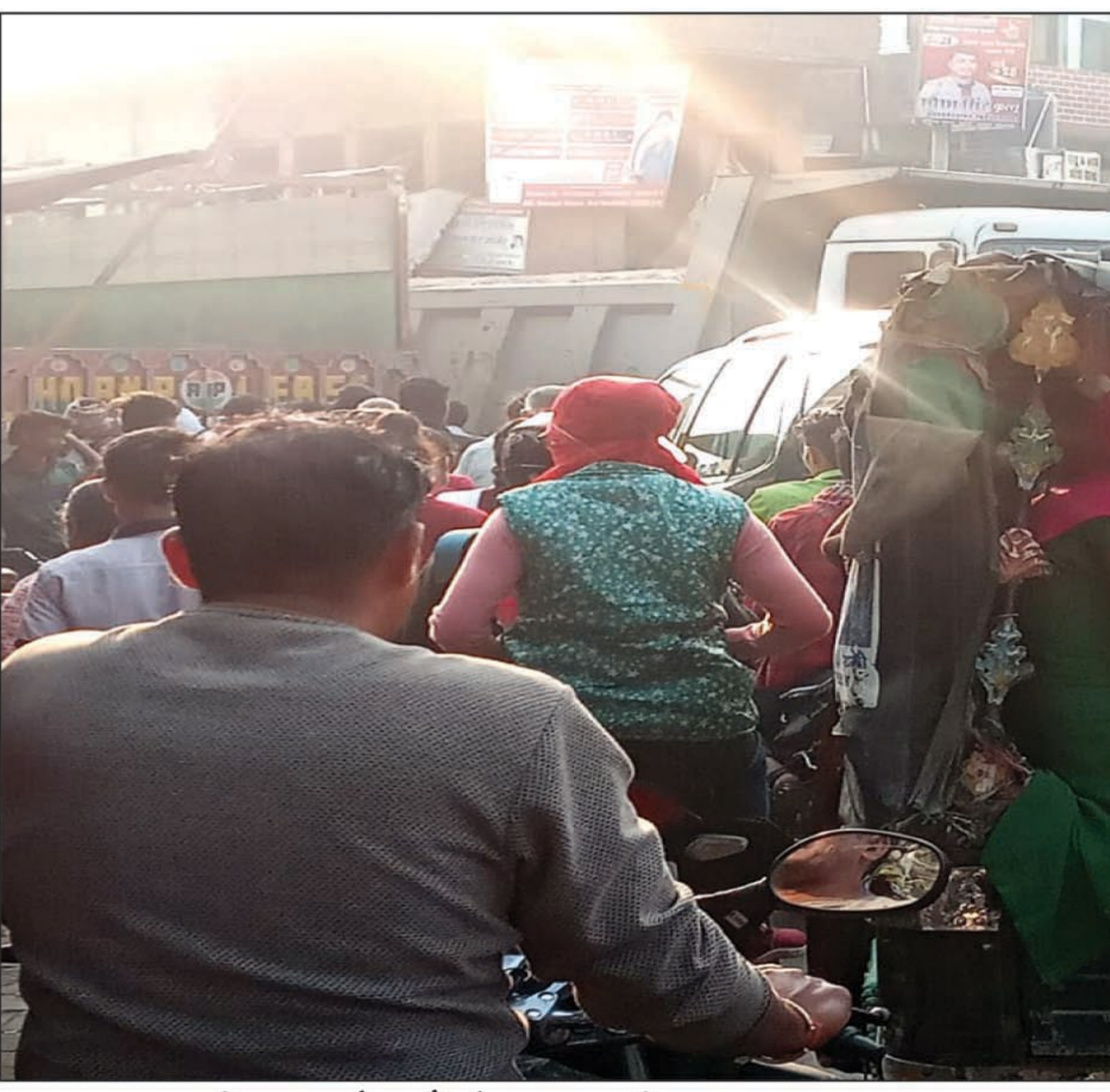
तिल्हापुर मोड़ चौराहे पर लगा भीषण जाम का दृश्य

पिपरी थाना पुलिस जाम हटाने का नहीं करती प्रयास घंटों जाम में फंसते हैं सैकड़ों लोग