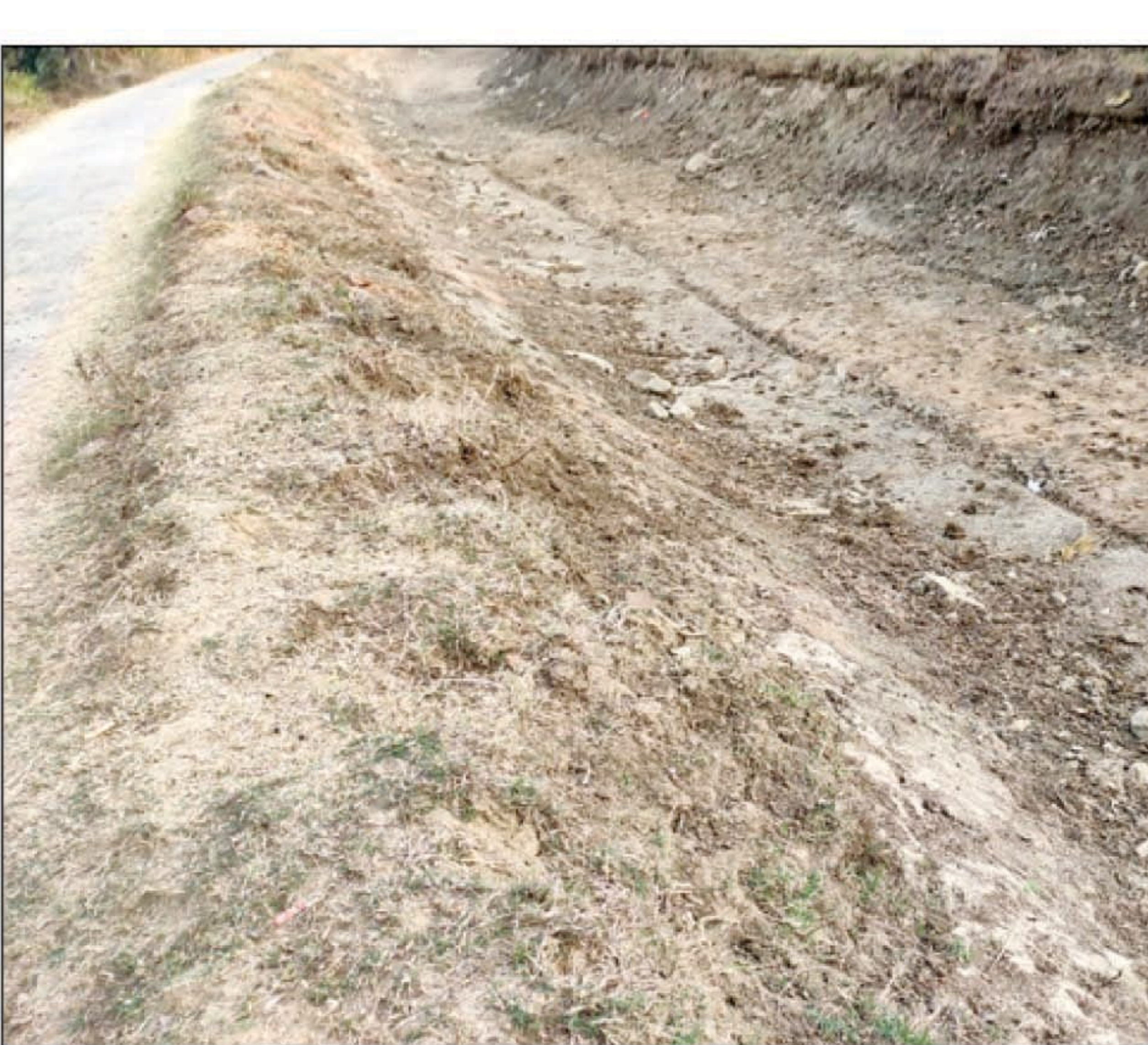
पानी न छोड़े जाने से सूखी नहर