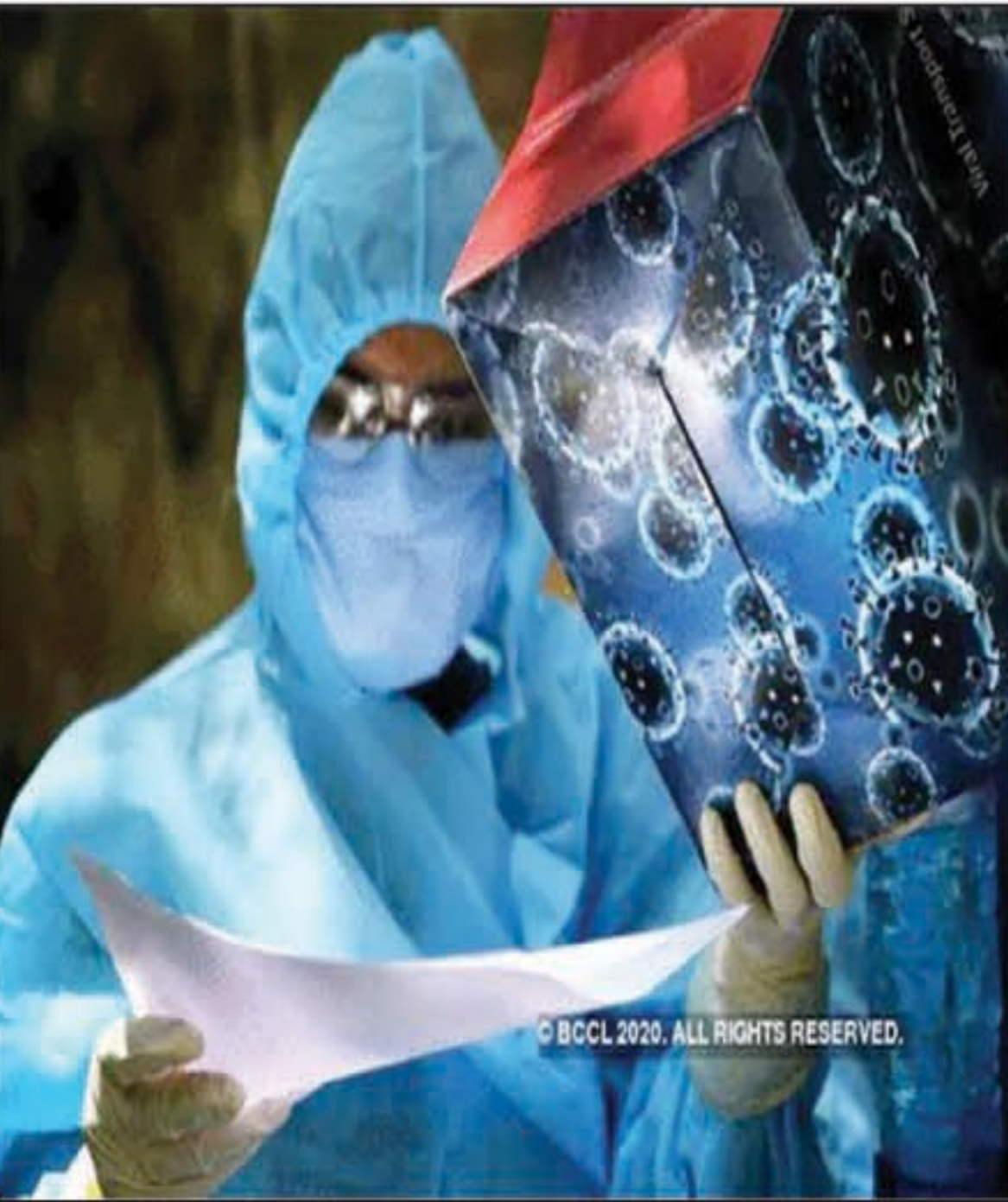
सहाय ने कोरोना नियमों का पालन करने की सलाह दी है।

प्रयागराज। कोरोना संक्रमण की रफ्तार में उतार-चढ़ाव जारी है। 24 घंटे के अंतराल में 44 नए संक्रमित मिले हैं, जबकि एक मरीज की मौत संक्रमण के चलते हुई। फिलहाल मौत का आंकड़ा 353 पर है। उधर 22 लोगों में कोरोना की हराया। इनमें से 8 को अलग-अलग अस्पताल से डिस्चार्ज किए गए, जबकि 14 का होम आइसोलेशन पूरा हुआ। स्वास्थ्य विभाग का जांच अभियान जारी रहा। 6009 लोगों का सैंपल विभाग की ओर से लिया गया। नोडल अफसर डॉ. ऋषि