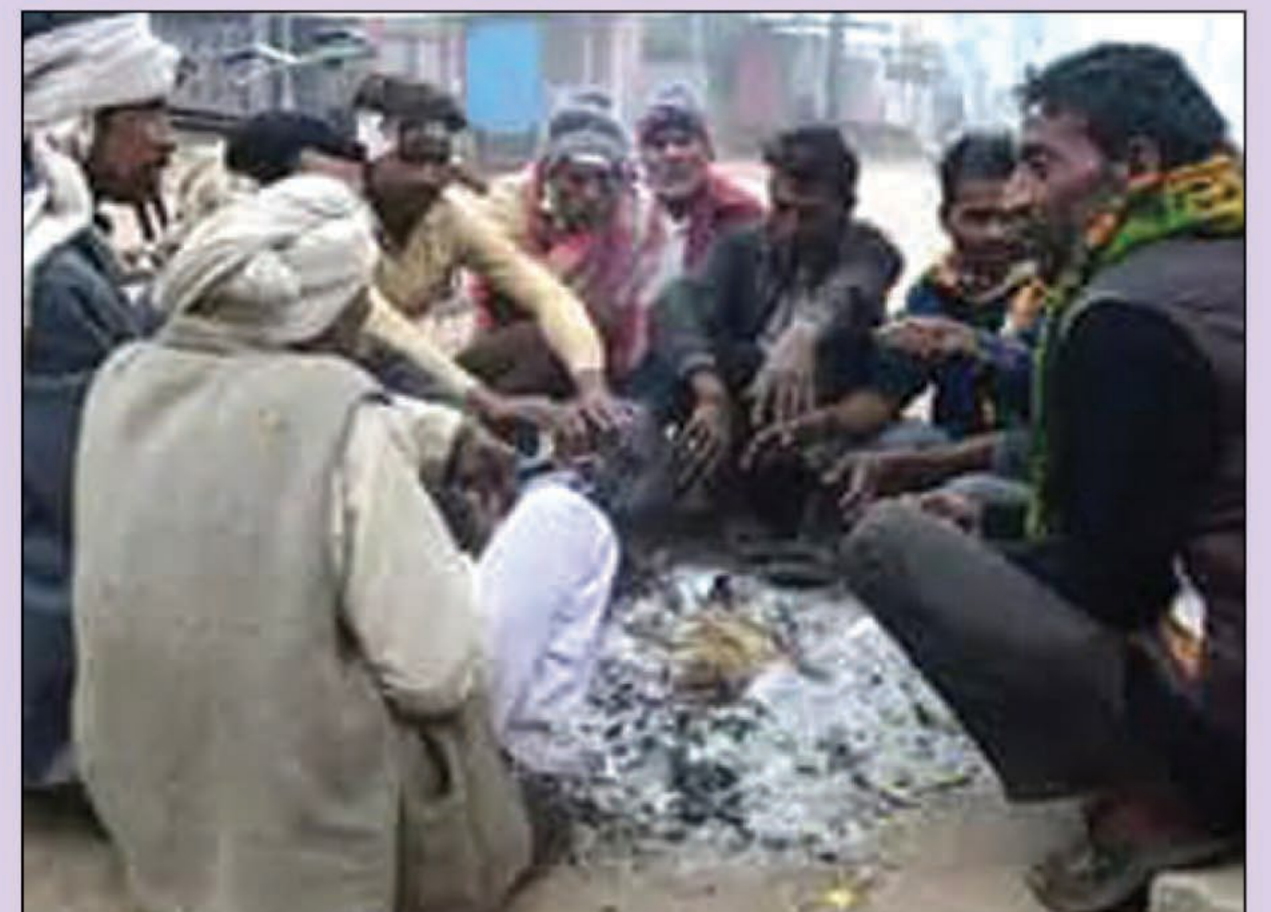
ठंड से डुबरे अलाव का सहारा लेते लोग

प्रतापगढ़। पहाड़ों से आ रही बर्फीली हवा से ठंड बढ़ रही है। इससे रात व दिन के तापमान में गिरावट दर्ज की गई। ठंड से बचने के लिए लोग अलाव का सहारा लेते दिखे। कोहरे की वजह से यातायात भी प्रभावित हुआ है। ब्योते दो दिन से पुरवा हवा बनी हुई है। मौजूदा समय में पहाड़ों पर बर्फबारी हो रही है। इसी वजह से मैदानी इलाके में आ रही सर्द हवा ठंड को तेजी से बढ़ा रही है। कोहरा भी ठंड में मुश्किल बढ़ रहा है। गुरुवार शाम से ही घना कोहरा देखने को मिला। शुक्रवार सुबह नौ बजे तक घना कोहरा छाया रहा। इससे यातायात प्रभावित हुआ। हाईवे पर गुजरने वाले वाहन रंगते रहे। भारी व हल्के वाहन घने कोहरे की वजह से