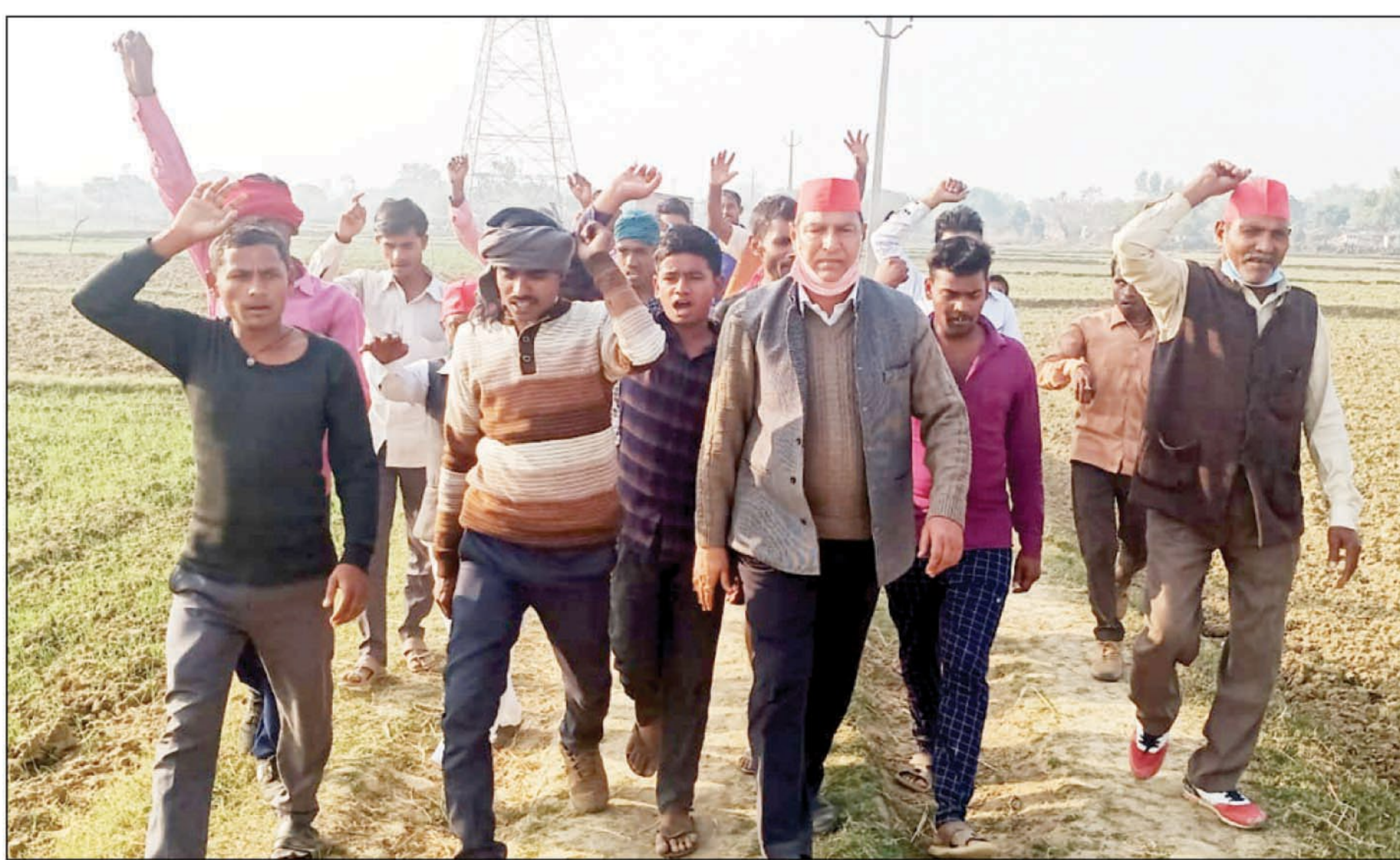
भाजपा सरकार की कृषि नीतियों के विरोध में किसान सम्मान पद यात्रा निकालते सपा नेता व अन्य