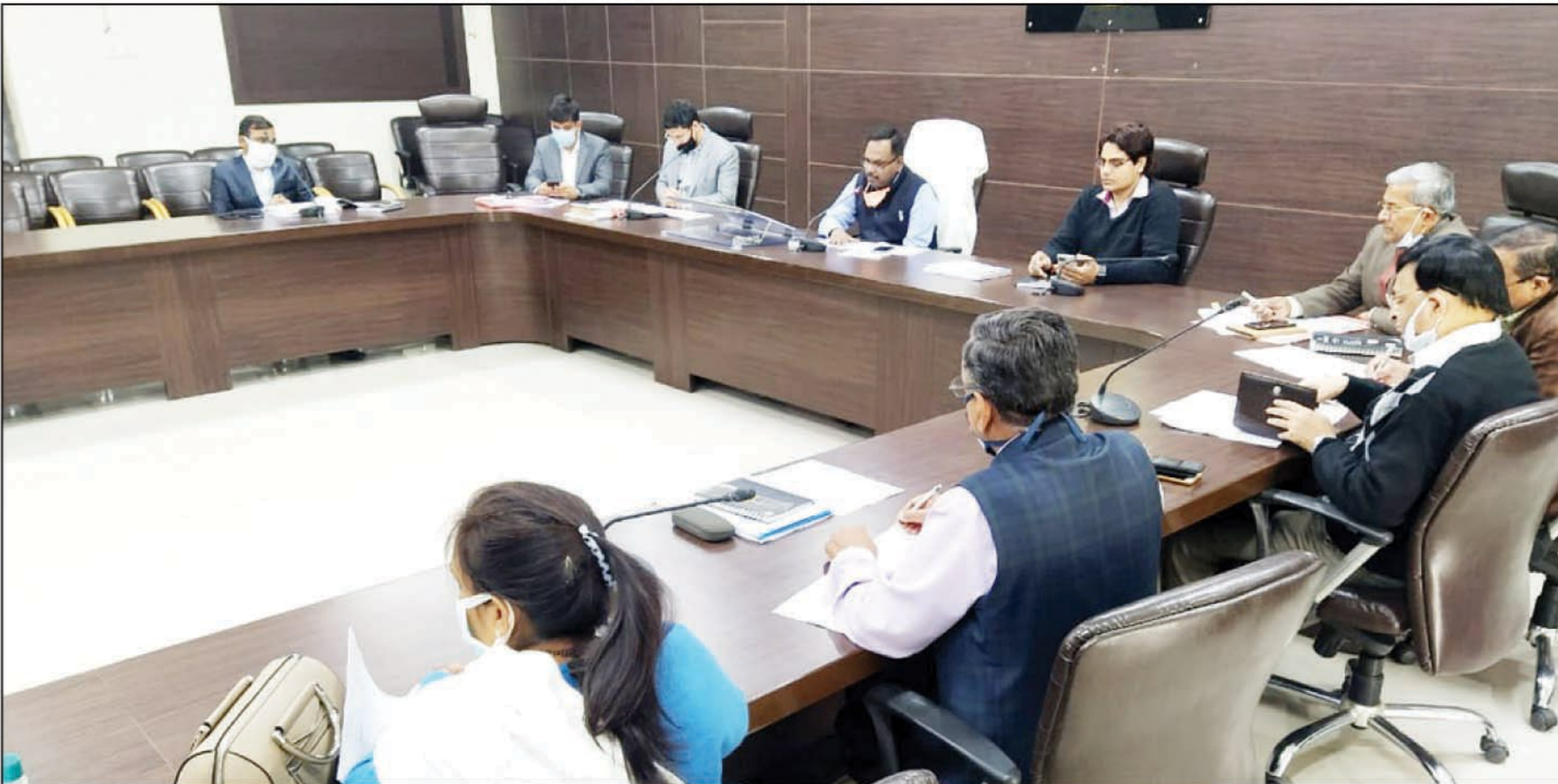
राजस्व वसूली एवं विकास कार्यों की प्रगति के सम्बन्ध में समीक्षा करते मण्डलायुक्त

मण्डलायुक्त ने सांसद निधि से कराये जाने वाले कार्यों के प्रगति की समीक्षा करते हुए स्वीकृत कार्यों को शत-प्रतिशत रूप से पूर्ण किये जाने का निर्देश सम्बन्धित विभागों के अधिकारियों को दिया है। सिंचाई विभाग के कार्यों की समीक्षा करते हुए मण्डलायुक्त ने नहरों के शिफ्ट सफाई का कार्य दिसम्बर माह तक अनिवार्य रूप से पूर्ण किये जाने एवं कराये गये कार्यों का टीम बनाकर अनिवार्य रूप से सत्यापित कराये जाने का निर्देश