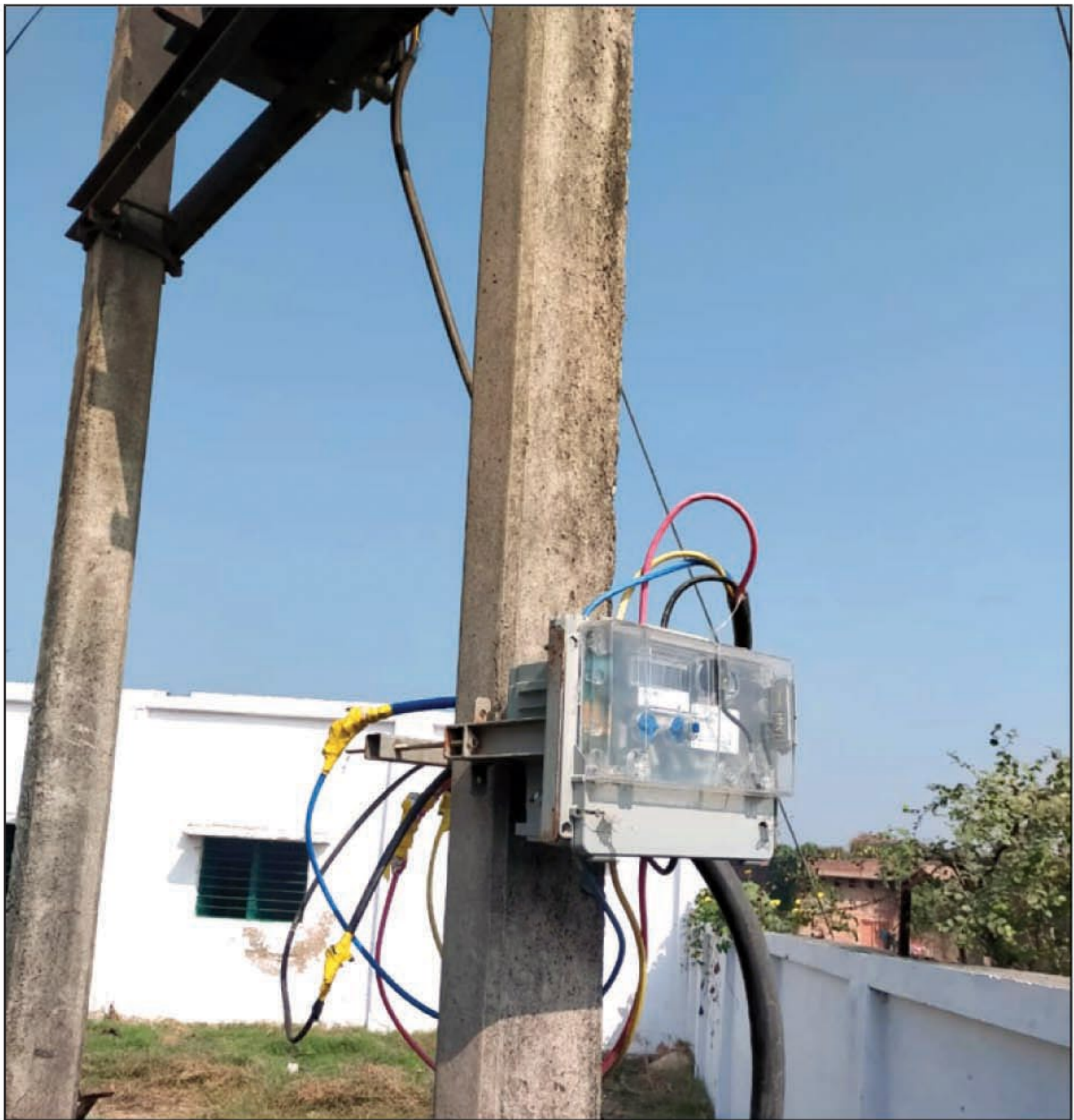
विद्यालय परिसर में लगे ट्रांसफार्मर का दृश्य

सिराथू विधायक के साथ साथ अधिकारियों ने भी ट्रांसफार्मर हटवाने को कहा लेकिन विद्युत अधिकारियों के टेंगे पर है माननीयों का आदेश