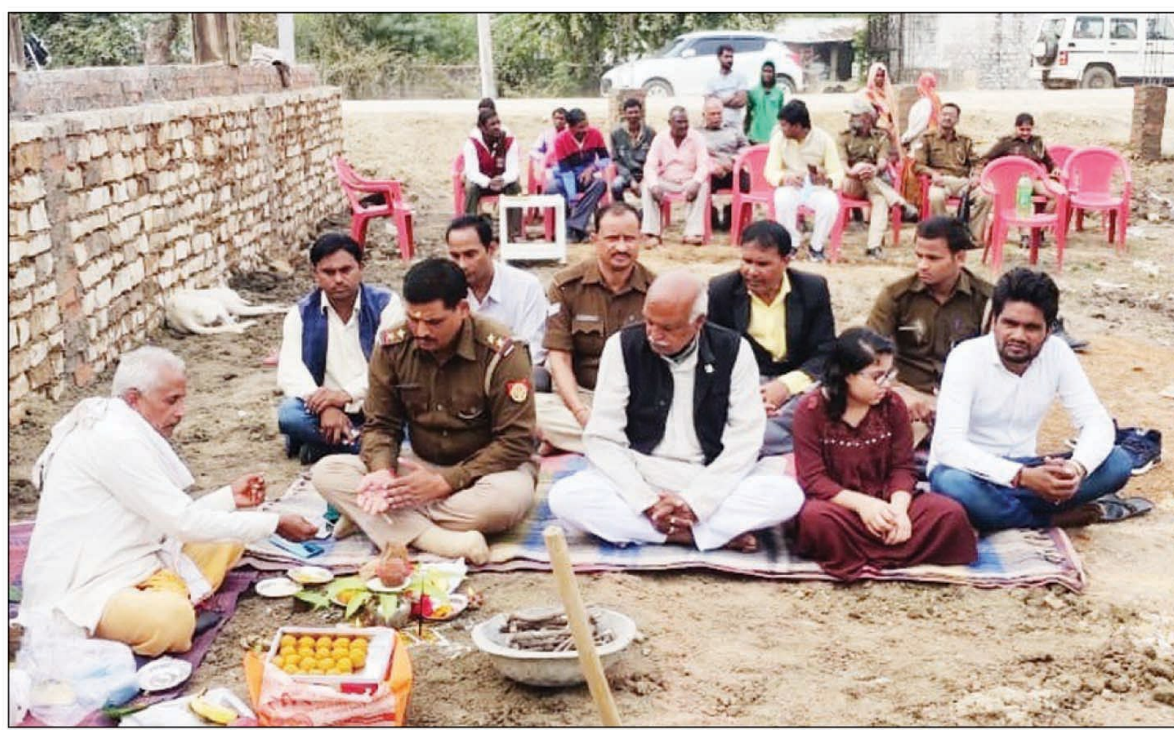
नवीन पुलिस चौकी के लिए भूमिपूजन करते थानाध्यक्ष शंकरगढ़ व उपस्थित क्षेत्रीय गणमान्य लोग