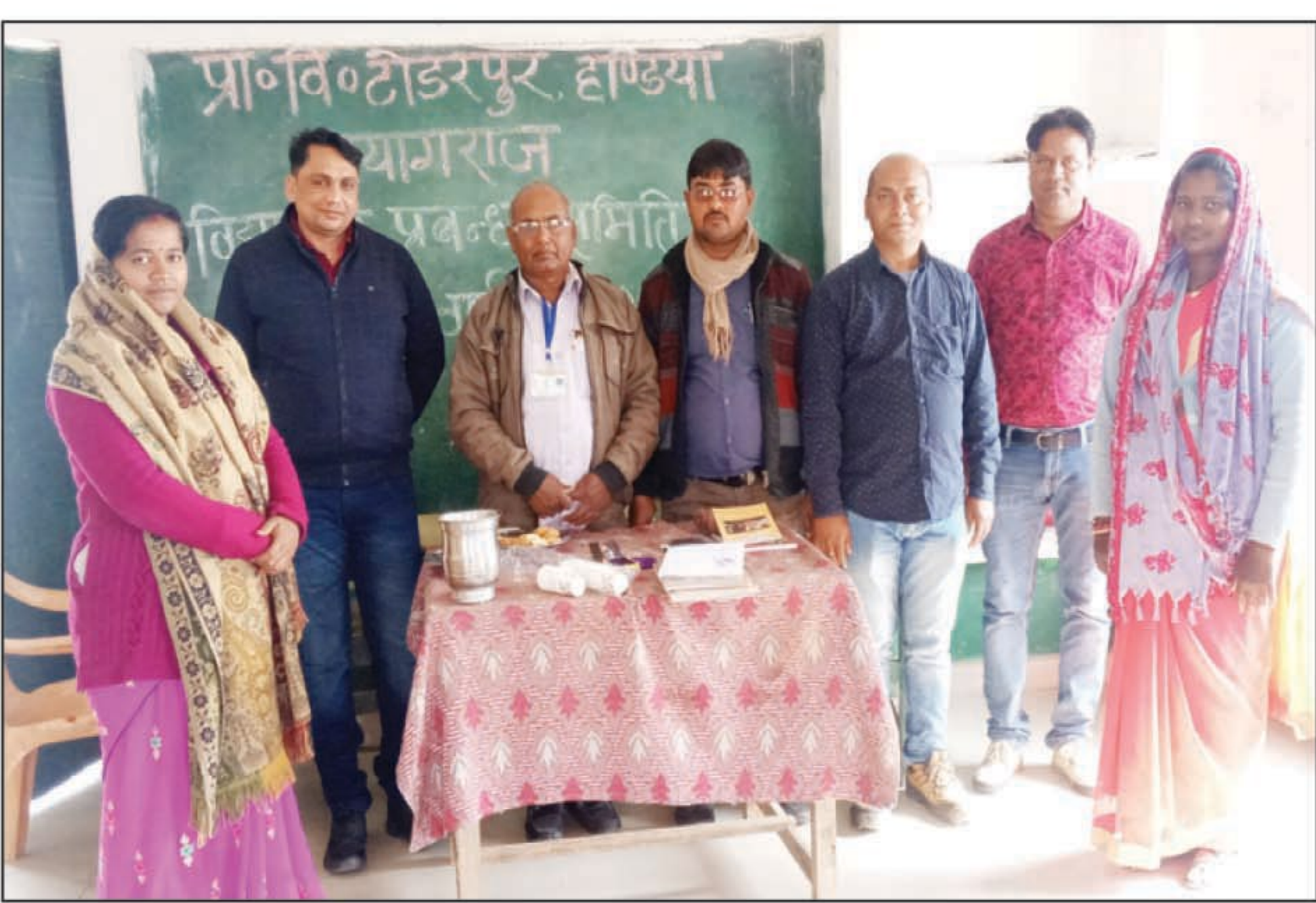
बैठक में शामिल ग्राम प्रधान व विद्यालय स्टाफ

अभिभावकों द्वारा प्राथमिक विद्यालय टोडरपुर हडिया प्रयागराज में विद्यालय प्रबंध समिति का चयन किया गया।