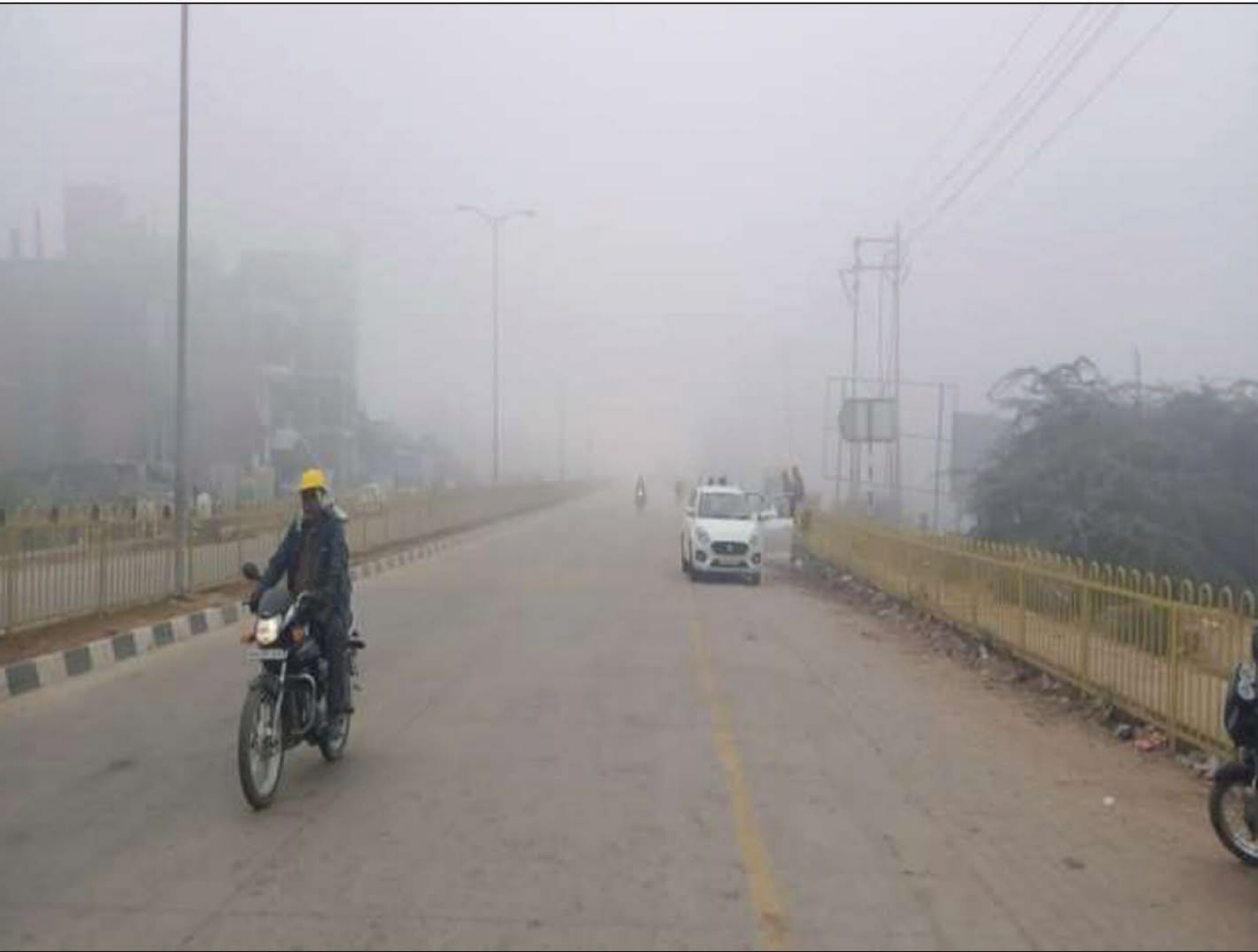
छाया रहा। दोपहर में भी सूर्य की किरणें धूमिल ही रहीं।

हल्का कोहरा तो दिसंबर माह की शुरुआत से ही नजर आने लगा था। हालांकि पिछले दो दिनों से प्रयागराज के साथ ही प्रतापगढ़ और कौशांबी में भी घना कोहरा छाने लगा है। गुरुवार की रात और शुक्रवार की सुबह भी कोहरा देर तक वातावरण में