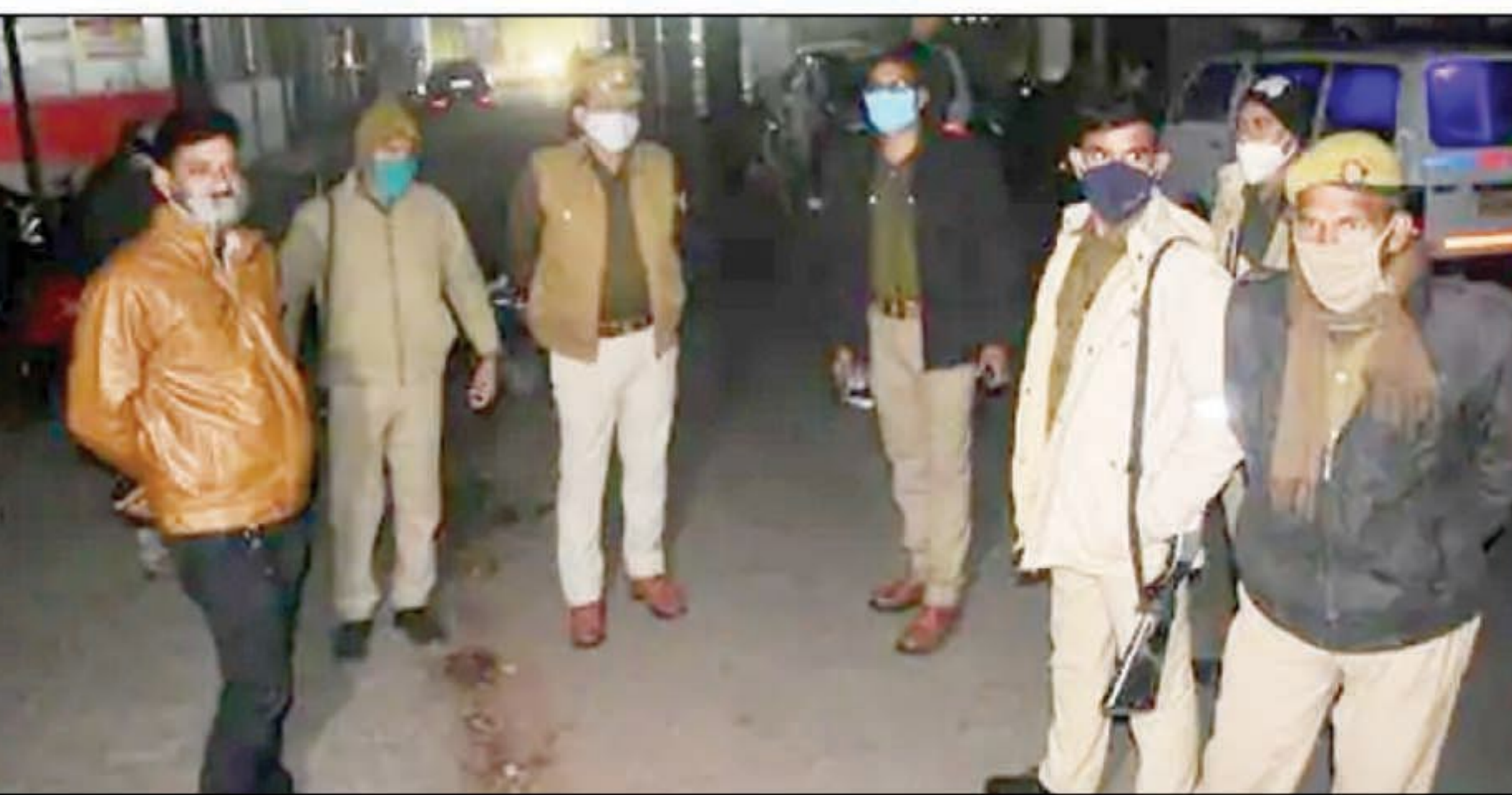
घटना के बाद पहुंची पुलिस जांच पड़ताल करती हुई