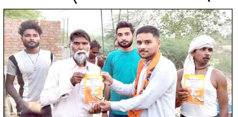
पत्रक बांटते अभावपिप कार्यकर्ता।