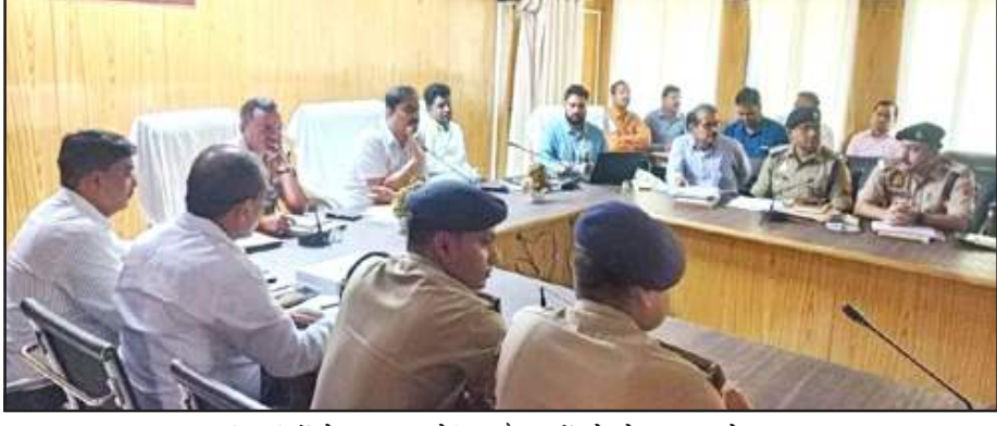
अधिकारियों के साथ आयोजित बैठक में बोलते सामान्य प्रेक्षक।