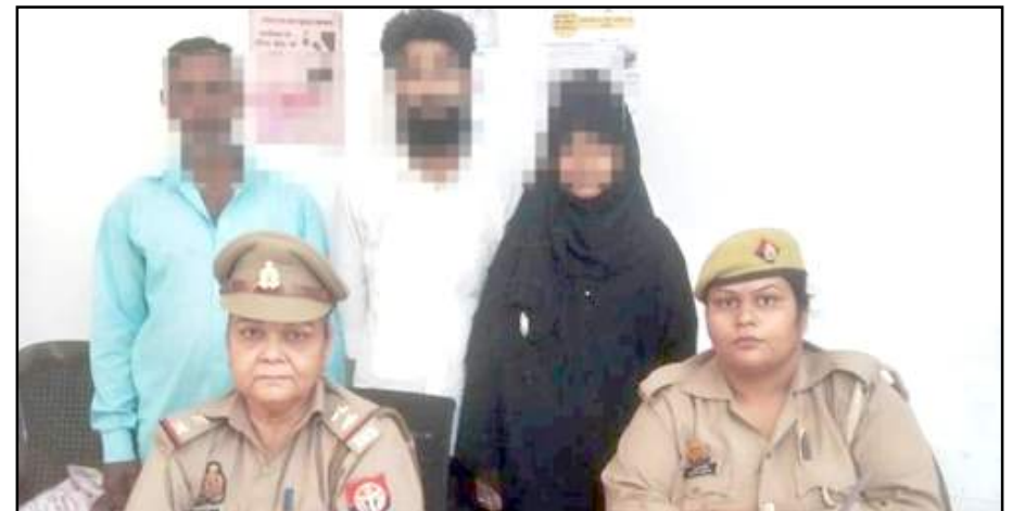
विवाद सुलझाती पुलिस।