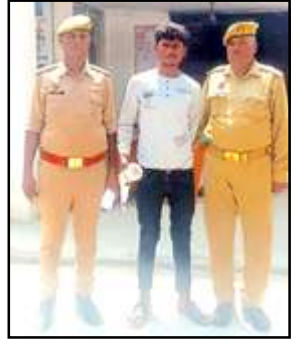
पुलिस गिरफ्त में चोर।