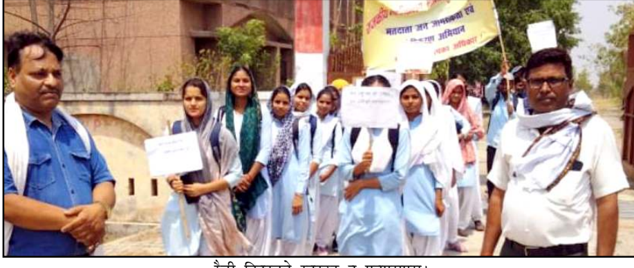
रैली निकालते स्काउट व एनएसएस।

मंगलवार को राजकीय महाविद्यालय मानिकपुर वें एनएसएस ने भी रैली में शामिल होकर मानिकपुर के मतदाताओं को मतदान करने को जागरूक किया। ये रैली मानिकपुर के विभिन्न मार्गों से गुजरती हुई तहसील परिसर में समाप्त हुई। रैली में पचास