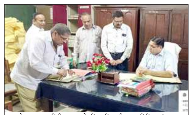
कोषागार का निरीक्षण करते जिलाधिकारी डा0 नितिन बंसल।

प्रतापगढ़। वित्तीय वर्ष की समाप्ति के उपरान्त जिलाधिकारी डा0 नितिन बंसल द्वारा कोषागार के डबल लॉक का गहन निरीक्षण किया गया। निरीक्षण के दौरान जिलाधिकारी द्वारा डबल लॉक में अवशेष स्टाम्पों या कोर्ट फीस एवं नोटरी टिकट, बीमा टिकट, रेवेन्यू टिकट, बहुमूल्य वस्तुएं, पैडलॉक, अप्रयुक्त चेक, आर0ओ0 बुक तथा 385 रसीद का डबल लॉक में अभिरक्षित रजिस्टर से विधिवत मिलान किया गया जो कि सही पाया गया तथा डबल लॉक में ऐसे