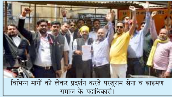
विभिन्न मांगों को लेकर प्रदर्शन करते परशुराम सेना व ब्राह्मण समाज के पदाधिकारी।