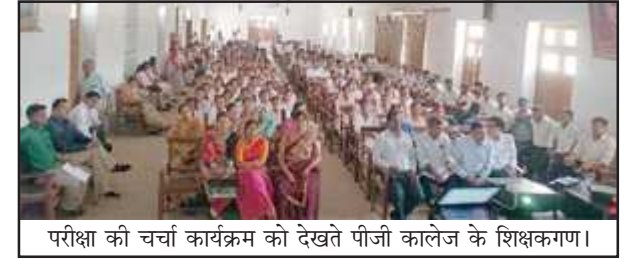
परीक्षा की चर्चा कार्यक्रम को देखते पीजी कालेज के शिक्षकगण।

अवकाश घोषित किये गये हैं, परन्तु भगवान परशुराम की जयंती पर अवकाश घोषित नहीं है। परशुराम सेना व ब्राह्मण समाज के लोगों ने मांग की है कि हम सबके आराध्य परशुराम जयंती पर तत्काल प्रभाव से अवकाश घोषित किया जाए अन्यथा परशुराम सेना आंदोलन के लिये बाध्य होगी, जिसकी जिम्मेदारी