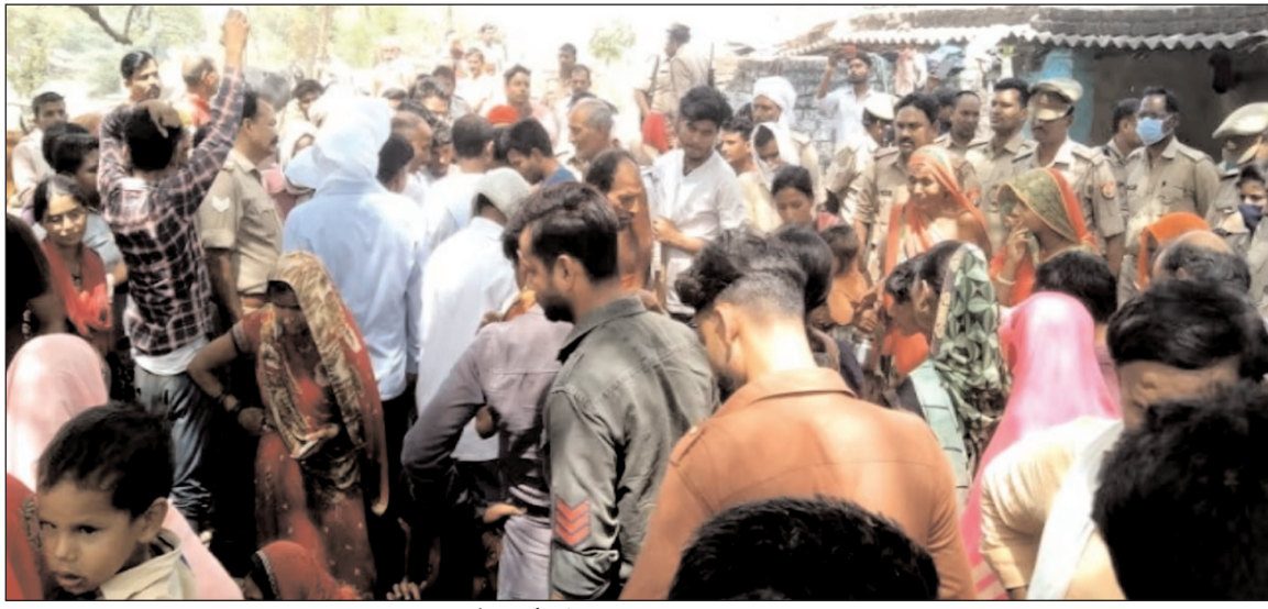
बच्चों की मौत के बाद घटनास्थल पर जमा भीड़