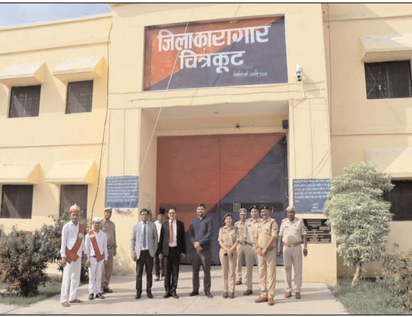
से कहा कि कैदियों को भोजन, नाश्ता प्रतिदिन मेन्सू के अनुसार दिया जाए। कोई अव्यवस्था नहीं होनी चाहिए। जिलाधिकारी ने महिला बैरक के निरीक्षण में जेल अधीक्षक से कहा