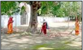
ईदगाह में साफ-सफाई करते नगर पालिका के सफाई कर्मचारी।