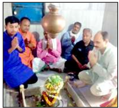
भयहरणाथ धाम में पूजा पाठ करते पदाधिकारी।

संख्या में पधारते हैं। जिस पर काफी चर्चा के बाद सर्व समिति से तय हुआ कि सोमवार को अध्यक्ष व मुख्य मन्दिर के पुजारी सुव्यवस्था को ध्यान में रखकर नियमानुसार बारादरी में पूजन कार्य सम्पन्न करायेगें वहीं मंगलवार को व्यापक जनहित में निजी अनुष्ठान पुरातया प्रतिबन्धित रहेंगे। वहीं तय हुआ कि मेला व मन्दिर क्षेत्र में किसी भी प्रकार के निजी, व्यवसायिक व राजनैतिक बैनर व अन्य प्रचार सामग्री नहीं लगेगें। बैनर, गेट आदि का निर्माण