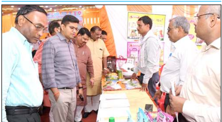
कृषि मेला देखते डीएम के साथ अतिथि।

को बचाने को सीडीओ अना गौवंशों को गौशाला में संरक्षित करा रहे हैं। कृषि विभाग की योजनाओं का लाभ पहले आयें पहले पायें से लें।