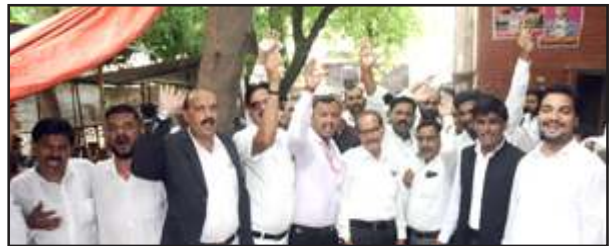
रजिस्ट्री आफिस के बाहर एसडीएम के विरुद्ध नारेबाजी करते अधिवक्ता

प्रतापगढ़। आखिरकार एसडीएम सदर उदयभान सिंह आज नाराज अधिवक्ताओं के घेरे में आ ही गये। उनके द्वारा दो दिन पहले अधिवक्ताओं के साथ की गई कथित बदसलूकी के विरोध में आज अधिवक्ताओं ने रजिस्ट्री आफिस में एसडीएम सदर को घेर लिया और लगभग आधे घंटे तक उन्हें रजिस्ट्री आफिस में रोक रखा और आफिस के बाहर अधिवक्ता एसडीएम सदर के विरुद्ध नारेबाजी करते रहे।