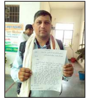
तालाब में अतिक्रमण की शिकायत करने आया ग्रामीण।