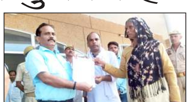
शराब दुकान हटाने को जापन सौंपते ग्रामीण।