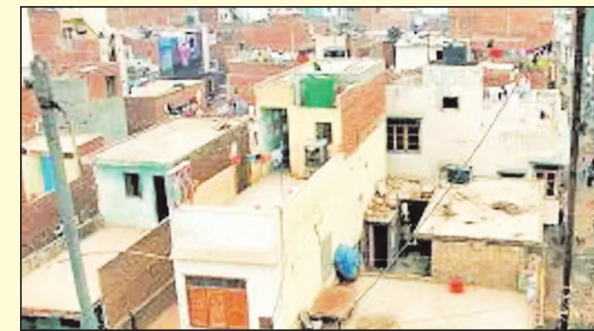
पीएम-उदय के तहत मालिकाना हक के लिए 16 जुलाई 2024

केंद्र सरकार ने गुरुवार को बताया कि प्रधानमंत्री-अनुसूचित कॉलोनी दिल्ली आवास अधिकार योजना (पीएम-उदय) के तहत दिल्ली में अब तक 23,811 लोगों को संपत्तियों का मालिकाना हक मिला है। आवास एवं शहरी मामलों के राज्य मंत्री तोखन साहू ने गुरुवार को लोकसभा में एक प्रश्न के लिखित उत्तर में बताया कि दिल्ली विकास प्राधिकरण (डीडीए) को