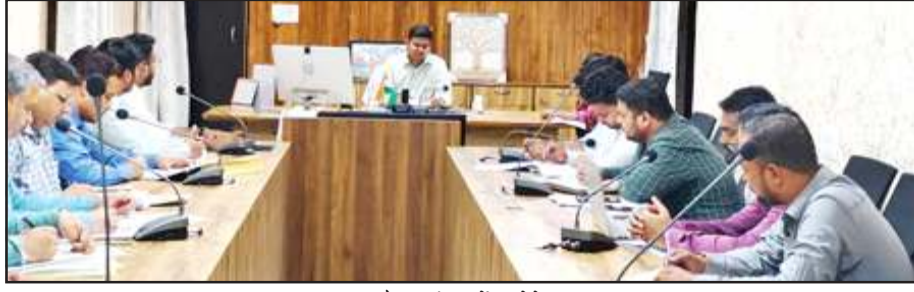
समीक्षा बैठक में निर्देश देते डीएम।

बुधवार को देर शाम कैम्प कार्यालय में जिलाधिकारी ने समीक्षा बैठक में कार्यदाई संस्था व टीपीआई को निर्देश दिये कि सहायक अभियंता व कनिष्ठ अभियंता को जोन में बांटेकर कार्य कराये, ताकि कार्य में