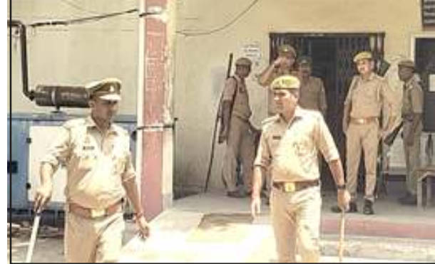
निरीक्षण कर करते एसडीएम पट्टी व सीओ।

साथ ही उन्होंने यहां पर काम करने वाले कर्मचारियों के संदर्भ में भी रजिस्ट्रार से जानकारी ली। उन्होंने यहां पर प्रतिदिन होने वाले बैनामा एवं एक माह में कुल किए गए बैनामा अनुबंध के संदर्भ में भी