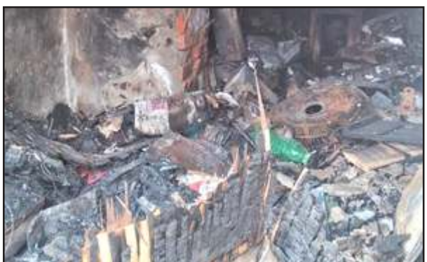
शार्ट सर्किट से जलकर राख हुआ दुकान का सामान।