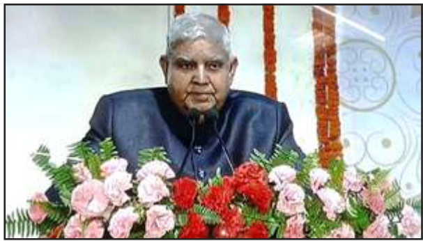
मंच से बोलते उपराष्ट्रपति जगदीप धनखड़।

मऊ/चित्रकूट। देश के उपराष्ट्रपति जगदीप धनखड़ शनिवार को धर्मनगरी चित्रकूट पहुंचे। उपराष्ट्रपति ने कहा कि चारों तरफ अशांति और व्यक्ति के जीवन में तरह-तरह की दिक्कतों हैं। भारत देश में इन सब दिक्कतों को दूर करने को ऋषि परम्परा ही समाधान है। शनिवार को देश के उपराष्ट्रपति जगदीप धनखड़ का स्वागत पुष्पगुच्छ भेंटकर मंत्र की राज्यमंत्री प्रतिमा बागरी ने स्वागत किया। चित्रकूट