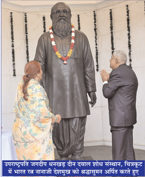
उपराष्ट्रपति जगदीप धनखड़ दीन दयाल शोध संस्थान, चित्रकूट में भारत रत्न नानाजी देशमुख को श्रद्धासुमन अर्पित करते हुए

नगर संस्करण प्रयागराज रविवार 08 सितम्बर 2024 विश्व निर्माण एवं मानव विकास को द्रुतगति प्रदान करने हेतु क्रियायोग आश्रम एवं अनुसंधान आश्रम की अनुपम भेंट