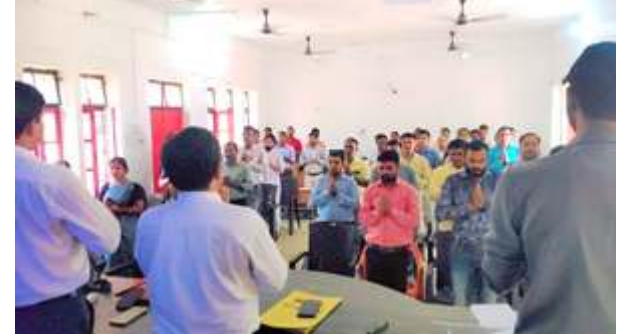
प्रशिक्षण में बोलते बीईओ।

ने बताया कि सभी प्रतिभागी शिक्षक शिक्षकों को निपुण भारत