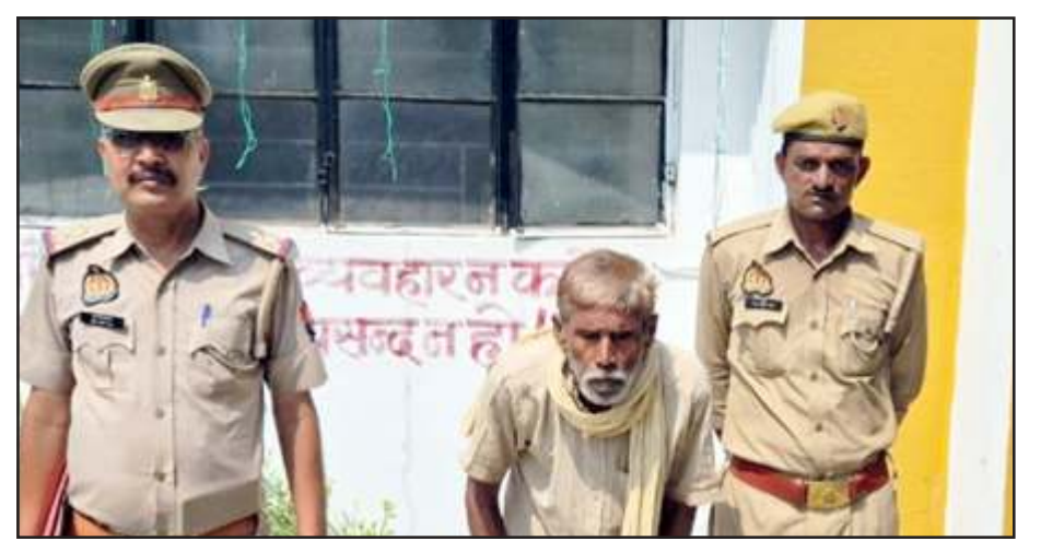
पुलिस गिरफ्त में नामजद हत्यारोपी।