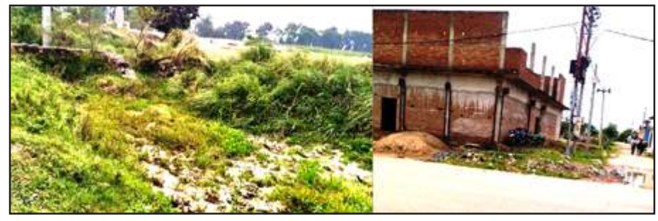
बन्द पड़ी नहर व पटरी पर बना मकान।

राजापुर/चित्रकूट। राजापुर तहसील के खटवारा-भदेवा नहर सालों से ठप है। खटवारा से मझगांव माइनर से किसानों को सिंचाई सुविधा मिलती थी। माइनर में कई दबंग भू-माफियाओं ने नहर व नहर पटरी पर अवैध कब्जे कर लिये हैं। बड़े-बड़े भवन बना लिये हैं। नहर का नामोनिशान मिटा दिया है। शनिवार को नहर व नहर पटरी पर दबंग भू-माफियाओं के अवैध कब्जे का खुलासा हुआ। बताया गया कि क्षेत्र के कई गांवों में किसान सिंचाई समस्या से परेशान हैं। ग्रामीणों ने कहा कि नहर को