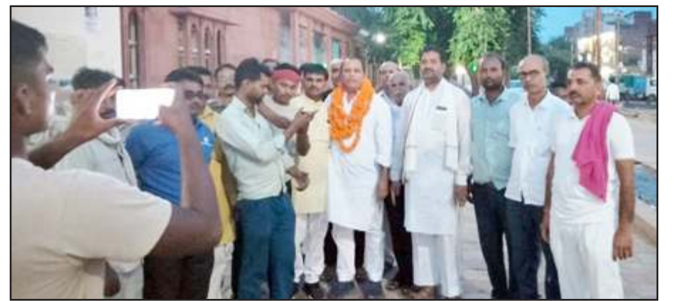
कांग्रेस राष्ट्रीय सचिव का स्वागत करते कांग्रेसी।