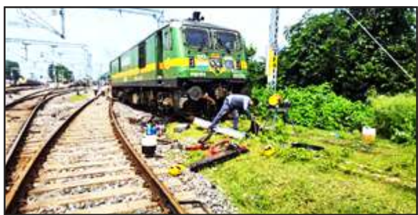
पटरी से उतरा इंजन।

मानिकपुर/चित्रकूट। मानिकपुर जंक्शन पर बड़ा रेल हादसा हो-होते टल गया। कानपुर से प्रयागराज जा रही मालगाड़ी का इलेक्ट्रिक इंजन मानिकपुर के आउटर पर पटरी बदलते समय अचानक पटरी से उतर गया। ये घटना शनिवार को सवेरे नौ बजे हुई। घटना होते ही रेल महकमे में हड़कंप मच गया। घटना के तुरंत बाद उच्चाधिकारी मौके पर पहुंचे। स्थिति नियंत्रित करने के प्रयास किये। घटना पर अभी तक अधिकारिक बयान जारी नहीं हुआ। राहत की बात ये है कि घटना में कोई जनहानि नहीं हुई।