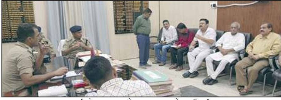
एसपी से मुलाकात करते व्यापार मण्डल के पदाधिकारी।

मिलने का समय लिया। जिसके उपरांत पुलिस अधीक्षक को अवगत कराया कि सराफा व्यवसायियों सहित अन्य बड़े व्यवसायियों की हत्या और लूट की वारदात हो चुकी है और इस तरह की घटना की पुनरावृत्ति न हो, इस बात से पुलिस अधीक्षक ने कहा कि जिले में सुरक्षा व्यवस्था