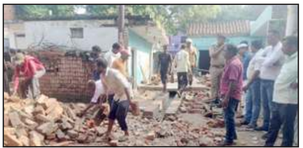
अतिक्रमण को हटाने नगर पालिका के कर्मचारी।