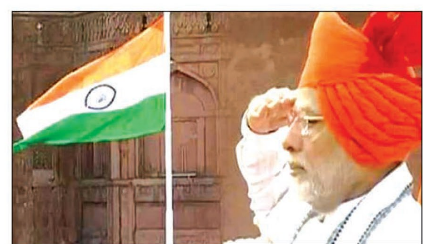
मई 2014 में सत्ता संभालने वाले मोदी जब 2024 में अपना दूसरा कार्यकाल पूरा करने तक 10 बार लाल किले पर तिरंगा लहराने का सौभाग्य हासिल कर मनमोहन सिंह के साथ संयुक्त रूप से तीसरे नंबर पर आ जाएंगे। 15 अगस्त 1947 को लालकिले पर तिरंगा लहराते हुए भारत

आजादी के बाद से अब तक स्वतंत्रता दिवस के मौके पर तिरंगा लहराने वाले प्रधानमंत्रियों की दिलचस्प दास्तान में पीएम बने तमाम नेताओं को कम या अधिक यह सौभाग्य हासिल हुआ है, लेकिन चंद्रशेखर और गुलजारी लाल नंदा दो ऐसे प्रधानमंत्री भी हुए, जिन्हें लाल किले पर तिरंगा लहराने का मौका ही नहीं मिल पाया। नरेंद्र मोदी 15 अगस्त को जब सातवीं बार तिरंगा लहराएंगे तो वे अटल बिहारी वाजपेयी के प्रधानमंत्री के रूप में छह बार लाल किले पर तिरंगा फहराने के रिकॉर्ड को पीछे छोड़ देंगे। पंडित नेहरू ने 17 बार लगातार लाल किले पर तिरंगा लहराया