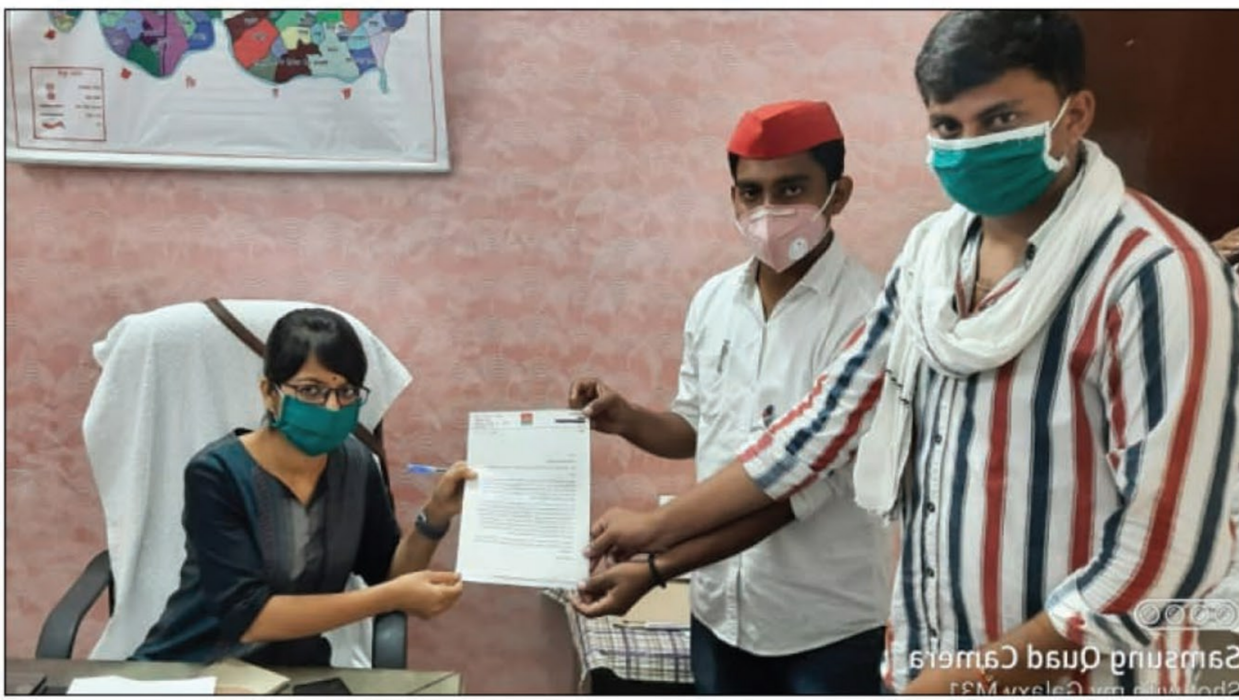
मुंगरी टोल प्लाजा पर अवैध वसूली को लेकर एसडीएम को ज्ञापन सौंपते सपा नेता

करछना। प्रयागराज-मिर्जापुर राजमार्ग संख्या 76 पर मुंगरी गांव के समीप स्थित टोलप्लाजा पर जबरन व गुंडई के बल पर अवैध वसूली को लेकर तीन महीनों से चर्चा का विषय बना हुआ है। जिसमें दर्जनों मारपीट की घटनाएं घटित हो गयी उसके बावजूद भी प्रशासन द्वारा कोई ठोस कदम नहीं उठाया गया है। अक्सर मानक से अधिक वसूली होने का विरोध करने पर कई ट्रक ड्राइवर पीट चुके हैं और टोलकर्मियों के खिलाफ मुकदमें भी दर्ज किये गये हैं। इसके बावजूद भी मुंगरी टोलप्लाजा पर अवैध ढंग से गुंडागर्जी के साथ वाहन चालकों के साथ वसूली निरन्तर जारी है। चार दिन पूर्व ट्रक चालक व मालिक को अवैध वसूली