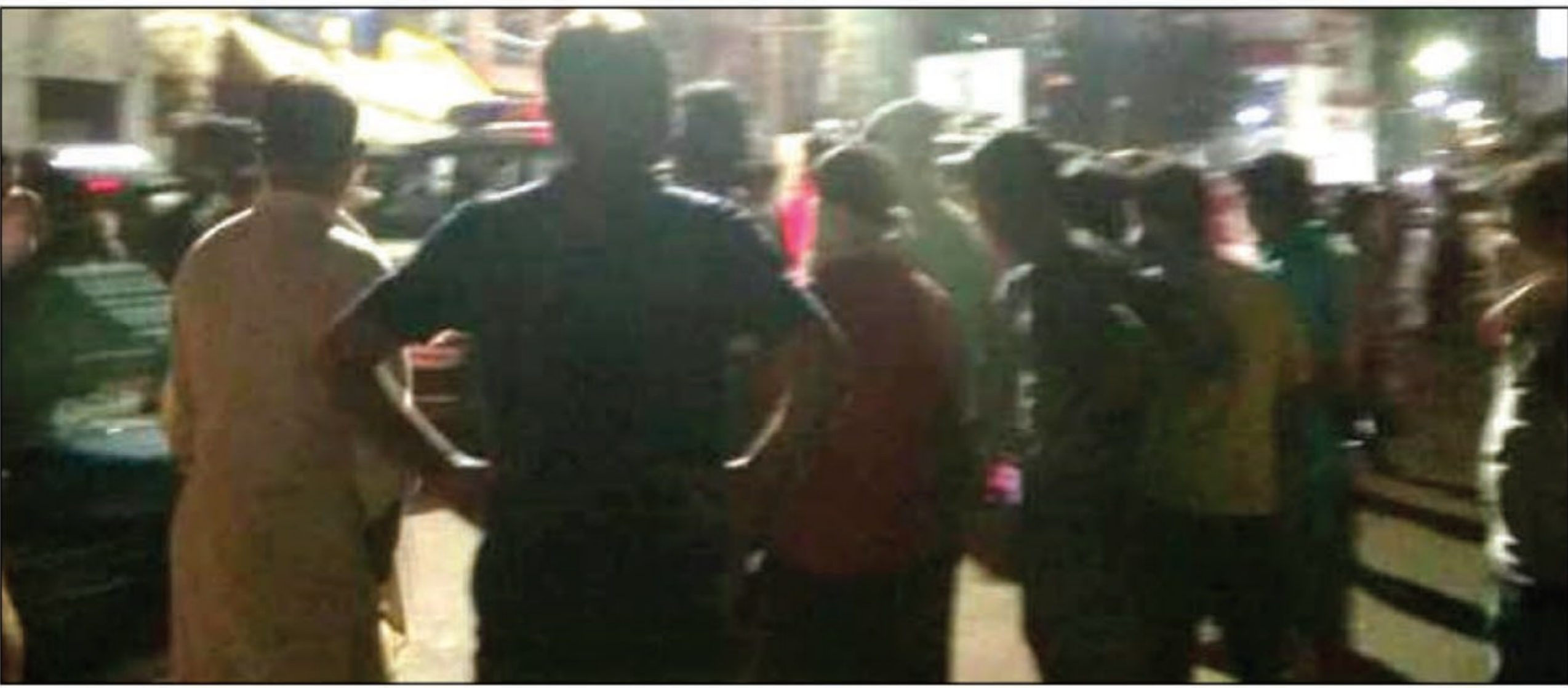
विभागीय अधिकारियों के खिलाफ नारेबाजी करते लोग

मोहल्ले के लोगों ने बताया कि न्यू खुसरोबाग उपकेंद्र में 10 एमवीए के