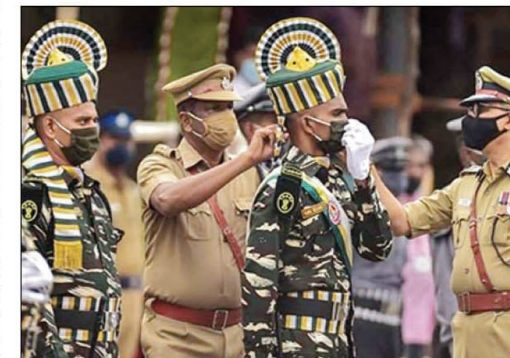
का संक्रमण न फैले, इसके लिए तमाम कवायद की जा रही है। इसके तहत ध्वजारोहण में शामिल होने वाले विभिन्न विभाग के कर्मियों के अलावा सुरक्षाकर्मियों की कोरोना जांच कराई गई है।

नई दिल्ली, जेएनएन। स्वतंत्रता दिवस पर इस बार लालकिले पर आयोजित कार्यक्रम में पहले जैसी चहल-पहल नहीं होगी। कोरोना संक्रमण के कारण इस कार्यक्रम में शामिल होने के लिए सीमित संख्या में अतिथियों को आमंत्रित किया गया है। इस दौरान शारीरिक दूरी बनी रहे और वहां मौजूद कोई भी कोरोना से संक्रमित न हो, इसको लेकर पूरी एहतियात बरती जा रही है। इसके महेनजर कार्यक्रम प्रबंधन से जुड़े विभिन्न विभागों के कर्मियों की कोरोना जांच कराई गई। लाल किला की सुरक्षा से जुड़े करीब 350 सुरक्षाकर्मियों को पहले ही क्वारंटाइन कर दिया गया है। पुलिस सूत्रों के मुताबिक, 15 अगस्त को लाल किले पर विशिष्ट अतिथियों व गणमाध्यम लोगों में कोरोना