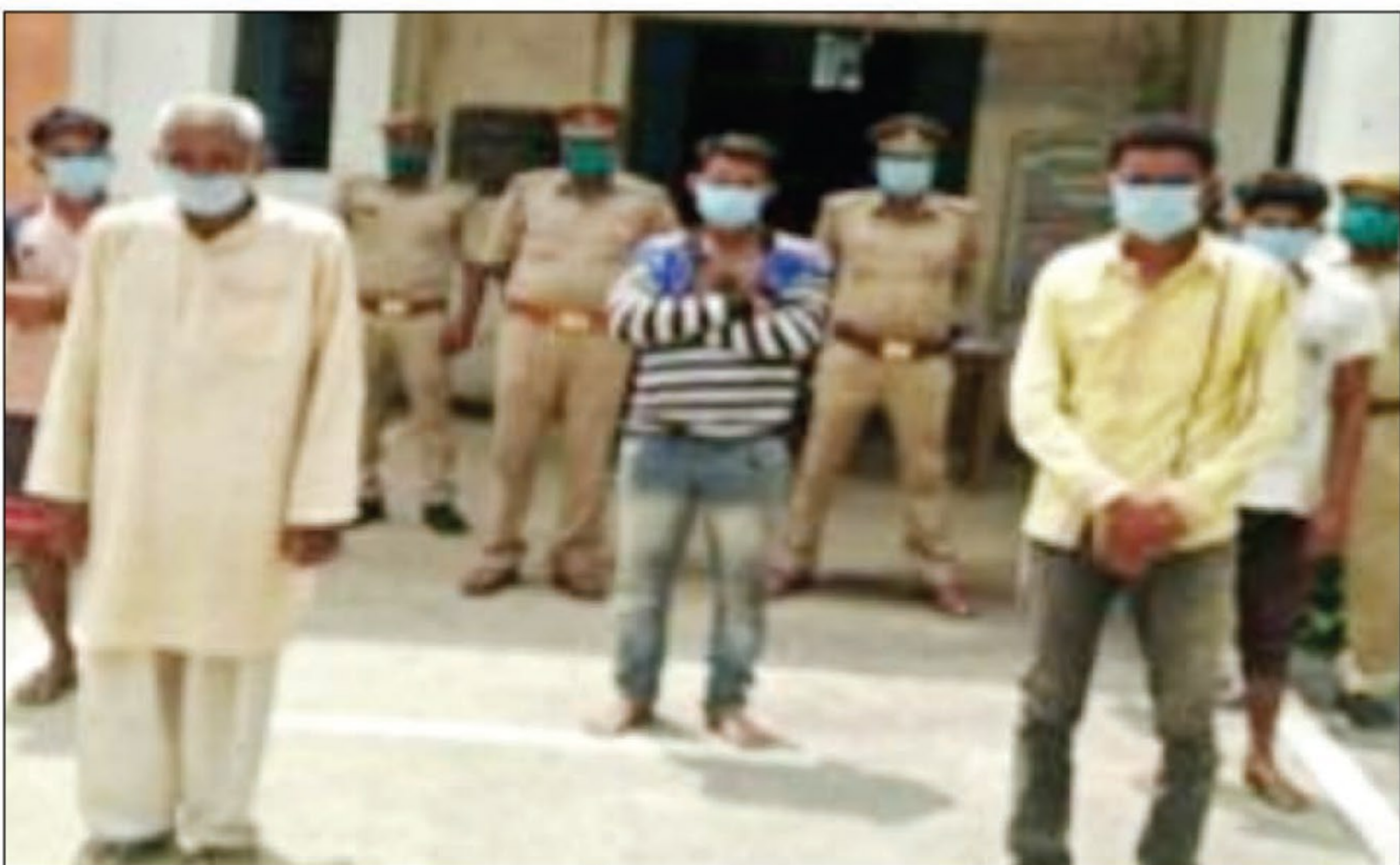
पुलिस की गिरफ्त में गौ मांस के तस्कर