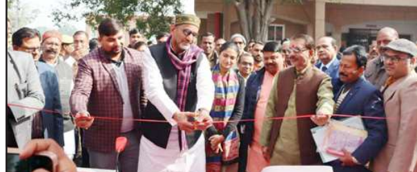
मेले का शुभारम्भ करते सांसद आदि।