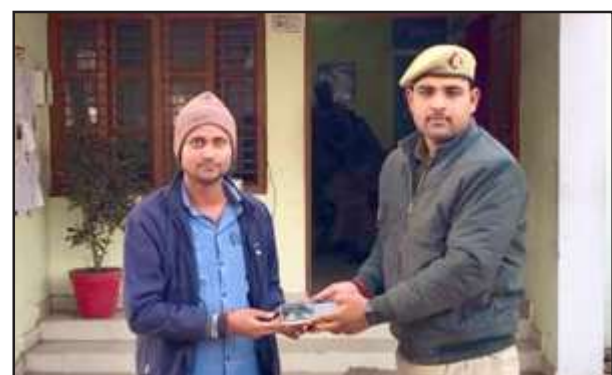
मोबाइल स्वामी को फोन देती पुलिस।