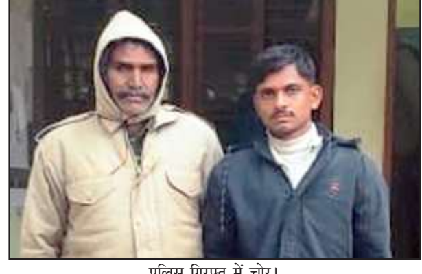
पुलिस गिरफ्त में चोर।