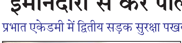
सड़क सुरक्षा पखवाड़ा पर बोलेत जिलाधिकारी संजीव रंजन।

प्रभात एकेडमी में द्वितीय सड़क सुरक्षा पखवाड़ा का हुआ समापन