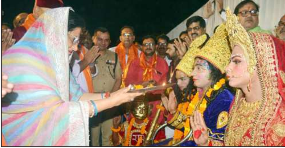
आरती उतारती पूर्व सांसद राजकुमारी रत्ना सिंह।

प्रतापगढ़। श्री रामलीला समिति प्रतापगढ़ द्वारा दसवें दिन विजयदशमी पर्व पर रामलीला मैदान में भव्य मेले का आयोजन किया गया। शाम 4 बजे श्री राम का रथ गोपाल मन्दिर से चलकर रामलीला मैदान पहुंचा। रावण का रथ पंजाबी मार्केट होते हुए रामलीला मैदान पहुंचा वहा पर राम रावण का भीषण युद्ध हुआ। प्रभु श्री राम ने रावण का वधकर रावण के प्रतिमा पुतला धू धू कर जल उठा। उपस्थित राम भक्तों ने जै श्री राम के जयकारे से पूरा रामलीला मैदान गुंजायमान हो गया। मेले में हजारों की भीड़ को सितारित करने में पुलिस व अधिकारियों लगे रहे। प्रभु श्री राम ने अहंकारी रावण का वध कर अधर्म पर धर्म की जीत का परचम लहराया। विजयदशमी के मुख्य अतिथि पूर्व सांसद