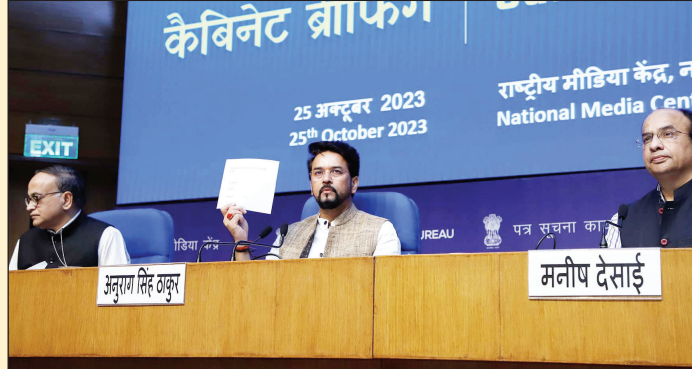
की ओर से जारी बयान में कहा गया है कि वह उर्वरक विनिमाताओं/आयातकों के माध्यम से किसानों को सब्सिडाइज्ड मूल्यों पर पीएण्डके उर्वरकों के 25 ग्रेड उपलब्ध करा रही है।

उन्होंने कहा कि सब्सिडी जारी रहेगी क्योंकि सरकार नहीं चाहती कि जब अंतरराष्ट्रीय कीमतें बढ़ें तो इसका असर देश के हमारे किसानों पर ना पड़े। डीएपी पर सब्सिडी 4500 रुपये प्रति टन जारी रहेगी। डीएपी पुरानी दर के अनुसार 1350 रुपये प्रति बोरी में मिलेगी। एनपीके 1470 रुपये प्रति बैग की कीमत पर उपलब्ध होगा। पीएंडके उर्वरकों पर सब्सिडी रबी सीजन 2023-24 (01.10.2023 से 31.03.2024 तक लागू) के लिए अनुमोदित दरों के आधार पर प्रदान की जाएगी ताकि किसानों की सस्ती कीमतों पर इन उर्वरकों की सुचारु उपलब्धता सुनिश्चित की जा सके। सरकार