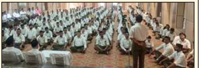
तुलसी सदन में आयोजित उत्सव में मौजूद अतिथिगण।

तुलसी सदन में मनाया गया विजयदशमी का उत्सव