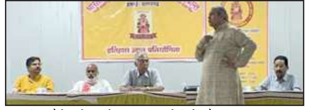
लीला पैलेस में आयोजित विचार गोष्ठी में मौजूद अतिथिगण।

उन्होंने कहा कि भारतीय इतिहास संकलन समिति, काशी प्रान्त, उत्तर प्रदेश द्वारा आगामी दिसंबर माह में जनपद के विभिन्न शिक्षण संस्थाओं, इंटर कॉलेज, विद्यालय एवं विभिन्न महाविद्यालय में इतिहास ज्ञान प्रतियोगिता का आयोजन किया जाएगा। इतिहास ज्ञान प्रतियोगिता के प्रान्त संयोजक