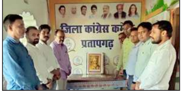
बहादुर शाह जफर की जयंती पर मौजूद कांग्रेसीगण।