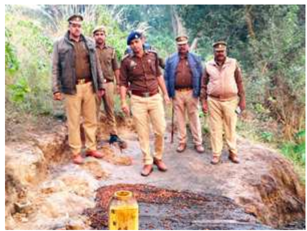
लहन नष्ट करती पुलिस टीम।