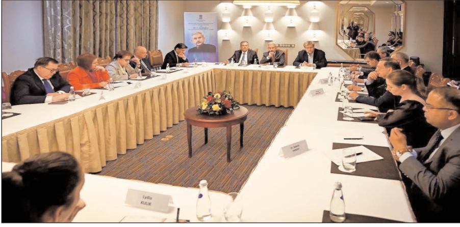
पहले रूसी रणनीतिक समुदाय के प्रमुख प्रतिनिधियों के साथ बैठक कर बातचीत की।

विदेशमंत्री जयशंकर अपने समकक्ष सर्गेई लावरोव के साथ बातचीत में विभिन्न द्विपक्षीय संबंधों तथा वैश्विक मुद्दों पर चर्चा करेंगे। वह रूस के उप प्रधानमंत्री तथा उद्योग और व्यापार मंत्री डेनिस मांतुरोव से भी मुलाकात करेंगे। उन्होंने सबसे