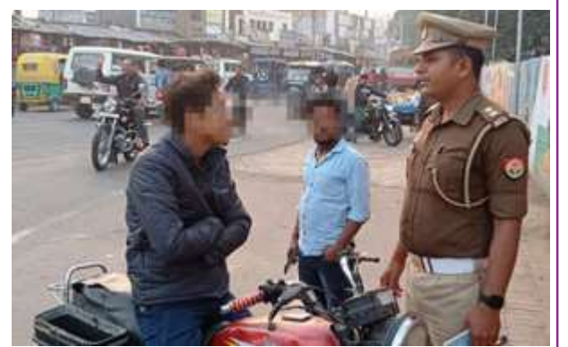
वाहनों की जांच करते यातायात पुलिस।