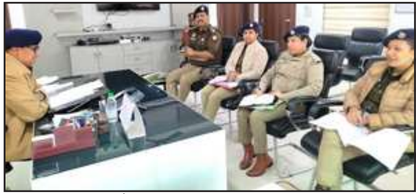
बैठक में निदेश देते डीआईजी।