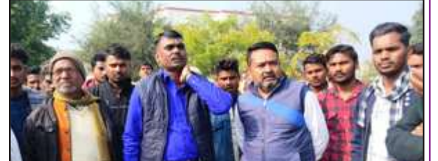
एसपी कार्यालय में मौजूद परिजन।