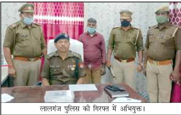
लालगंज पुलिस की गिरफ्त में अभियुक्त।

पिस्टल की नोक पर ई-रिक्शा लूट को दिया था अंजाम