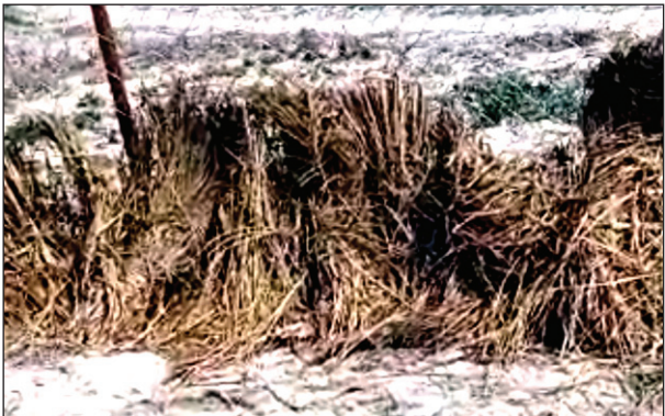
गौशाला में पशुओं को दिए जाने वाला सूखा पैरा

गया है, जो समाज के लिए एक ज्वलन्त समस्या है। लिंगानुपात को सुधारने के लिए एक चिकित्सा धिकारी, सामाजिक कार्यकर्ता एचईओ एवं जनपद स्तर के सभी पदाधिकारियों से अनुरोध किया गया कि इस समस्या को लिंगानुपात को कम करने का प्रयास अपने स्तर से किये जाने की अपेक्षा की गयी।