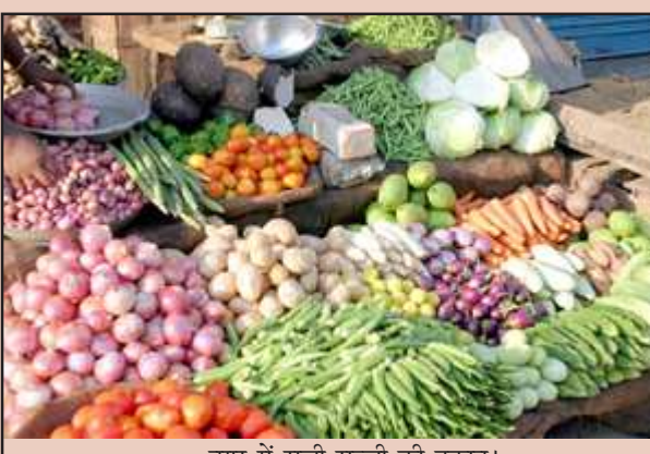
नगर में सजी सब्जी की दुकान।

आलू में पांच रुपये व खाद्य तेलों में 15 रुपये बढे दाम