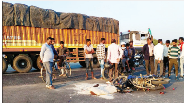
हादसे के बाद घटनास्थल पर पहुंचे ग्रामीण और मौके का दृश्य

में घुसे चोरों ने पीतल के हंडे स्टील ड्रम समेत पचास हजार रुपये के बर्तन और गैस सिलिंडर व दस बोरी गेहूँ धान समेत करीब एक लाख रुपये का सामान उठा ले गए। सुबह घटना की जानकारी होने पर किसानों के होश उड़ गए। भुक्त भोगियों ने घटना की तहरीर थाना पुलिस को दिया है। तहरीर के बाद पहुंची पुलिस ने घटनास्थलों का निरीक्षण किया है मखदूमपुर चौकी क्षेत्र में इसके पूर्व दर्जनों चोरों को चोरियां हो चुकी हैं जिनका खुलासा तमाम प्रयास के बाद भी पुलिस नहीं कर सकी है।