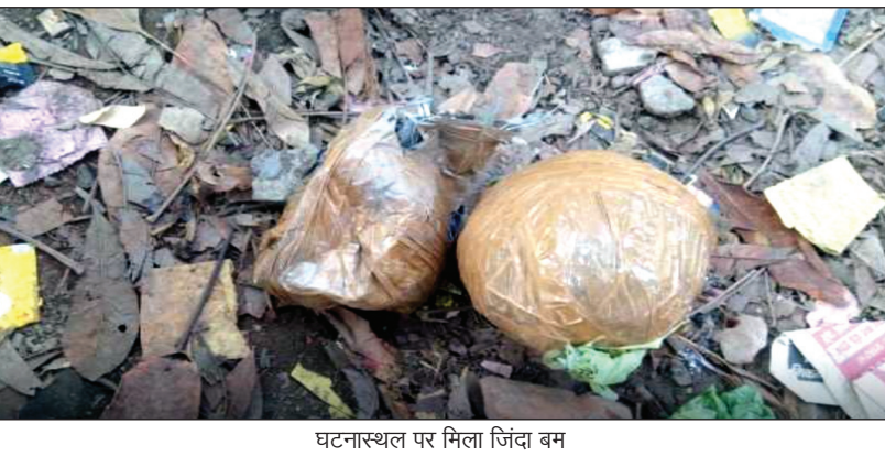
घटनास्थल पर मिला जिंदा बम

हमलावर भाग निकले थे। पुलिस मामले की छानबीन करने के साथ ही हमलावरों के बारे में पता लगा रही है।