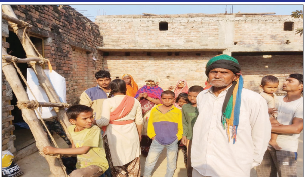
चोरी की घटना के बाद मौके पर मौजूद परिजन और ग्रामीण

कौशाम्बी। पिपरी थाना क्षेत्र के मुरादपुर गांव में शुक्रवार की रात चोरों ने दो किसानों के सूने घरों को अपना निशाना बनाया घर में संधमारी कर और ताला तोड़ कर नकदी जेवर कब्जे बर्तन आनाज समेत करीब चार लाख रुपये का सामान चोरों ने घर कर दिया घटना की जानकारी परिजनों को सुबह हुई तो गृहस्वामियों के होश उड़ गए भुक्तभोगियों ने घटना की तहरीर पुलिस को दिया है। तहरीर मिलने के बाद पहुंची पुलिस ने घटनास्थल का निरीक्षण किया है थाना क्षेत्र में इसके पूर्व भी दर्जनों चोरीयों हो चुकी हैं जिनका खुलासा पुलिस नहीं कर सकी है।