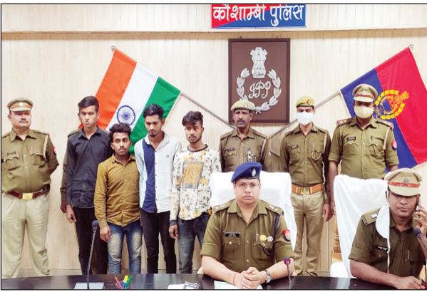
बाइक बरामदगी की जानकारी देते पुलिस अधीक्षक पीछे खड़े बाइक चोर गैंग के सदस्य