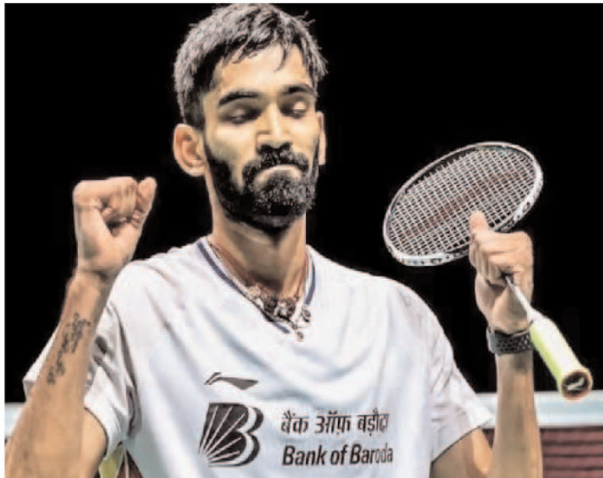
चैंपियनशिप में किदांबी पुरुष खिलाता जीतने वाले एकमात्र एकल के फाइनल में पहुंचने वाले भारतीय खिलाड़ी भी हैं।

मुंबई। भारतीय बैडमिंटन खिलाड़ी किदांबी श्रीकांत ने कहा कि इस साल के राष्ट्रमंडल खेल में फिर से स्वर्ण पदक जीतना उनका लक्ष्य है। कोरोना के कारण इंडिया ओपन से बाहर होने के कारण उन्हें निराशा हुई थी। उनका कहना है कि वह भाग्यशाली हैं कि संक्रमण से जल्दी ठीक हो गया और प्रशिक्षण शुरू किया। श्रीकांत को 8-13 मार्च के बीच आयोजित जर्मन ओपन सुपर से अपने खेल सत्र की शुरुआत करनी है। पूर्व विश्व नंबर एक खिलाड़ी और ओलंपियन किदांबी श्रीकांत भारत के सर्वश्रेष्ठ बैडमिंटन खिलाड़ियों में से एक हैं। विश्व रैंकिंग में नंबर 1 स्थान पर पहुंचने के साथ-साथ वह विश्व चैंपियनशिप में रजत पदक जीतने वाले पहले भारतीय व्यक्ति बने। 2021 बैडमिंटन विश्व और बीडब्ल्यूएफ टूर में सुपर सीरीज प्रीमियर इवेंट में पुरुषों का