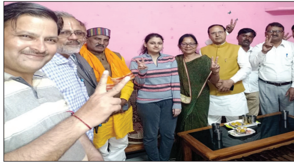
यूक्रेन से अपने वतन और फिर सकुशल घर पहुंचे छात्रों ने अपने परिजनों से मिलकर खुशी बाँटते