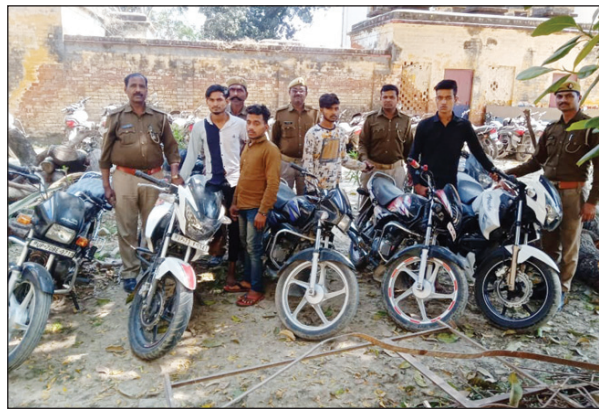
चोरी की गई, बाइकों के साथ पुलिस टीम