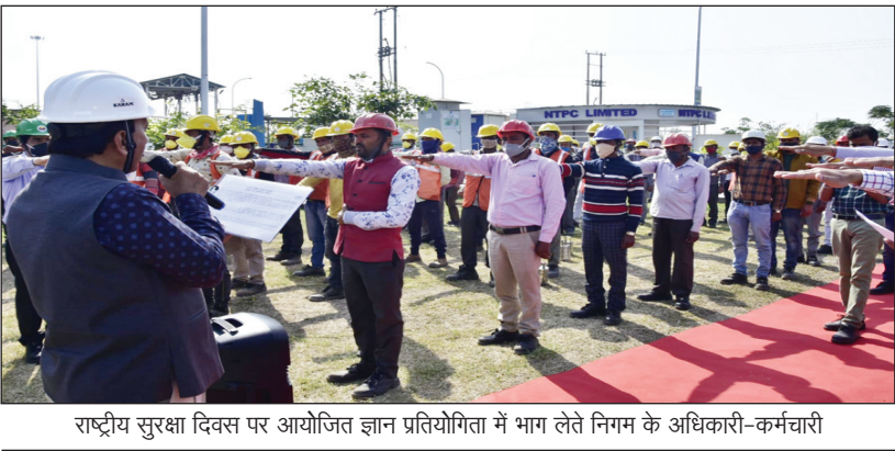
राष्ट्रीय सुरक्षा दिवस पर आयोजित ज्ञान प्रतियोगिता में भाग लेते निगम के अधिकारी-कर्मचारी