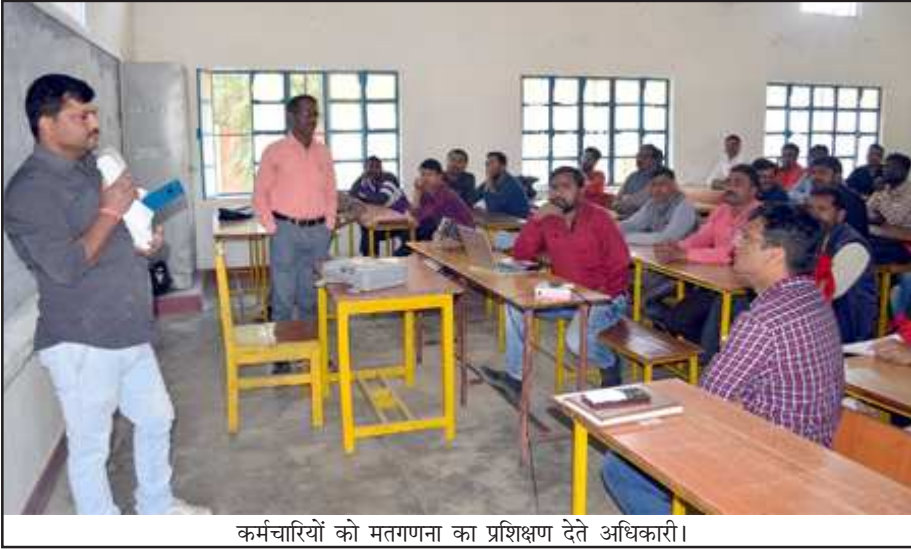
कर्मचारियों को मतगणना का प्रशिक्षण देते अधिकारी।