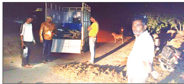
हादसे के बाद दुर्घटनास्थल पर मौजूद लोग

शुरू हो गया गुलामी पुर क्षेत्र के कई ढाबों में अफीम का व्यवसाय बेखौफ तरीके से हो रहा है इन दिनों ननमई गांव के मोड़ के पास एक ढाबे में बेखौफ तरीके से अफीम टुक चालकों को उपलब्ध कराई जाती है कनवार क्षेत्र के भी कुछ ढाबों में अफीम का व्यवसाय हो रहा है बताते चलें कि पंजाब हरियाणा से आने वाले ट्रक चालक अफीम के नशे का सेवन करते हैं और उन चालकों को मोड़ के अफीम की धरती पर ढाबे के आड़ में आसानी से अफीम मिल जाती है इस व्यवसाय को माफियाओं के बोलचाल की भाषा में काली माई के नाम से जाना जाता है लंबे समय से अफीम के व्यवसाय में लिप्त ढाबा संचालक पर कार्यवाही न हो पाना थाना पुलिस की शिथिलता का जीता जागता उदाहरण है।