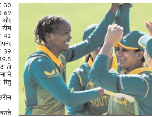
दक्षिण अफ्रीका की बेहतरीन वापसी 208 रन के लक्ष्य का पीछा करते हुए बांग्लादेश ने शानदार शुरुआत की और पहले विकेट के पहले विकेट के लिए 69 रन जोड़े। इसके बाद बांग्लादेश की टीम बिखर गई और 85

हुए बांग्लादेश ने शानदार शुरुआत की और पहले विकेट के पहले विकेट के लिए 69 रन जोड़े। इसके बाद बांग्लादेश की टीम बिखर गई और 85