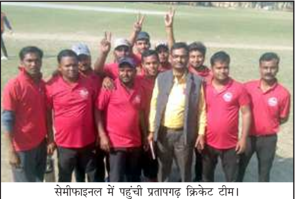
सेमीफाइनल में पहुंची प्रतापगढ़ क्रिकेट टीम।

बता दें कि मेंस यूनिटन की अगुवाई में लखनऊ स्टेडियम में क्रिकेट लीग मैच चल रहा है। जिसमें 16 टीमों ने भाग लिया है। जिसमें प्रतापगढ़ नॉर्दर्न रेलवे मेंस