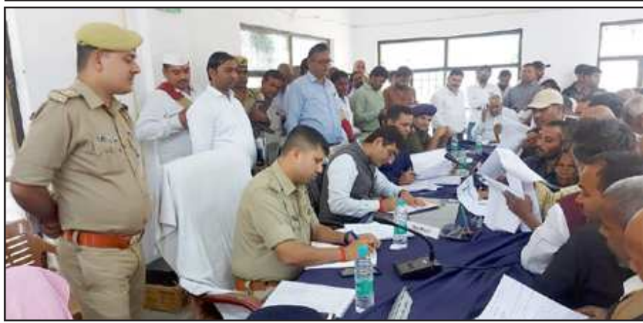
संपूर्ण समाधान में फरियादियों की समस्या सुनते अधिकारी।

करने के निर्देश दिये हैं। जिलाधिकारी ने कहा कि जनशिकायतों का निस्तारण शासन की सर्वोच्च प्राथमिकता वाले बिंदुओं में से एक है। इसमें किसी भी प्रकार की लापरवाही या उदासीनता न