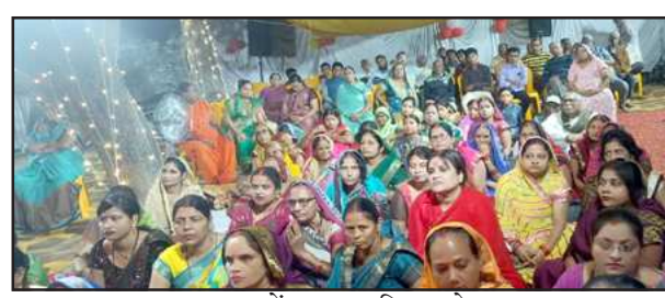
भागवत कथा में सुदामा चरित्र सुनते श्राद्धलु।

कथा व्यास ने कहा कि सच्चा मित्र वही है, जो अपने मित्र की परेशानी को समझे और बिना बताए ही मदद कर दे