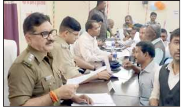
शिकायतों को सुनते अधिकारिगण।

विकास की 38ए समाज कल्याण विभाग की 04ए शिक्षा विभाग की 01 अन्य विभागों की 78 शिकायतें थीं। जिनमें से 12 शिकायतों का मौके पर ही निस्तारण कर दिया गया। शेष शिकायतों के निस्तारण हेतु जिलाधिकारी ने सभी सम्बंधित विभागों के अधिकारियों को आज ही अपने विभागों से सम्बंधित शिकायतों प्रार्थना पत्रों को प्राप्त करते हुए निर्धारित समय सीमा में गुणवत्ता के साथ निस्तारित करने के निर्देश दिये हैं। उन्होंने सचेत करते हुए कहा है कि प्रत्येक दशा में शिकायतों का निस्तारण निर्धारित समय सीमा में अनिवार्य रूप से सुनिश्चित कर लिया जाये। इसमें किसी भी प्रकार की लापरवाही या उदासीनता क्षम्य नहीं होगी। इस अवसर पर एसडीएम मेजाए मुख्य चिकित्साधिकारी श्री नानक सरन सहित सभी सम्बंधित अधिकारीगण उपस्थित रहे।