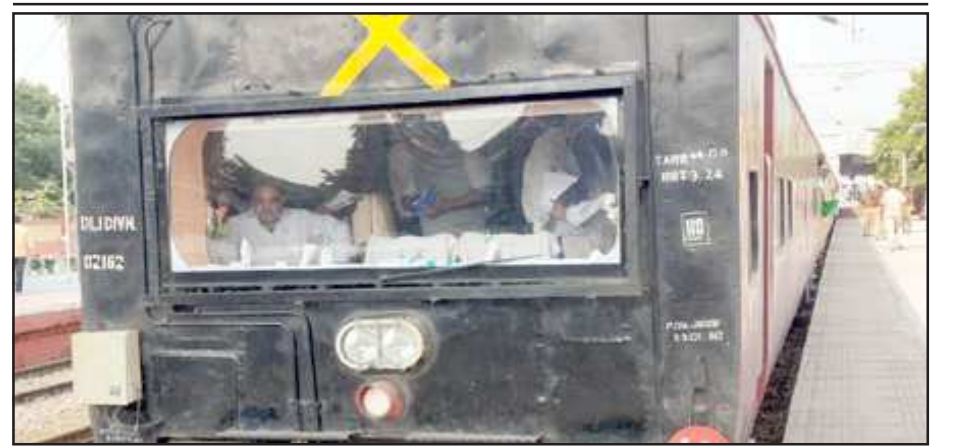
प्लेटफार्म पर ट्रेन रुकने पर विंडो से निरीक्षण करते रेल मंत्री।

आगे खड़े होकर उनका इंतजार कर रहे रेल कर्मचारियों ने देखा तो वे स्वागत करने के लिए पीछे भागे। लेकिन तब तक रेल मंत्री कोच में चढ़ चुके थे। सूत्रों के अनुसार अपने साथ चल रहे अधिकारियों से उन्होंने स्टेशन के