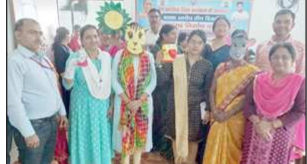
टीएलएम निर्माण कार्यशाला में प्रतिभागी शिक्षकगण