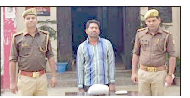
पुलिस द्वारा पकड़ा गया गांजा तस्कर गिरफ्तार।