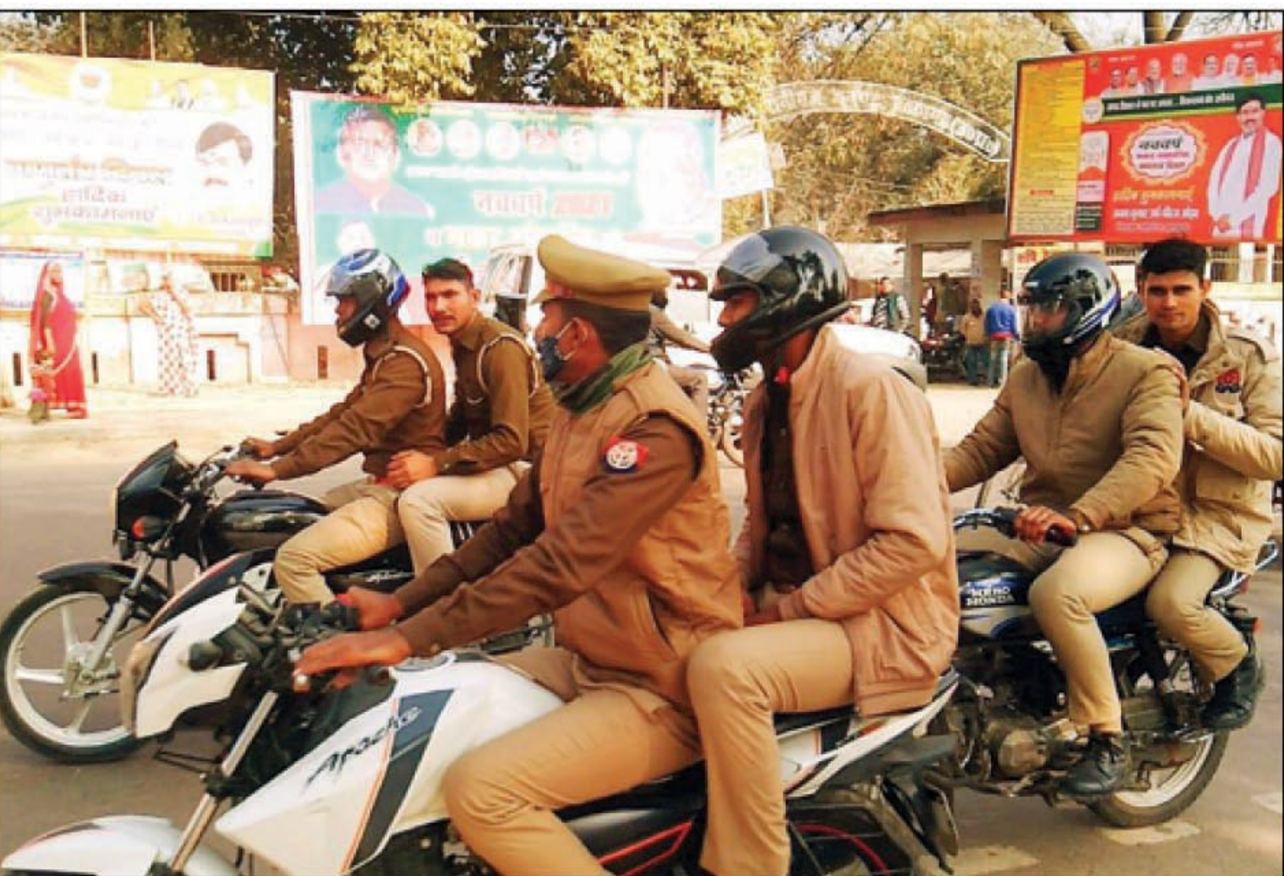
गुरुण वाहन अभियान की अगुवाई करते सीओ रानीगंज

बाधवा। स्थानीय बाजार में हेयर कटिंग सैलून व जनरल स्टोर के सामने खड़ी साइकिल को चुरा कर भाग रहे चोर का पीछा कर ग्राहकों ने दबोच लिया। पुलिस चोर को अपने साथ थाने ले गयी। हेयर कटिंग सैलून के मालिक के लड़के ने चोर को साइकिल ले जाते देखकर अपने पिता को बताया। साइकिल चोरी होने की बात सुनकर दुकानदार अपने लड़के को मोटरसाइकिल पर बैठाकर साइकिल सहित भाग रहे चोर का पीछा कर उसे रायपुर जलालपुर गांव के पास साइकिल सहित दबोच लिया।