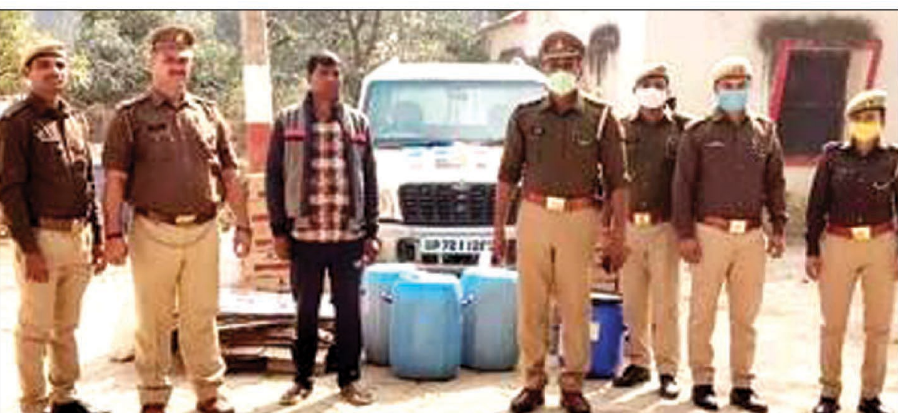
सांगीपुर में पकड़ी गई अवैध देशी शराब

प्रतापगढ़। सांगीपुर पुलिस ने बुधवार रात पूरे सुबेदार अंरीपुर नगीर में दबिश दी। इस दौरान एक आरोपित को घर से गिरफ्तार किया। उसकी निशानदेही पर पुलिस ने कुछ दूर से 28