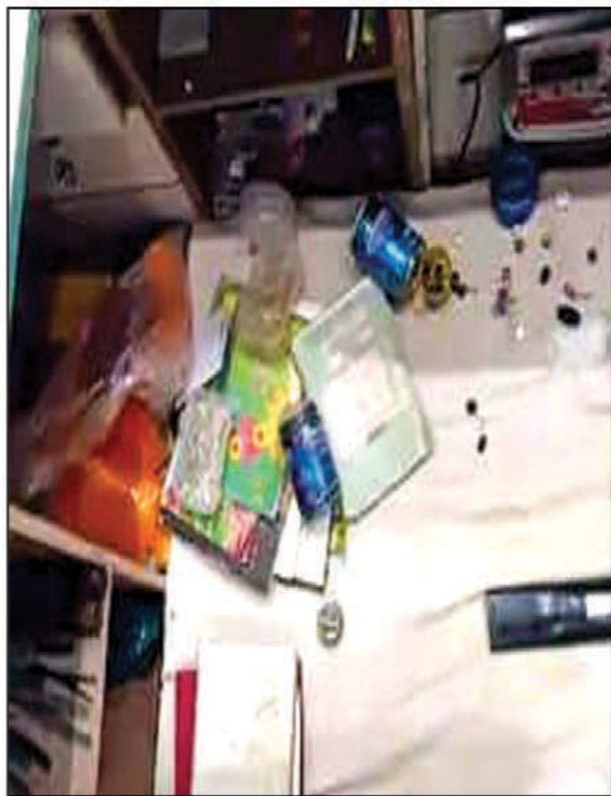
सराफा की दुकान में चोरी के बाद बिखरा पड़ा सामान

कुण्डा। एक ही रात में बाजार की तीन सराफा दुकानों का शटर तोड़कर चोरों ने लाखों की चोरी की। दुकान में रखी नकदी के साथ सोने-चांदी के जेवर समेत लिए। सुबह घटना की जानकारी होते ही व्यापारियों में आक्रोश फैल गया। माल की बरामदगी व आरोपितों की गिरफ्तारी की मांग पर दुकानें बंद कर दीं। पुलिस ने समझाया तो शांत हुए।