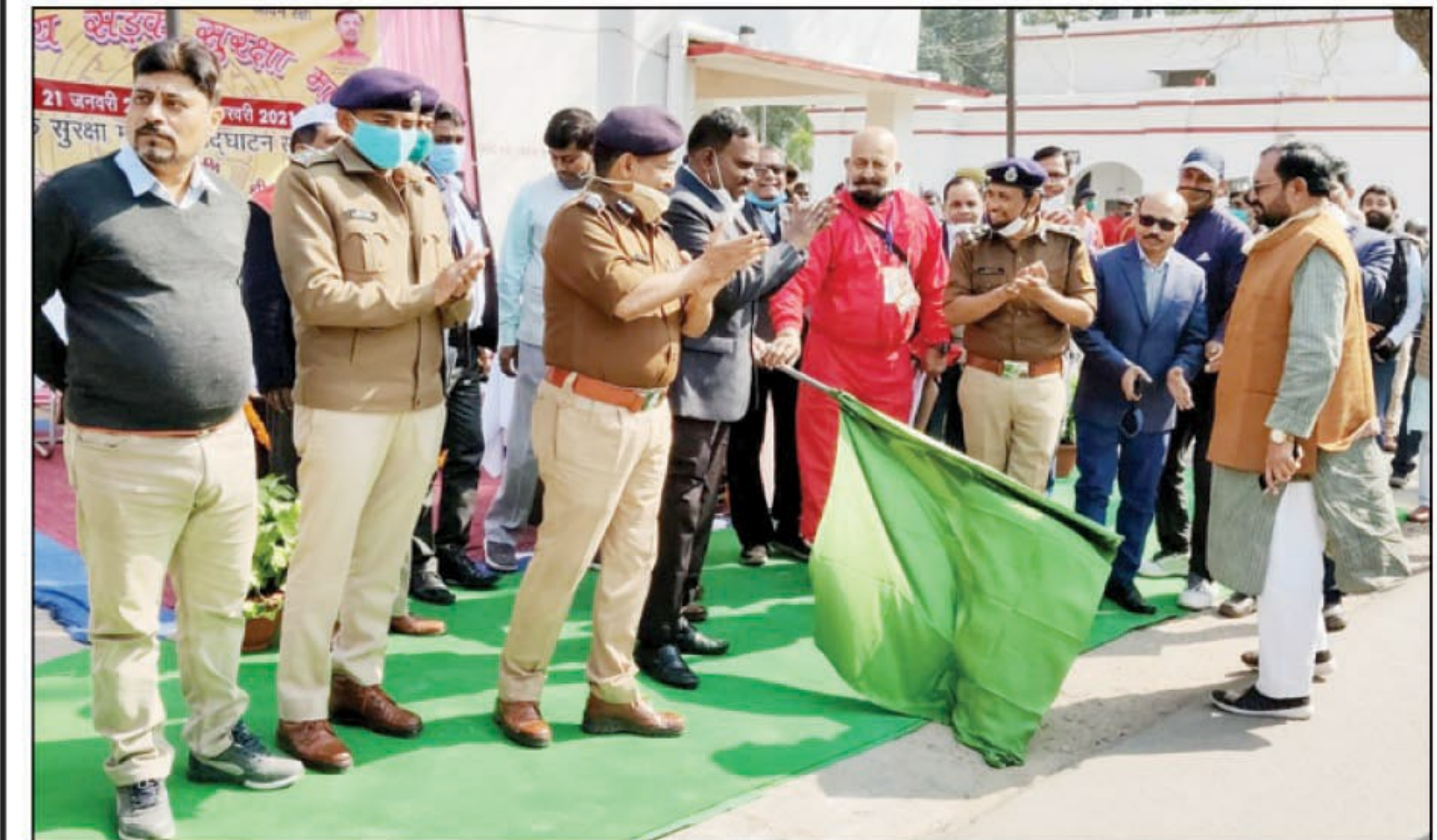
हरी झण्डी दिखाकर सड़क सुरक्षा माह का शुभारंभ करते मण्डलायुक्त व अपर पुलिस महानिदेशक व प्रचार झण्डों/बैनर के साथ लोगों को जागरूक करते प्रचार वाहन