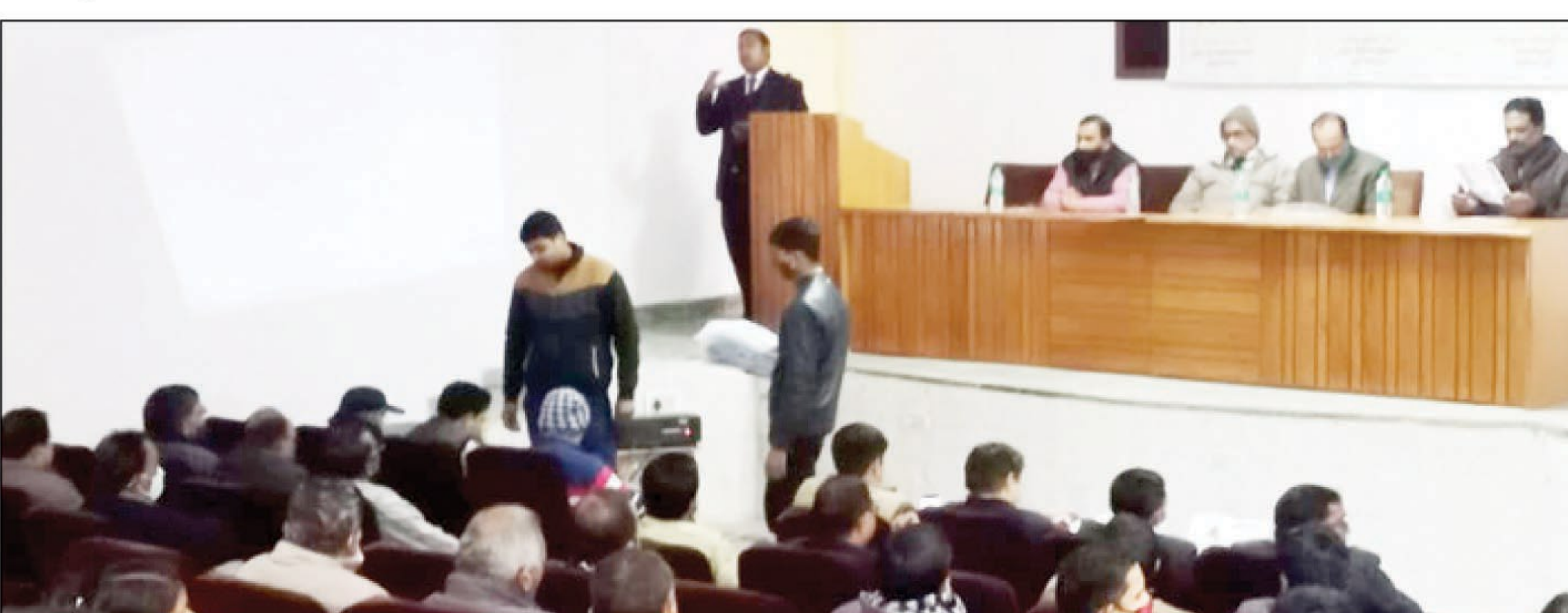
पशु चिकित्सकों को जागरूक करते विशेषज्ञ

नवावगंज। बुधवार को जनपद के विकास भवन के सरस भवन प्रांगण में ग्लैण्डर्स एवं फासी रोग हेतु आयोजित कार्यक्रम में पशु चिकित्सकों का प्रशिक्षण दिया गया। ग्लैण्डर्स एवं फासी रोग एक